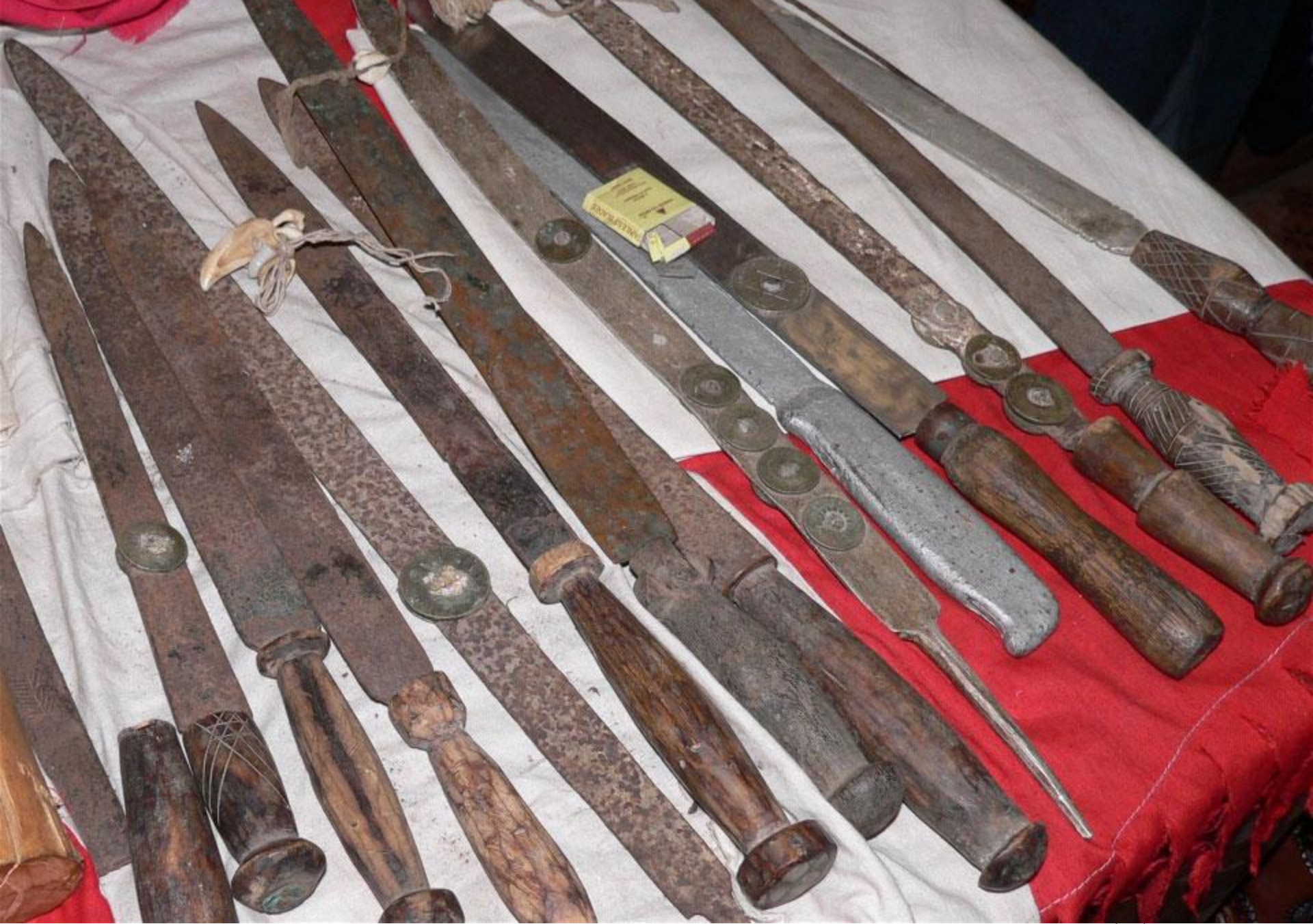
Ceremonial knives used in FGM/C by members of the Bondo society in Sierra Leone