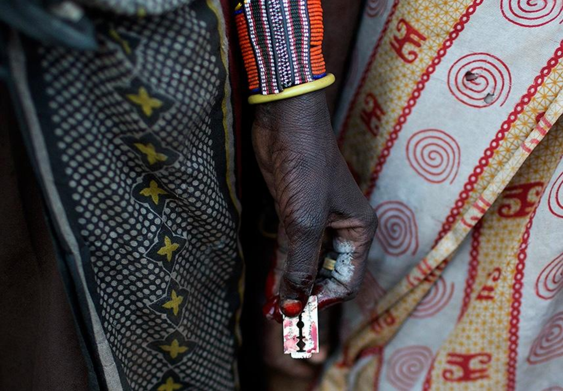
Фото: Siegfried Modola / Reuters http://lenta.ru/news/2015/09/25/fgmnotsocial/