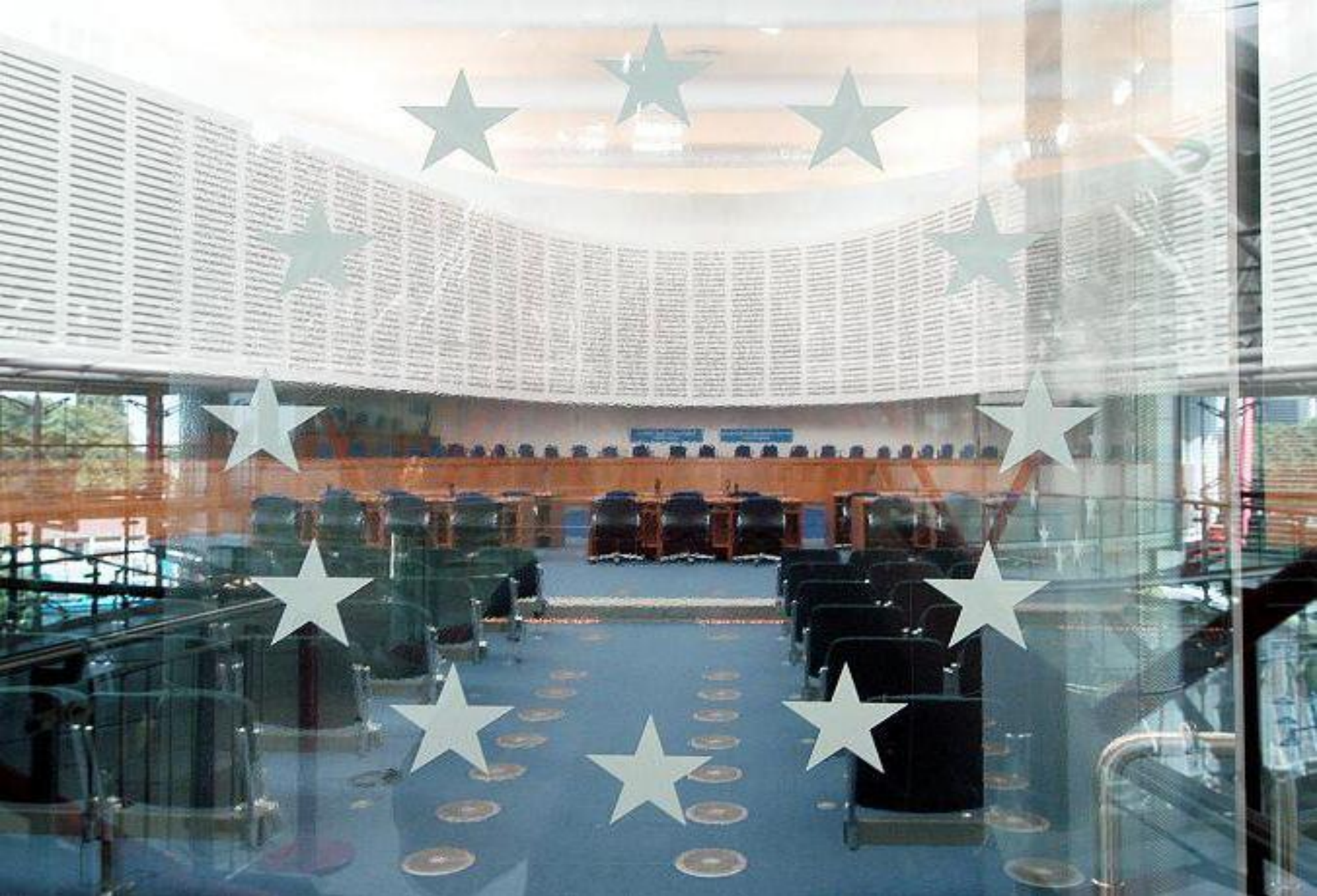
Зал заседаний Европейского суда по правам человека в Страсбурге