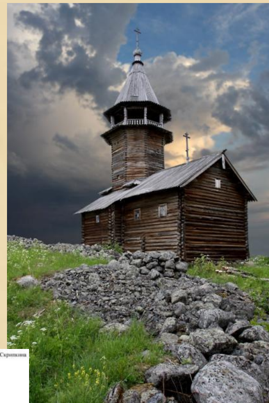
Часовня Архангела Михаила