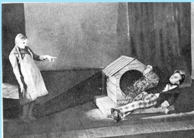
Сцена з вистави "Маклена Граса" М.Куліша. "Березіль", 1933 р.

Перші п'єси «97» (1924), «Комуна в степах» (1925) переважно реалістично-побутового характеру, комедія-фарс «Хулій Хурина» (1926) має експресіоністичні риси; «Зона» (1926) — гостра сатира на партійних кар'єристів, комедія «Отак загинув Гуска» (1927) має елементи символізму. Творчою вершиною стали п'єси «Народний Малахій» (1928), «Мина Мазайло» (1929). Тема цих п'єс — облудність ідеалів комуністичної революції, національне пристосуванство і фальш міщанського середовища. «Патетична соната» (1929) показує боротьбу трьох сил — комуністичної, білогвардійської і національно-патріотичної у 1917-18. У п'єсі використано засоби тогочасної експериментальної драми у поєднанні з традиційним українським театром (вертеп).