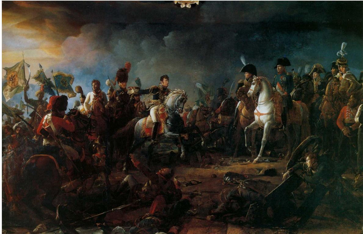
Накануне Аустерлицкой битвы