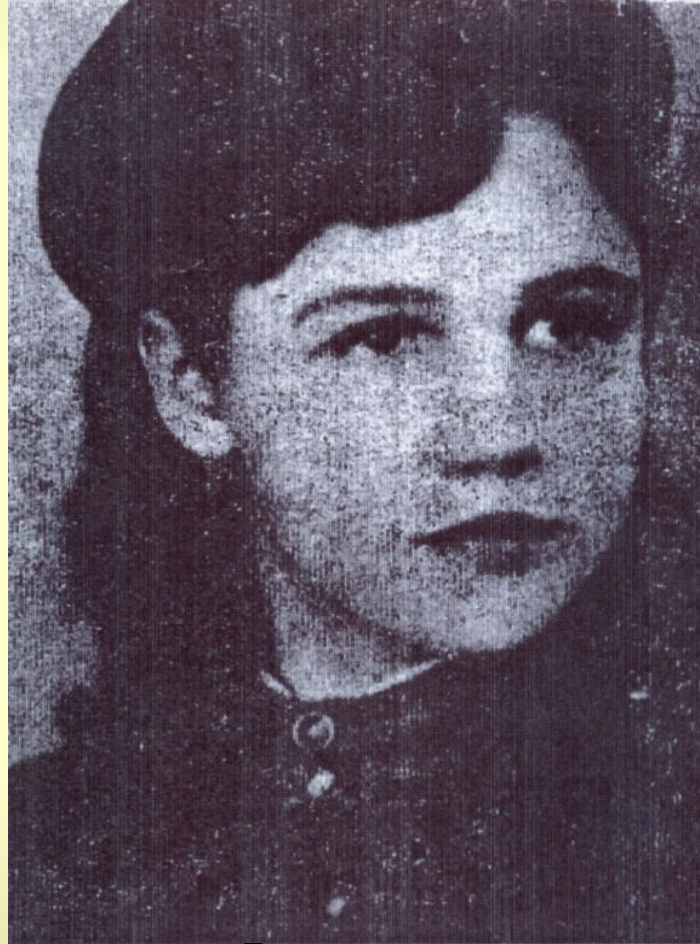
Нина Киволя. 40-е годы.