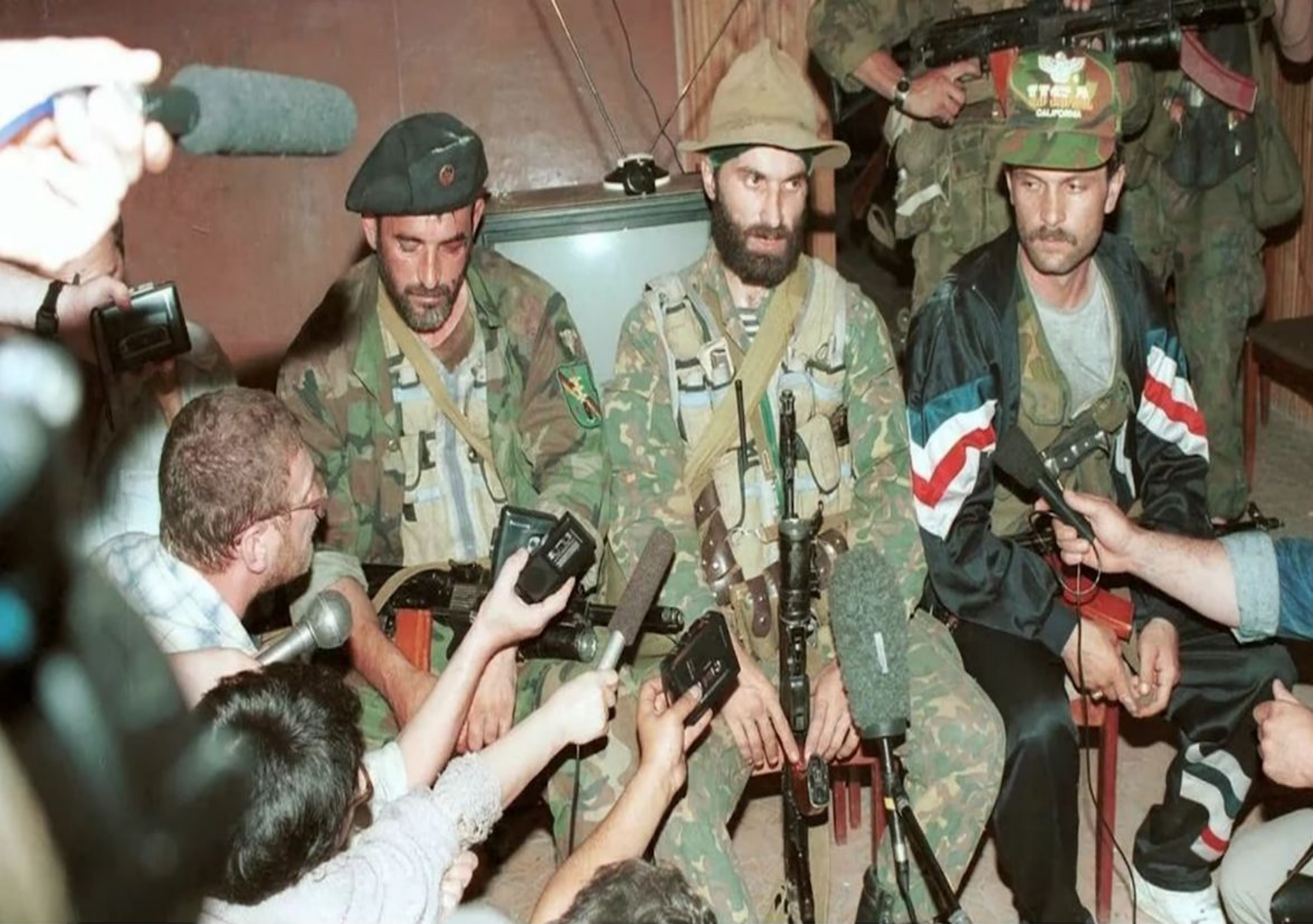
Лидер террористов Ш.Басаев (в центре) в Буденновске. Фото 1995