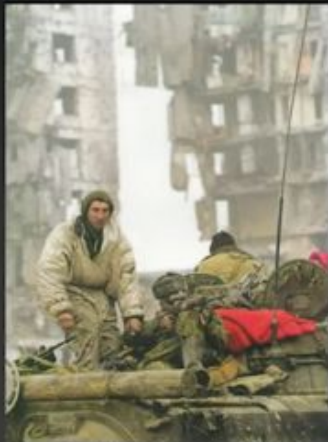
Бойцы ВС РФ в Грозном. 2000