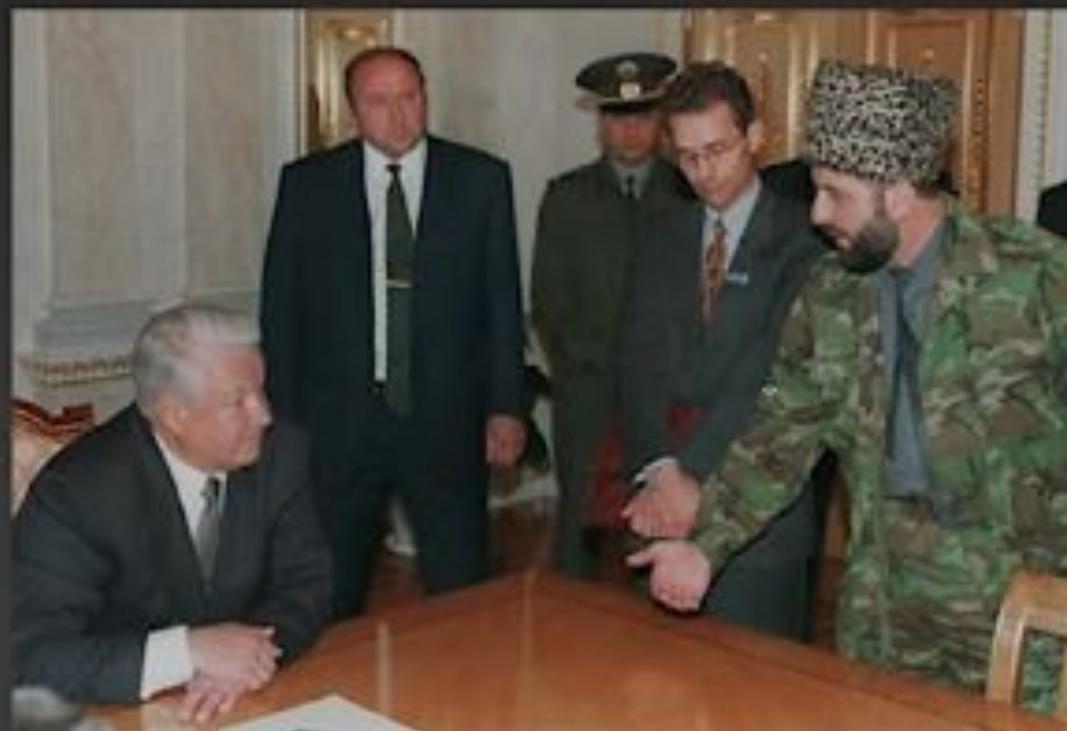
Переговоры о прекращении огня в Чечне. 1996

14 августа 1996 – соглашение об окончательном прекращении огня