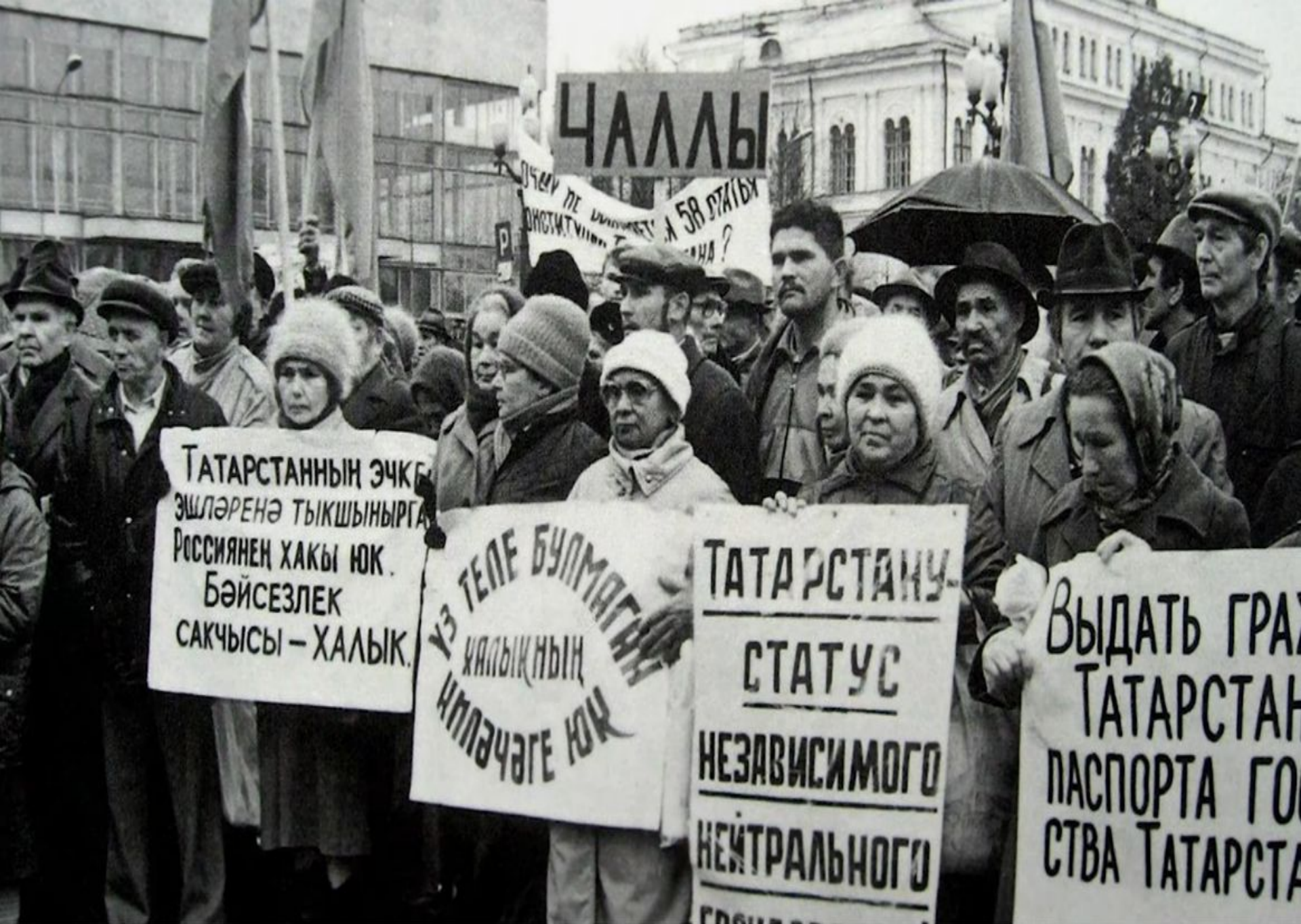
Митинг сторонников независимости Татарстана. Набережные Челны. Фото