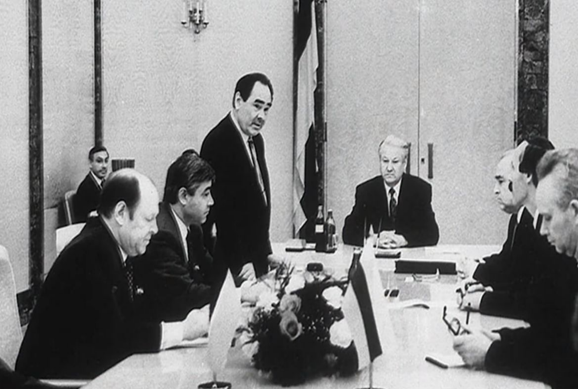
Подписание Договора о разграничении полномочий между РФ и Татарстаном Фото 1994