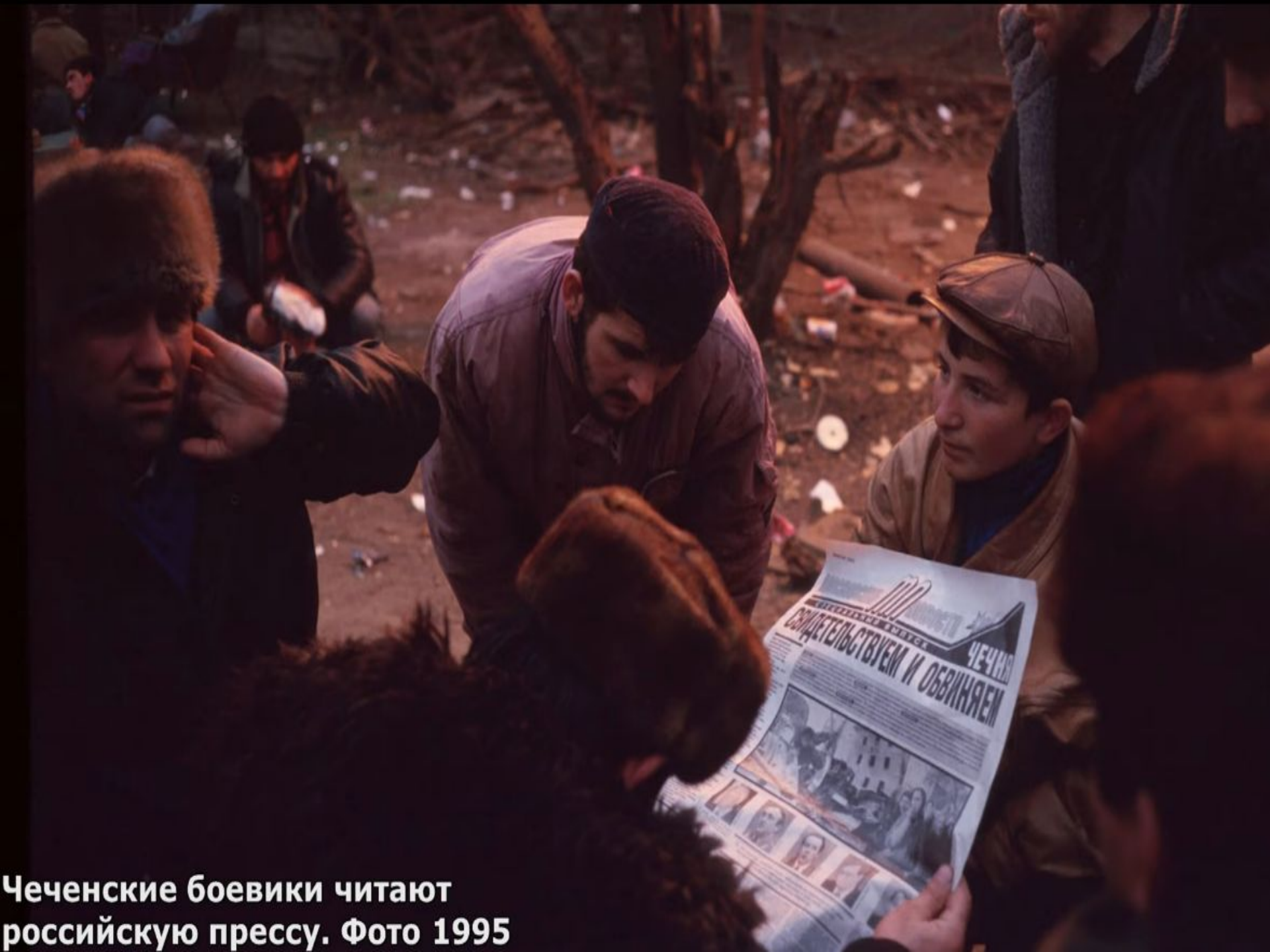
Чеченские боевики читают российскую прессу. Фото 1995