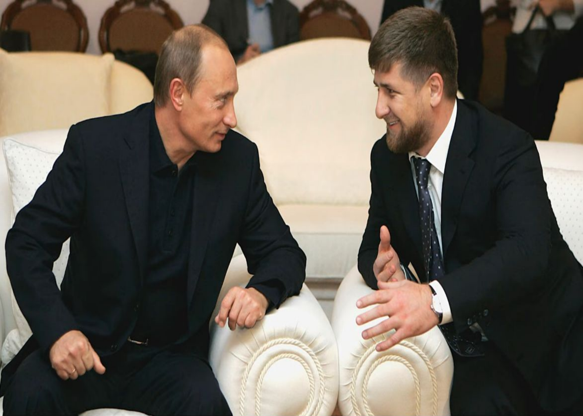
В.В.Путин и Р.А.Кадыров. Фото 2007