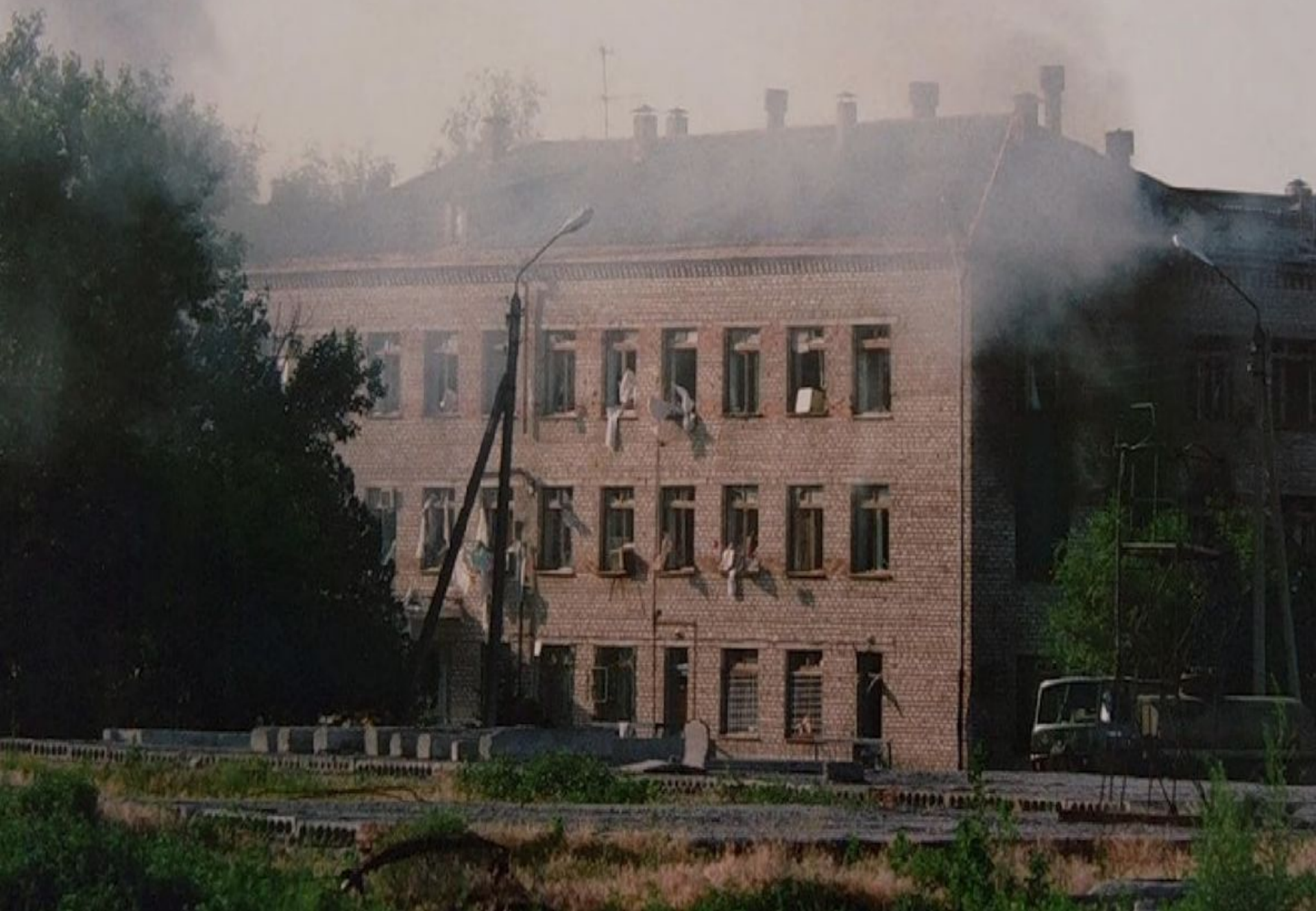
Больница, захваченная террористами. Буденновск. Фото 1995