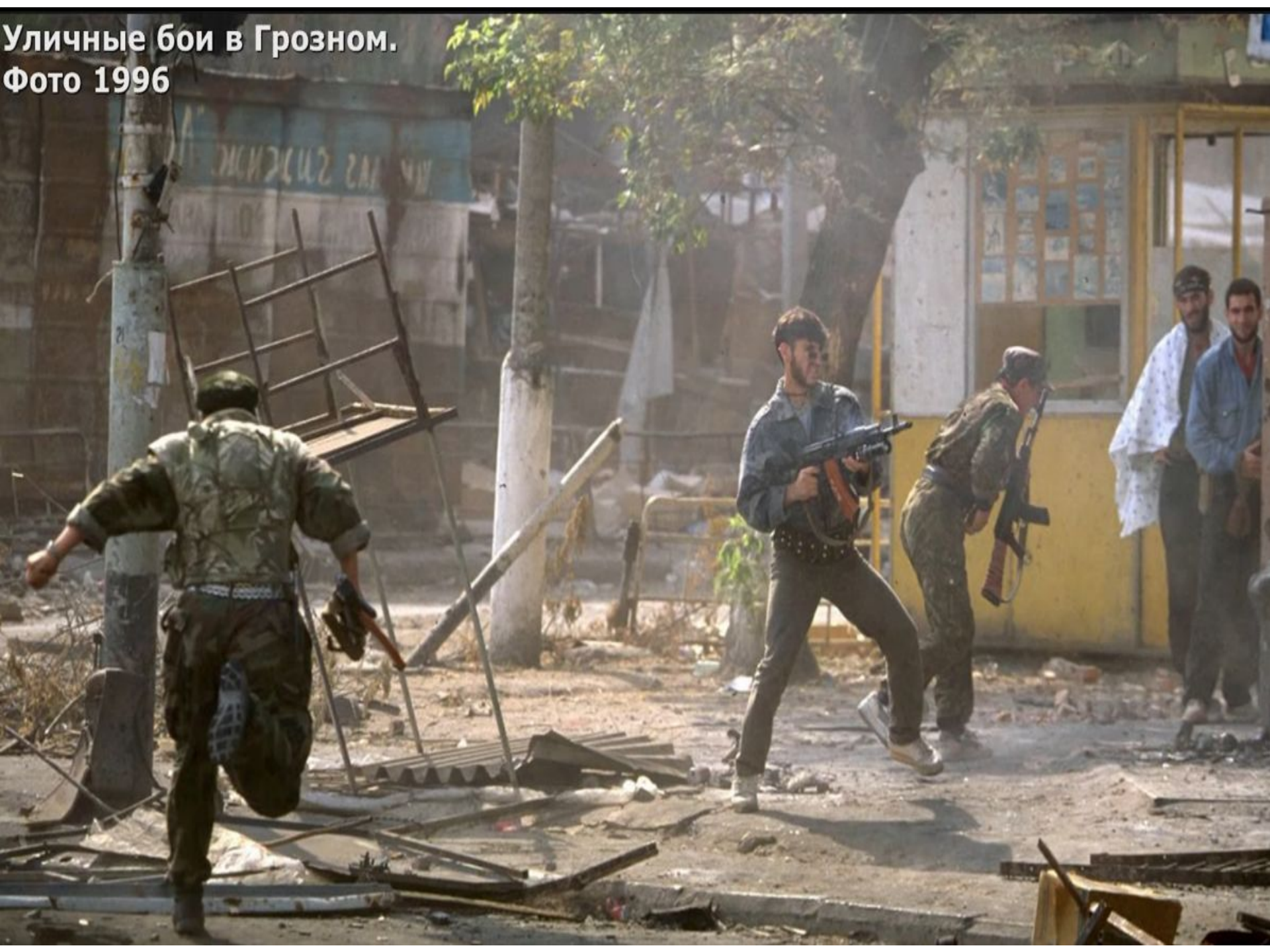
Уличные бои в Грозном. Фото 1996