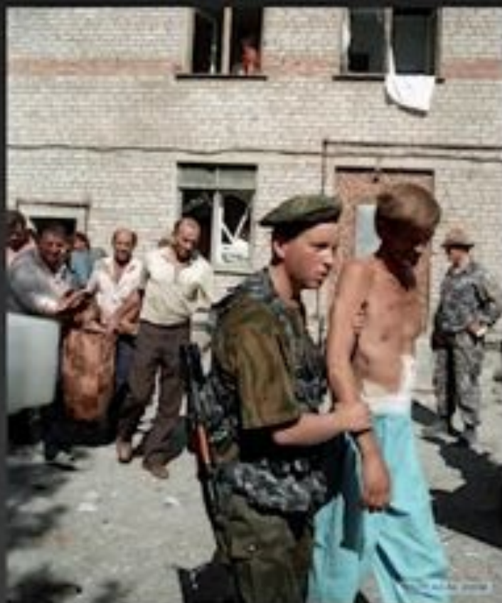
Освобождение заложников. Буденновск. 1995