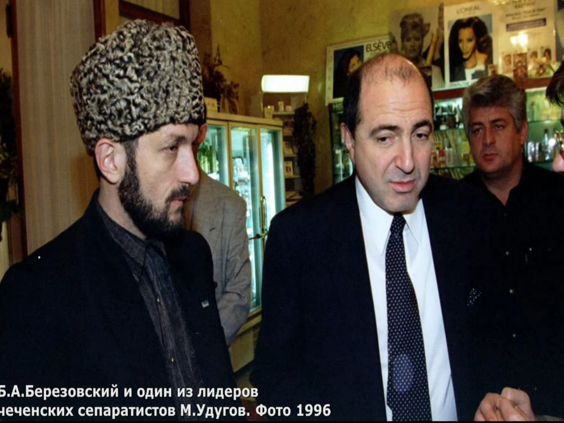
Б.А.Березовский и один из лидеров чеченских сепаратистов М.Удугов. Фото 1996