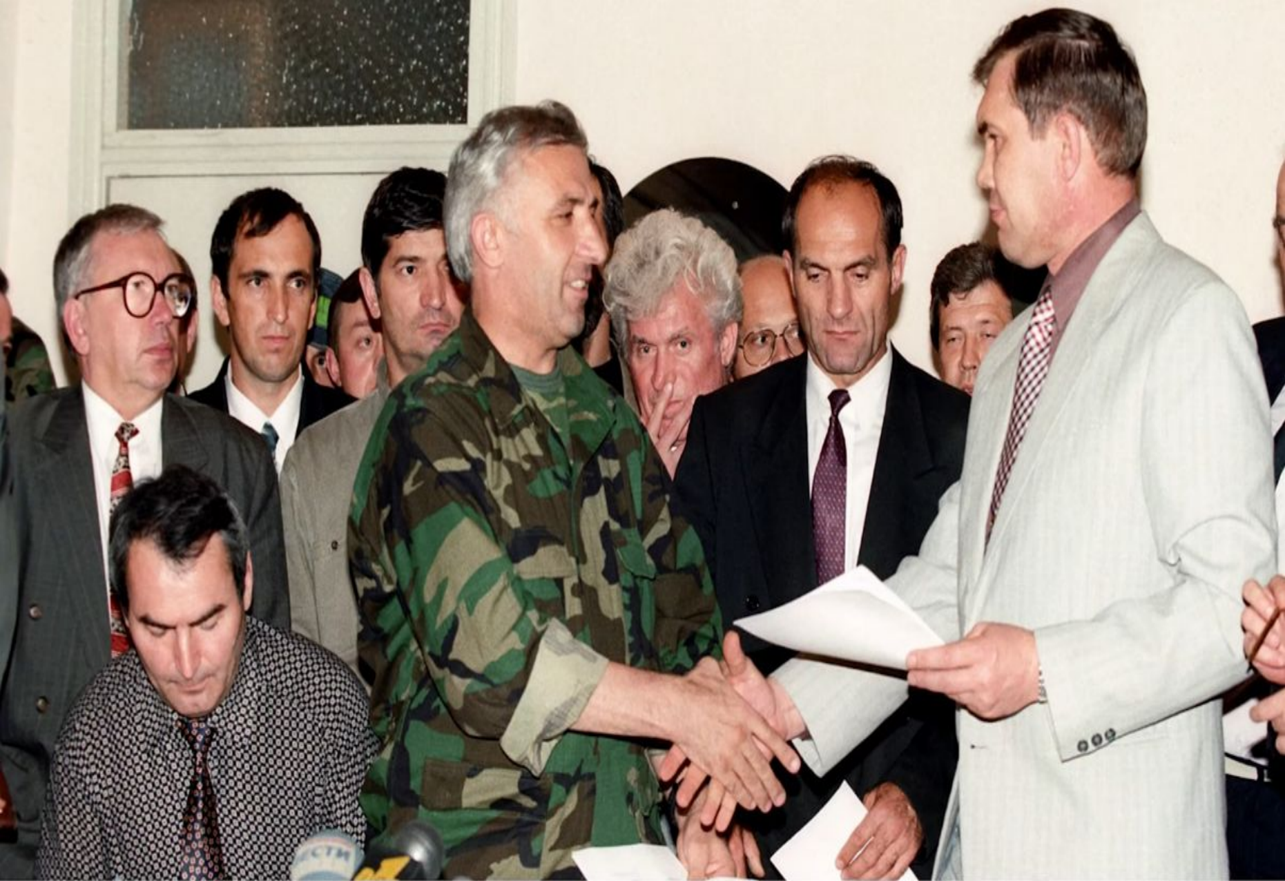
А.Масхадов и А.И.Лебедь после подписания Хасавюртских соглашений. Фото 1996