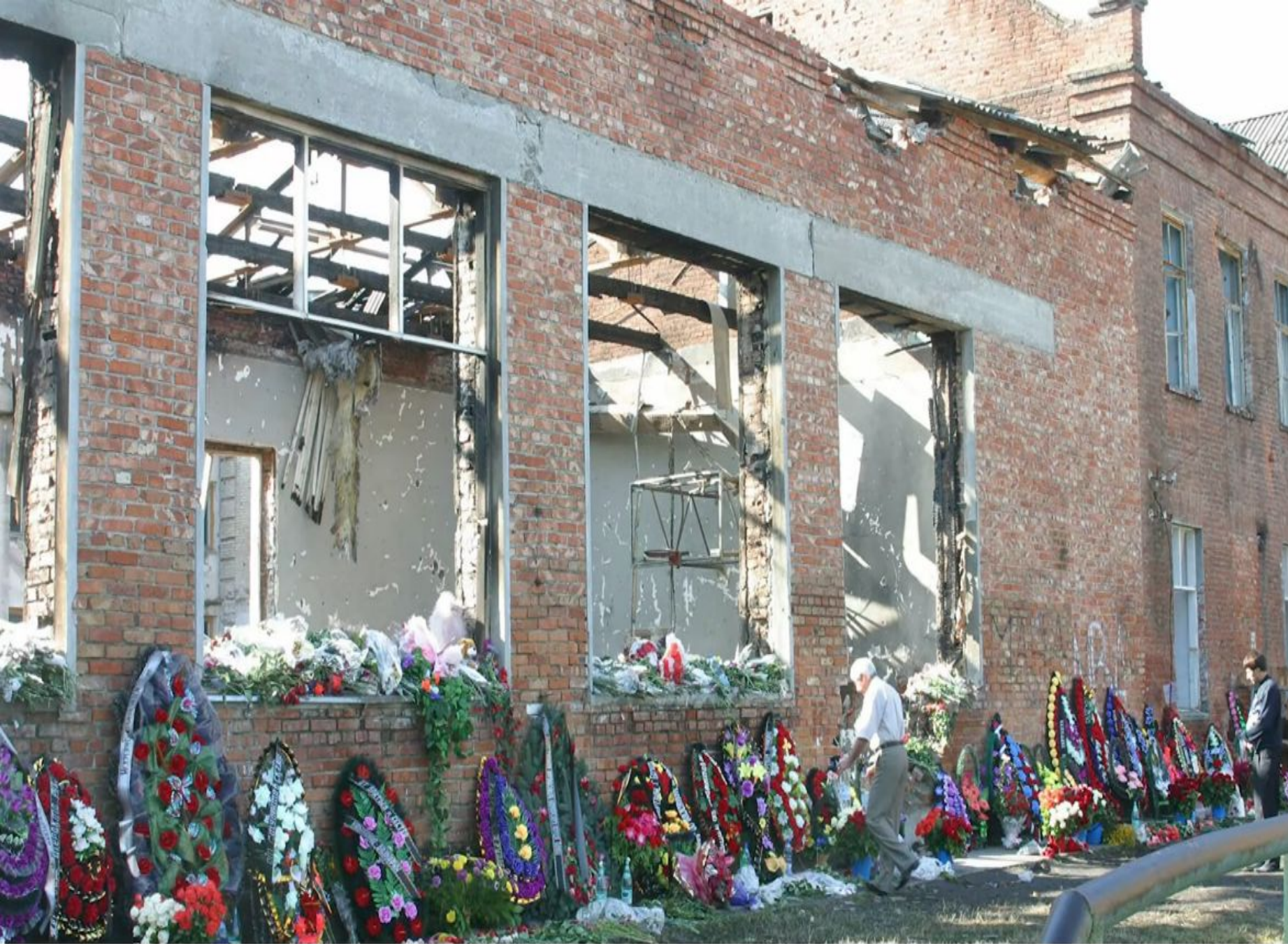
Здание школы № 1 в г.Беслан. Северная Осетия. Фото 2004