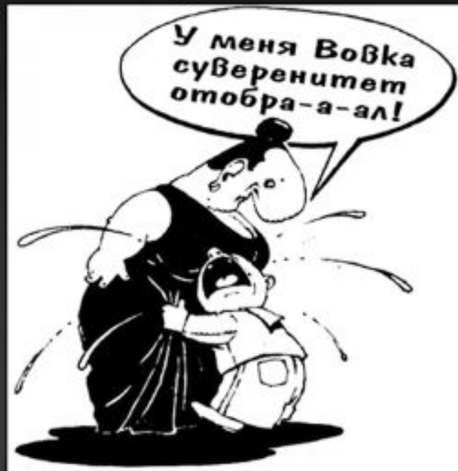
Современная российская карикатура

2000 – 2007 – приведение конституций республик в составе РФ в соответствие с Конституцией РФ