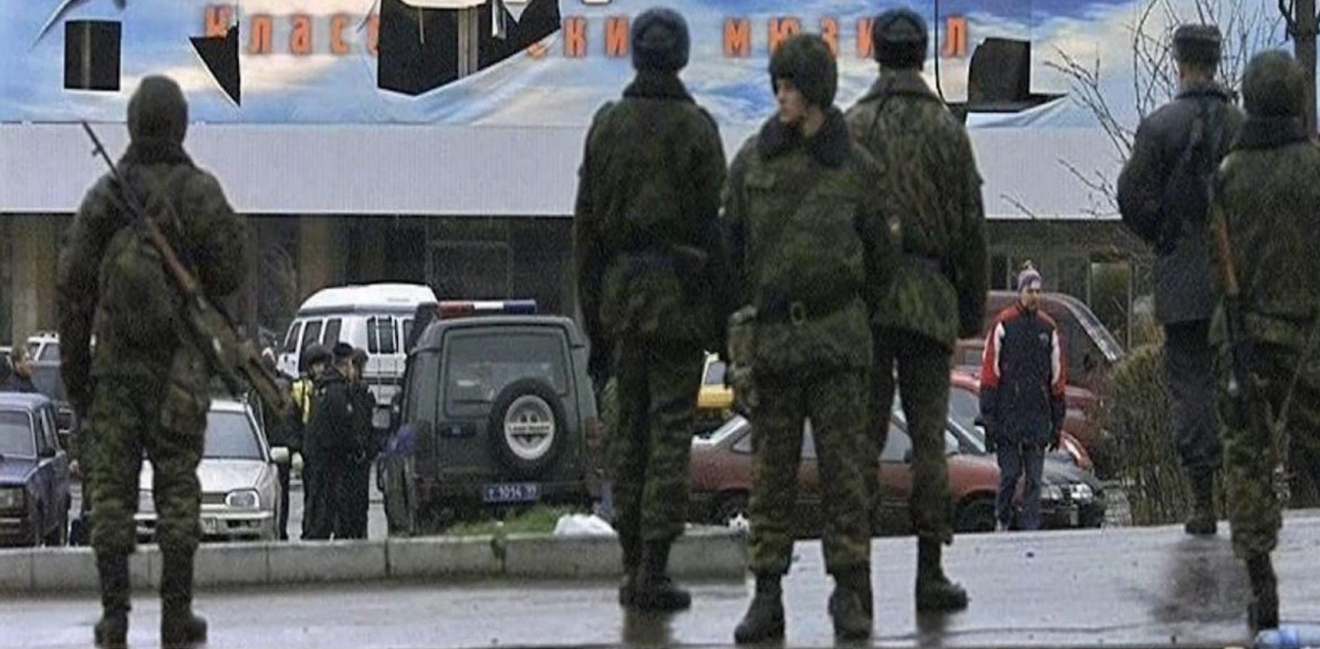
Спецназовцы у захваченного здания театрального центра на Дубровке. Москва. Фото 2002