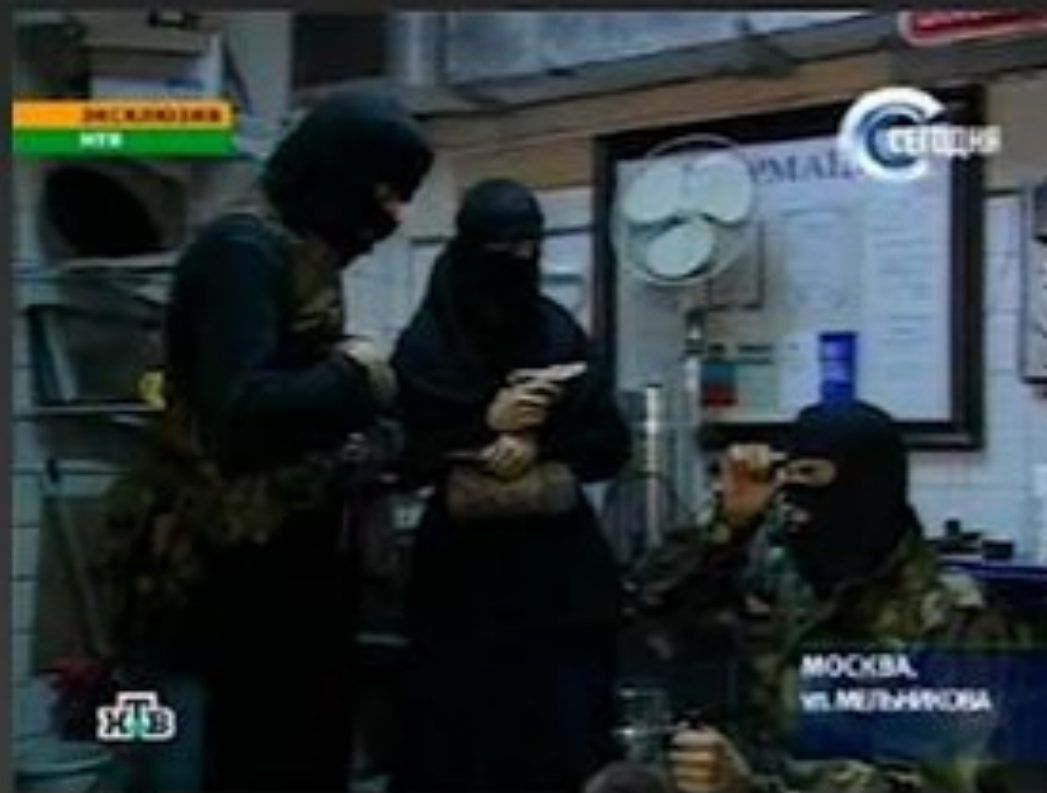
Террористы в театральном центре на Дубровке. 2002

24 января 2011 – взрыв в аэропорту Домодедово