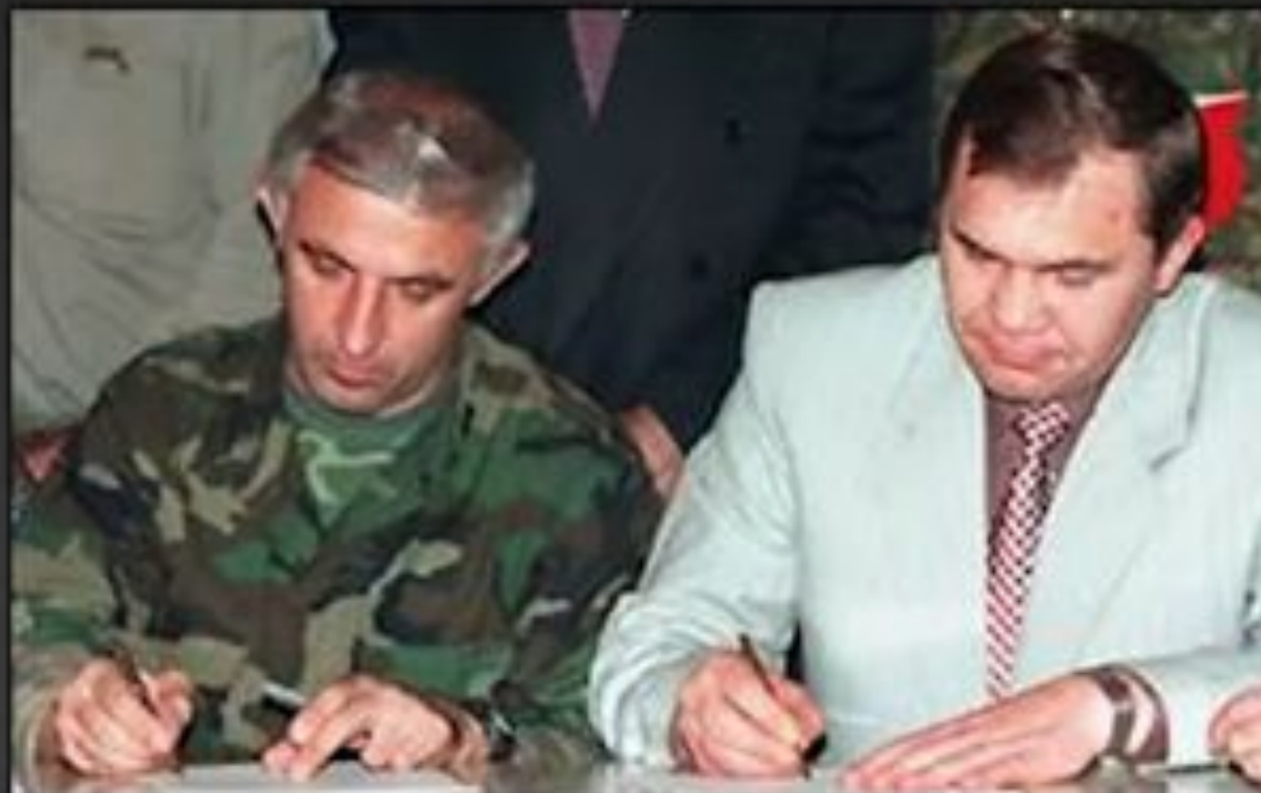
А.Масхадов и А.И.Лебедь подписывают соглашение. 1996

Поражение России в первой Чеченской войне