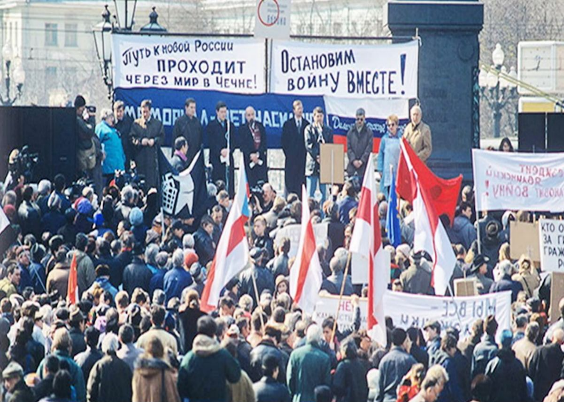
Митинг против войны в Чечне. Москва. Фото 1996