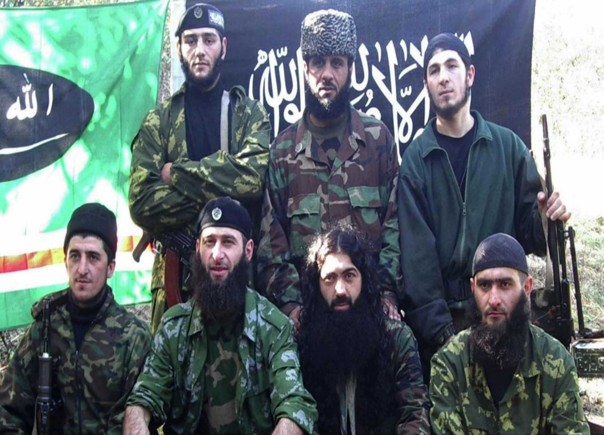
Чеченские боевики-ваххабиты. Фото 1999