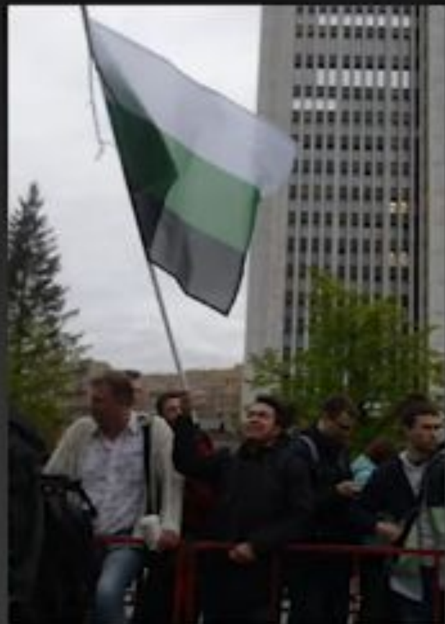
Флаг Уральской республики у протестующих. Екатеринбург. 2019

1993 – провозглашение Уральской республики (Екатеринбург, лидер: Э.Э.Россель ) и Южноуральской республики (Челябинск, лидер: С.В.Костромин )