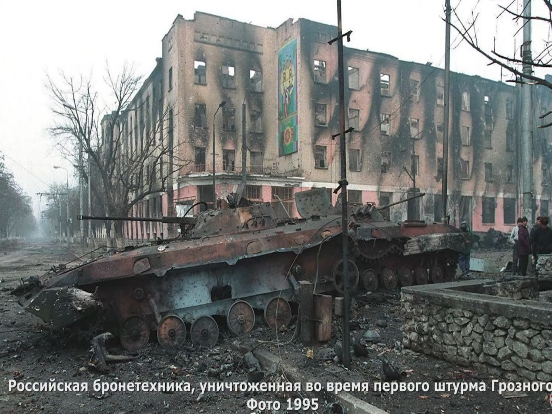
Российская бронетехника, уничтоженная во время первого штурма Грозного Фото 1995