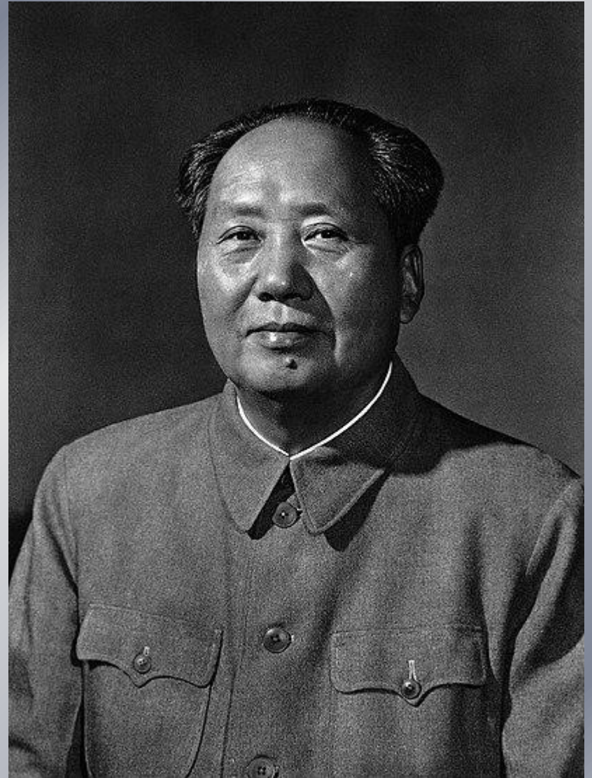
Мао Цзэдун 20 марта 1943 года — 9 сентября 1976 года

Силы китайских коммунистов были не столь многочисленны (ок. 1,2 млн), они использовали советское и трофейное японское вооружение. Однако боееспособность армий Чан Кайши, состоявших из насильно мобилизованных крестьян, оказалась крайне низкой