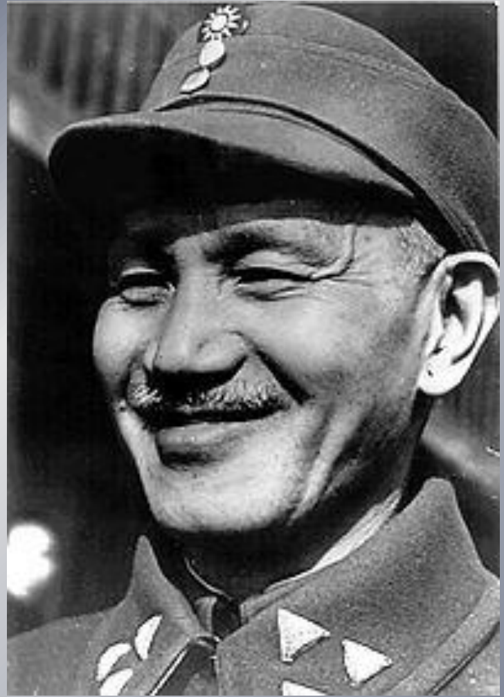
Чан Кайши 31 октября 1887 — 5 апреля 1975

Режим Чан Кайши имел определенные преимущества. Он контролировал большую часть территории страны (76 %), имел многочисленную армию, оснащенную при поддержке США (ок. 4,3 млн человек). Гоминьдан поддерживали провинциальные магнаты, ростовщики и помещики.