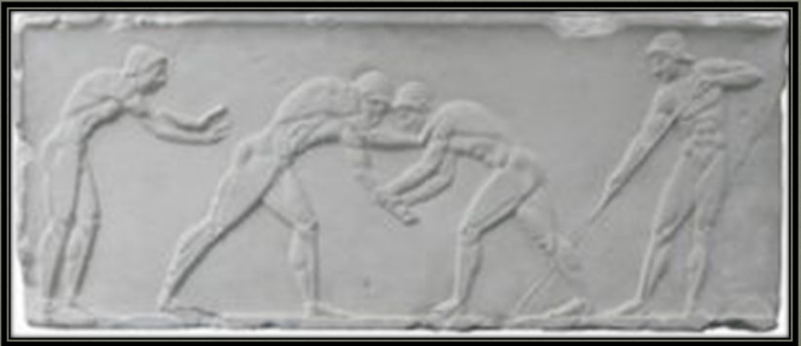
Борьба. Античный барельеф.