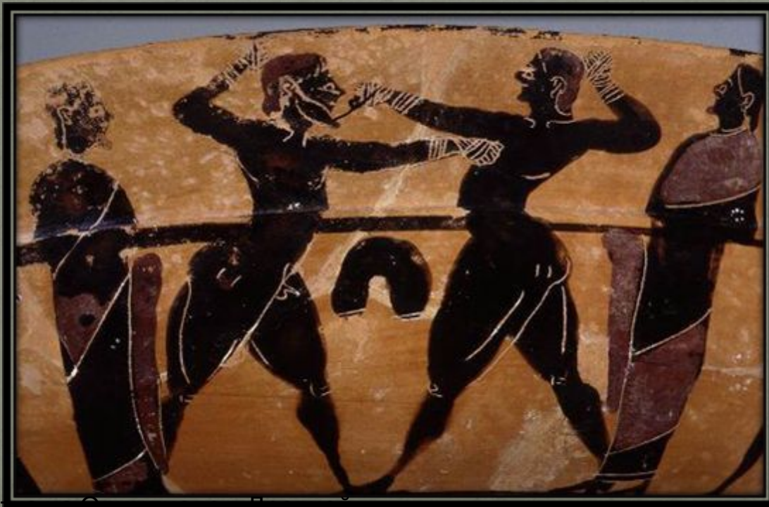
Схватка на Олимпиаде в Древней Греции

В Древней Греции писаных правил кулачного боя не было. Не существовало ринга, зрители становились ограждением площадки для боя. Обычно бой продолжался до тех пор, пока один из противников не подавал сигнал о сдаче – поднимал вверх руку.