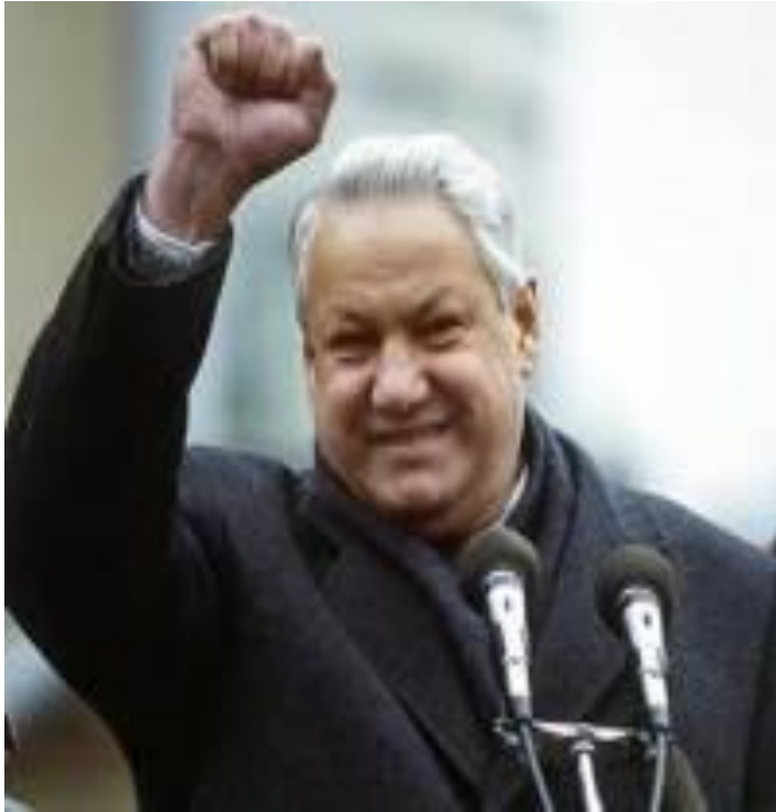
Первый президент России Борис Ельцин

От этой даты можно вести отсчет начала становления новой российской государственности, основанной на принципах конституционного федерализма, равноправия и партнерства. Россия строит демократическое, гражданское общество, в котором каждый народ, каждый гражданин видит себя неотъемлемой его