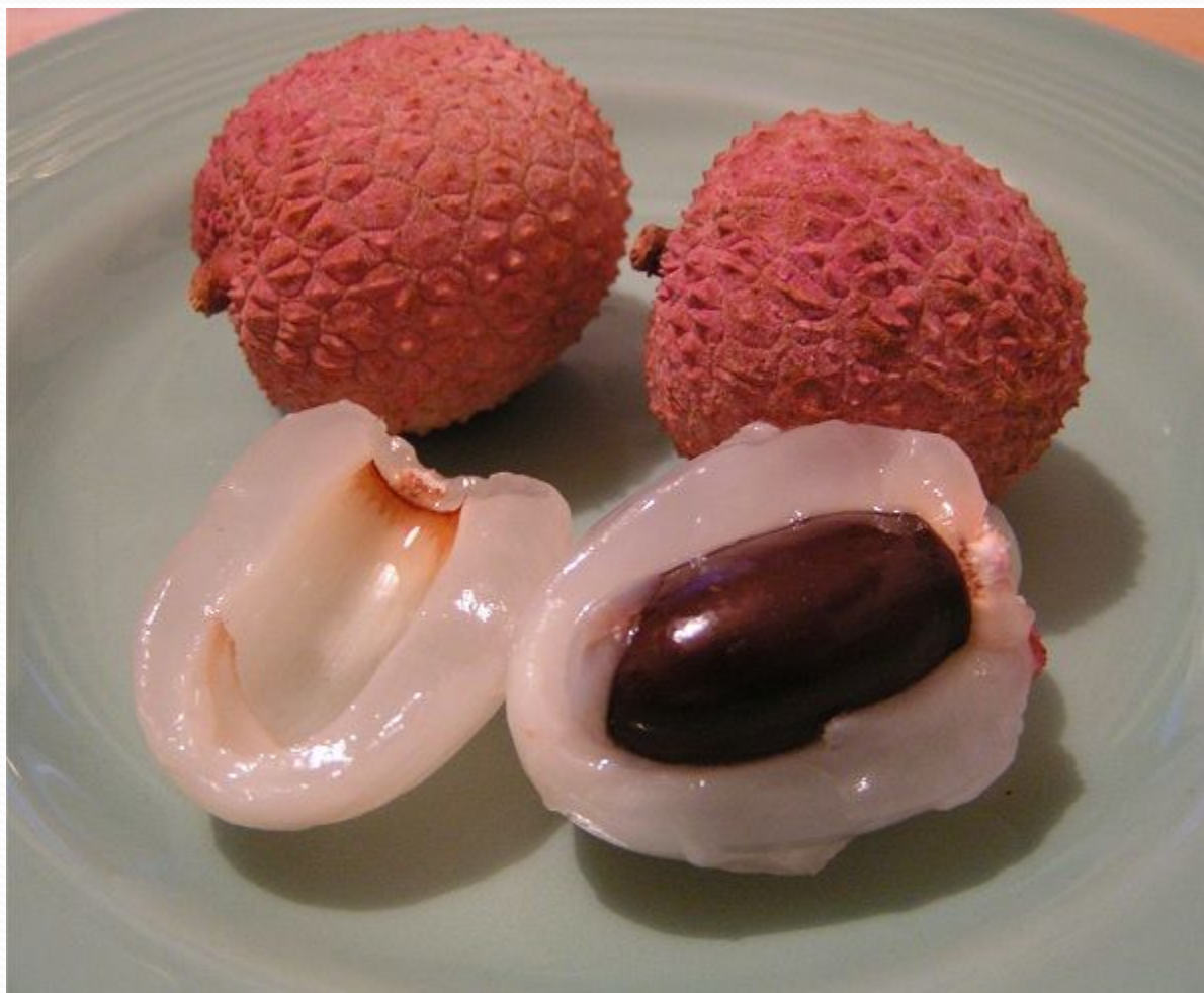
Личи (китайская слива)

Сантиметра 3-4 в диаметре, с плотной и жесткой шкурой. Кисленький, в меру приятный, но не впечатлил. Самое интересное в нем оказалась консистенция. Больше всего на ощупь напоминает что-то желеподобное или мясо