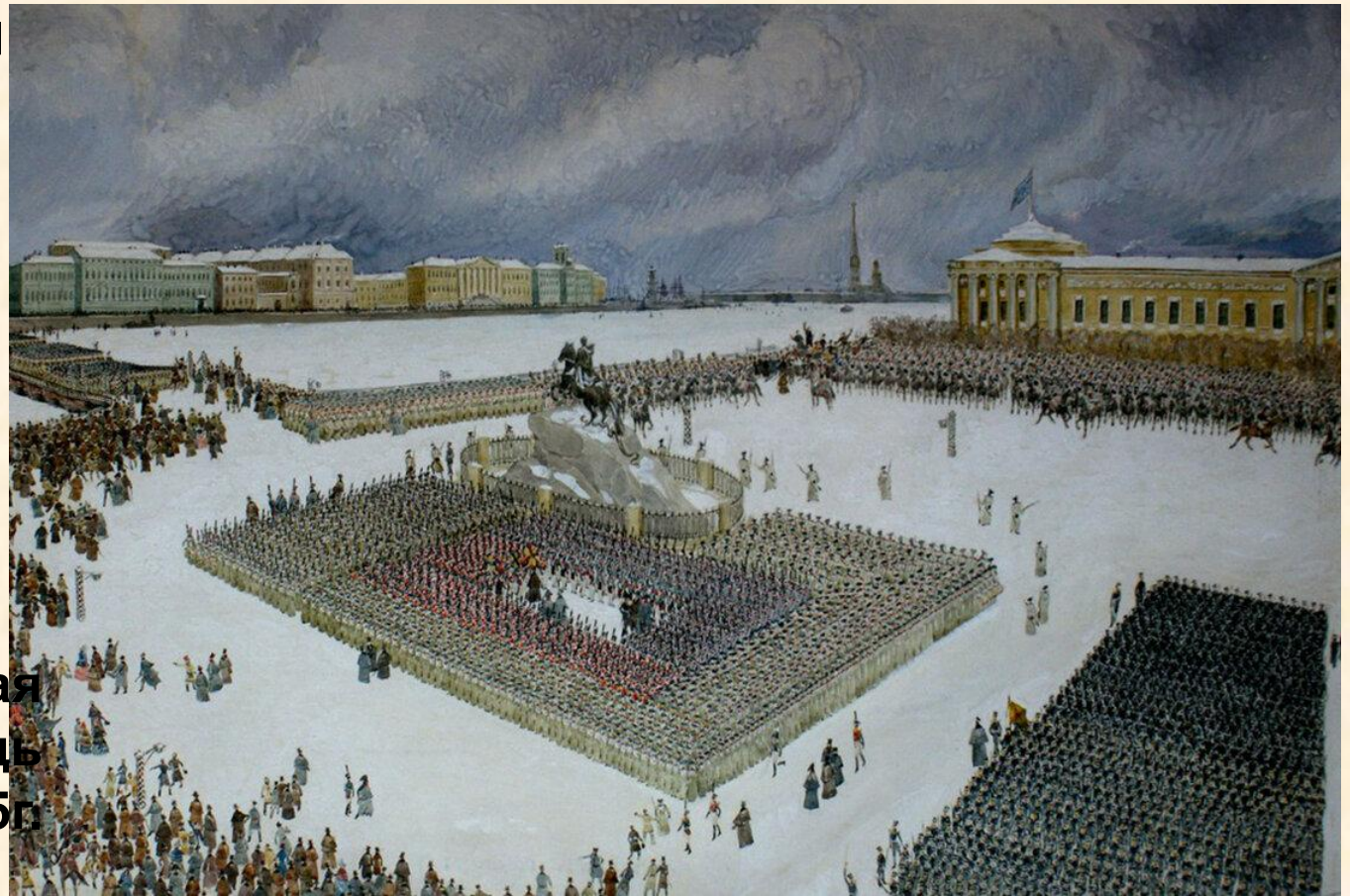
Сенатская площадь 14 декабря 1825г