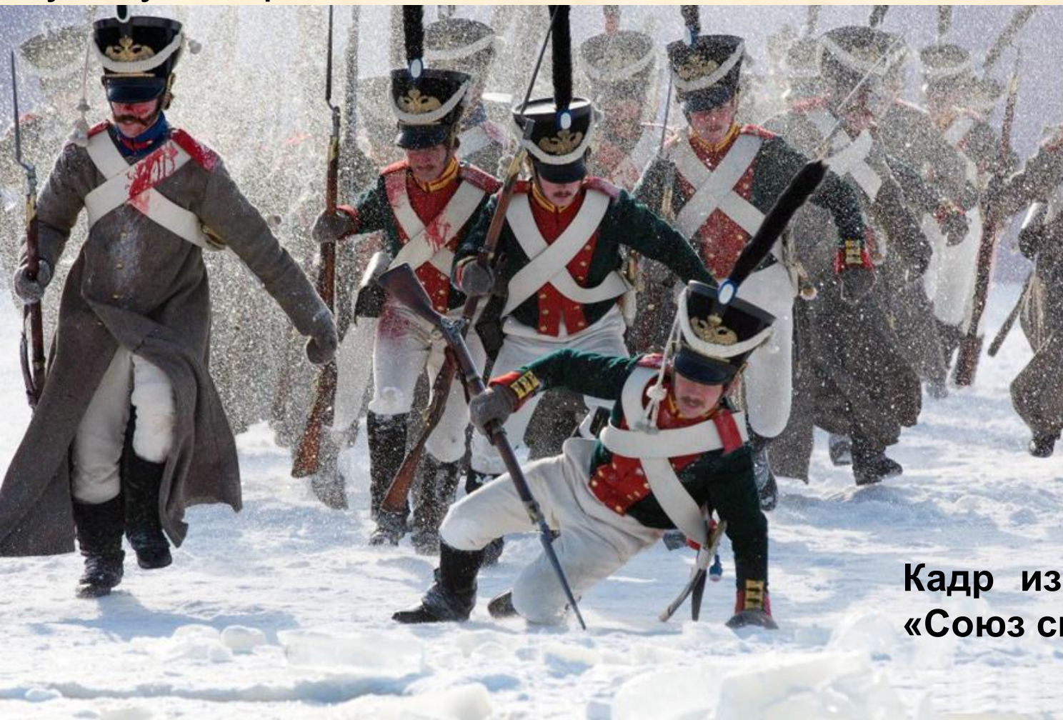
Кадр из фильма «Союз спасения»