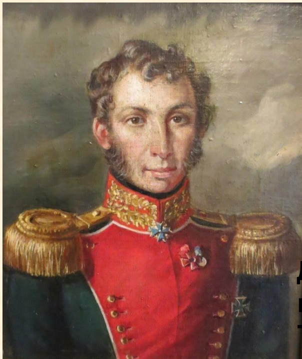
Диктатор восстания Трубецкой