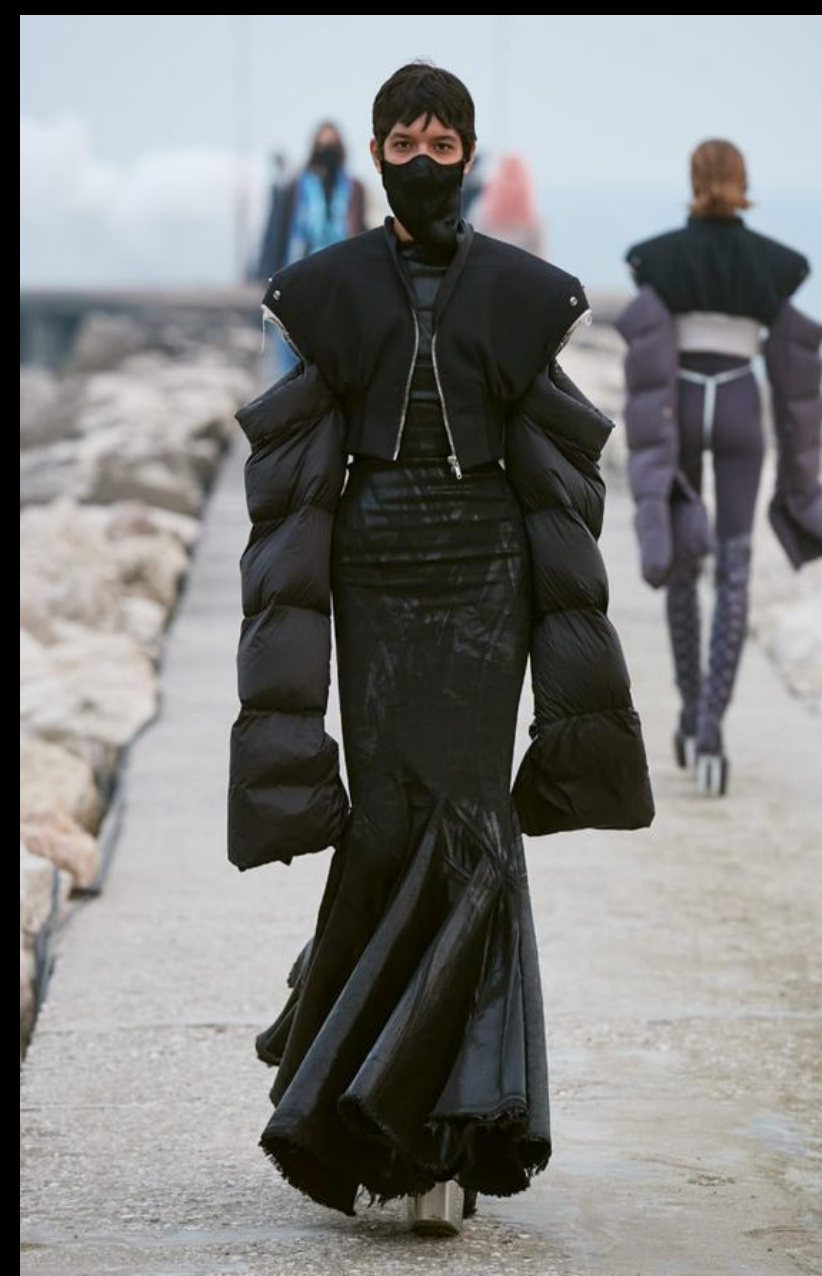
Rick Owens 021/2022/ Ready-To-Wear