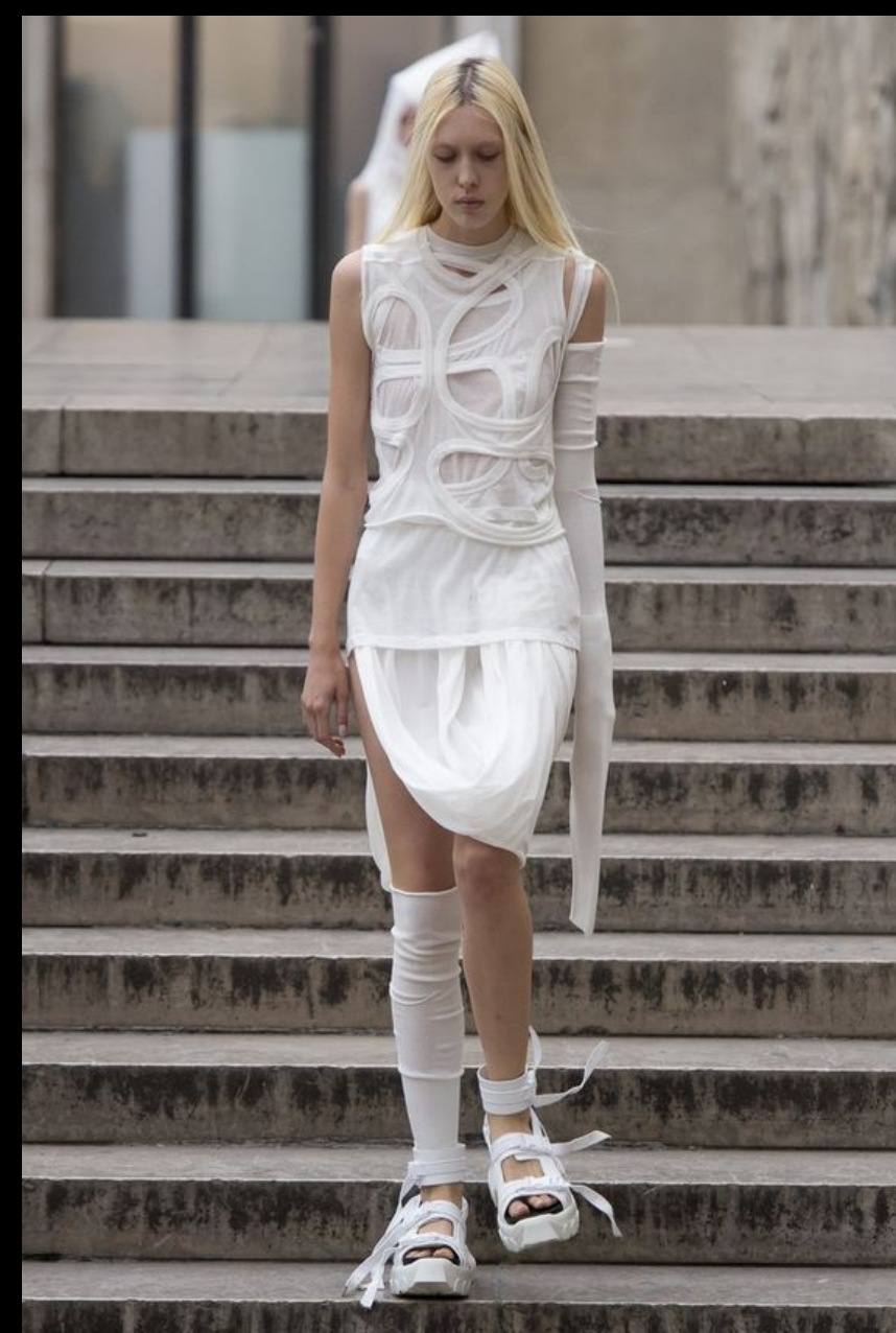
Rick Owens / Ready-To-Wear Spring 2018