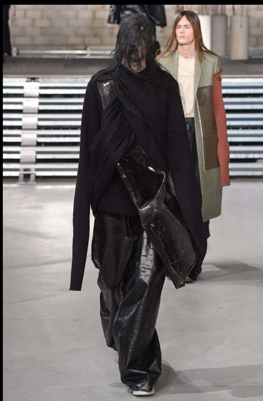
Rick Owens Fall 2017 Menswear Fashion Show