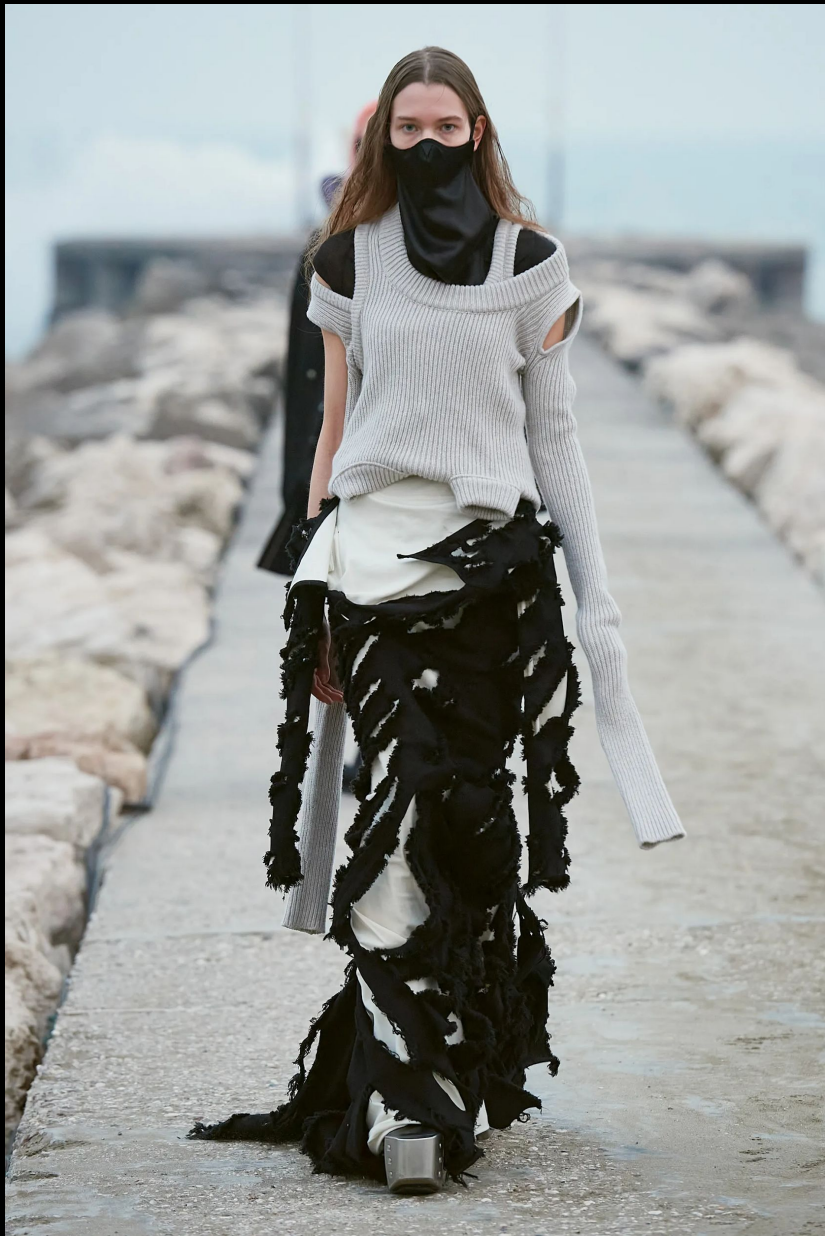
Rick Owens 2021/2022 / Ready-To-Wear