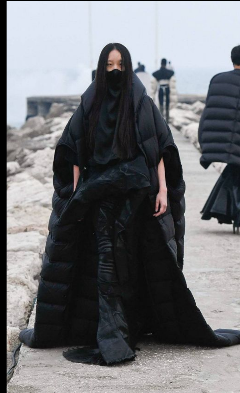
Rick Owens 2021/2022 / Ready-To-Wear