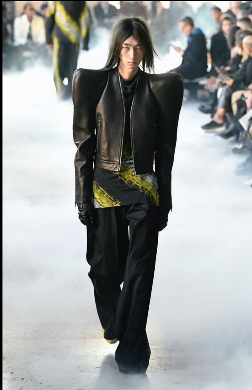
Rick Owens | Menswear - Autumn 2020