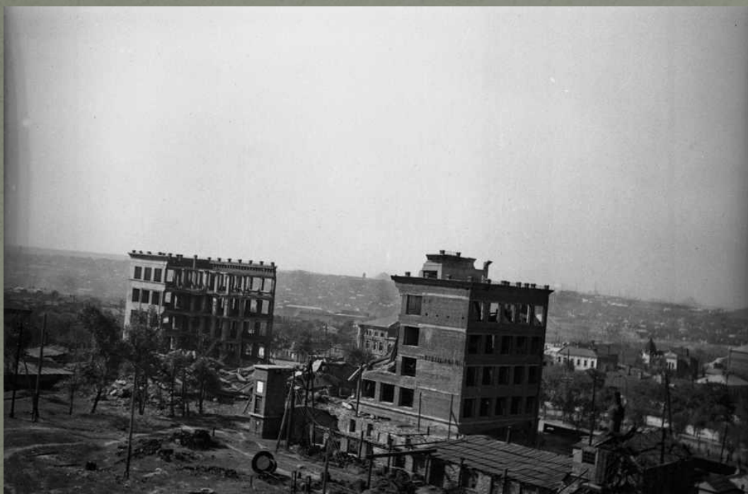
5й корпус ДПИ. 1945 г.