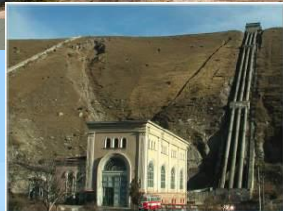
Фото 1. Эзминская ГЭС Photo 1. Ezminskaya HEPs