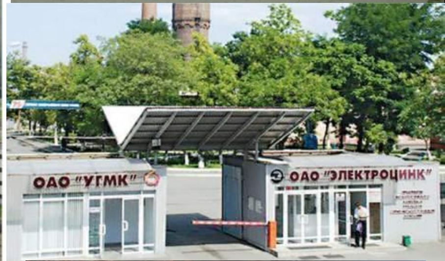
Тырнаузский горно-обогатительный комбинат