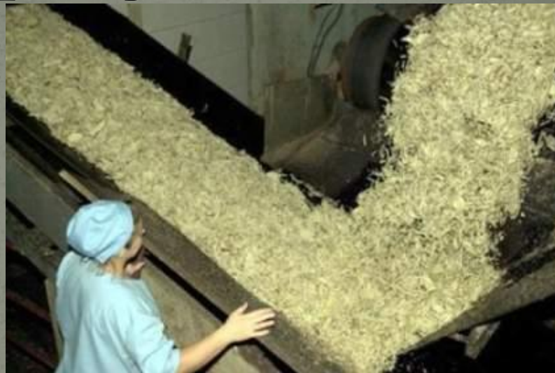
Переработка сах. свеклы

● Почти вся продукция сельского хозяйства перерабатывается на месте. В ряде случаев мощности предприятий пищевой промышленности так велики, что позволяют использовать не только местное сырье (например, сахарная промышленность перерабатывает импортный сахар-сырец).