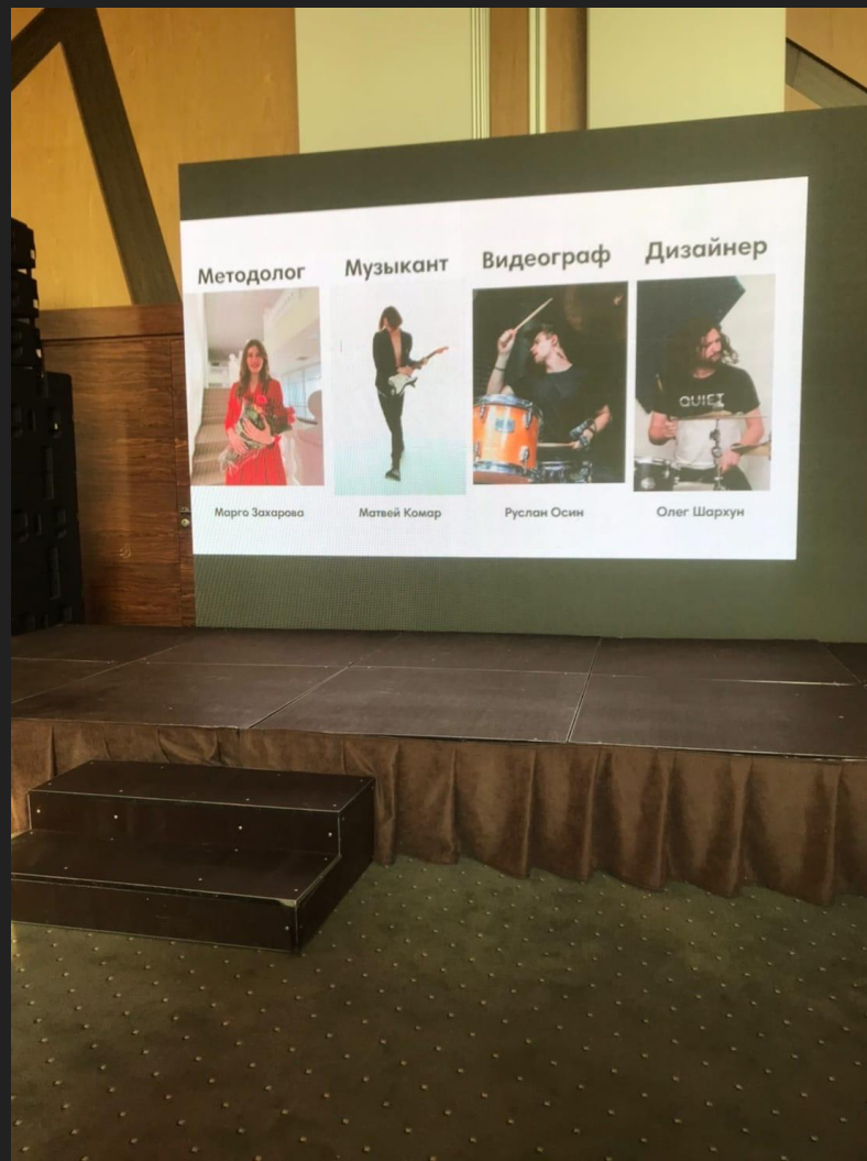
Фото со слета