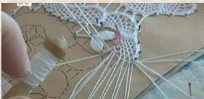
намотка ниток на коклюшки

Одна кружевница разрабатывает дизайн, а вторая — плетет. Одним кружевницам лучше удастся первое, другим — второе. Макет рисунка называется сколком — он кладется на специальную подушку и поверх него накалываются булавки. На них крепятся нитки в процессе плетения. Сколки кружевницы рисуют сами или заимствуют друг у друга.