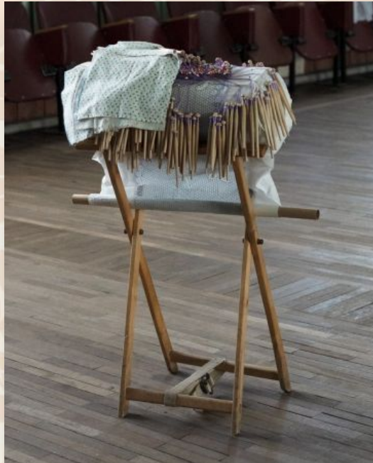
подушка для плетения кружева

На страницах книги «Балахнинский кружевной промысел» - ажурные косынки, шали, болеро, подзоры и накидки на подушки. Здесь и музейные экспонаты родом из позапрошлого и начала прошлого века, и изделия современных мастериц.