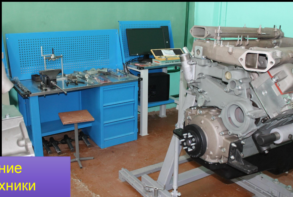
Обслуживание грузовой техники