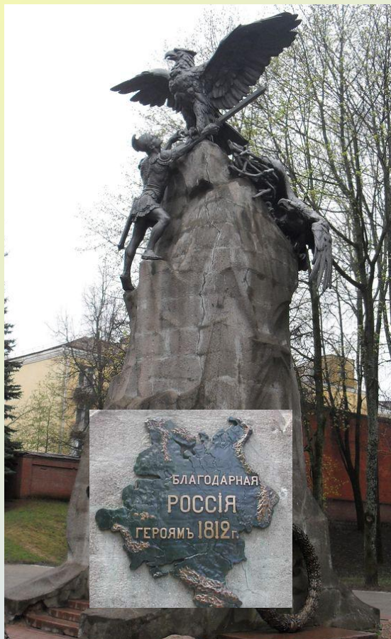
Памятник героям Отечественной войны 1812 года в Смоленске