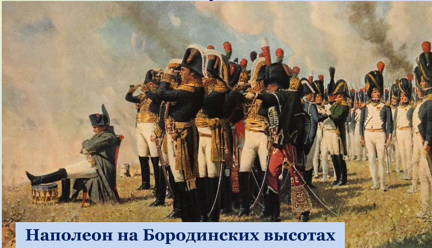
Наполеон на Бородинских высотах

2 сентября жители спешно покинули Москву. Французские войска входили в пустой город. Во всех покорённых Наполеоном городах жители, признавая поражение, подносили Наполеону ключи от города. Долго ждал Наполеон на Поклонной горе, но никто ему ключи от Москвы не принёс.