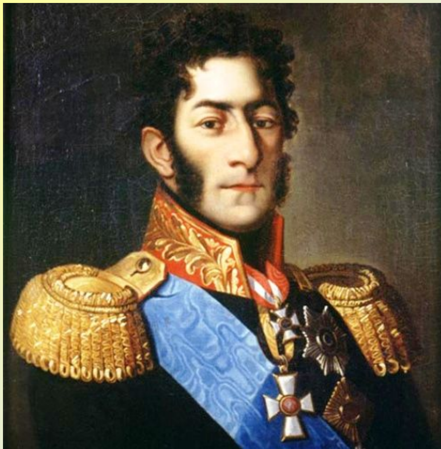
Багратион Петр Иванович