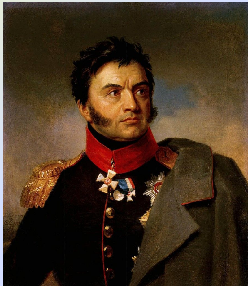
Раевский Николай Николаевич