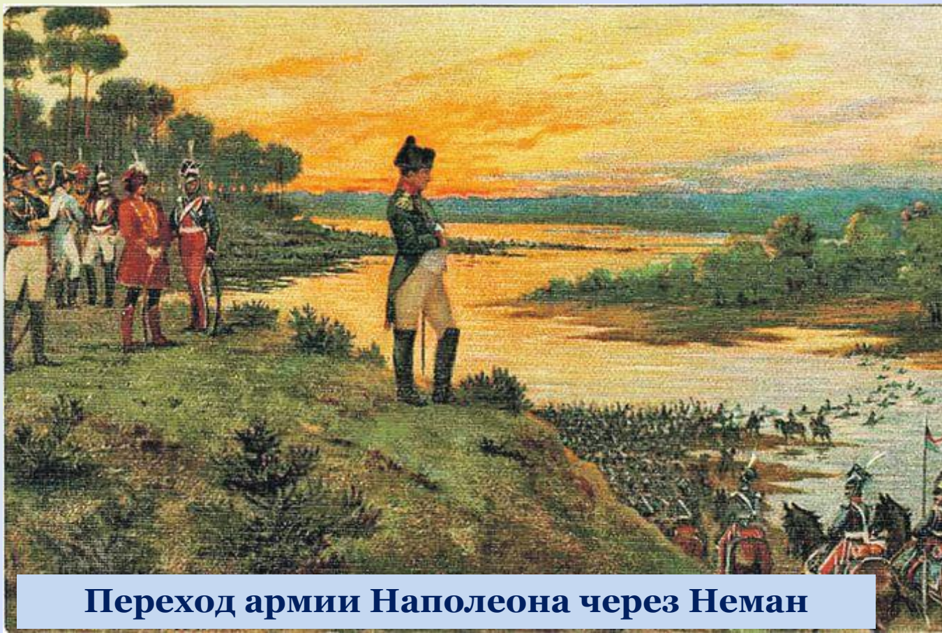
Переход армии Наполеона через Неман