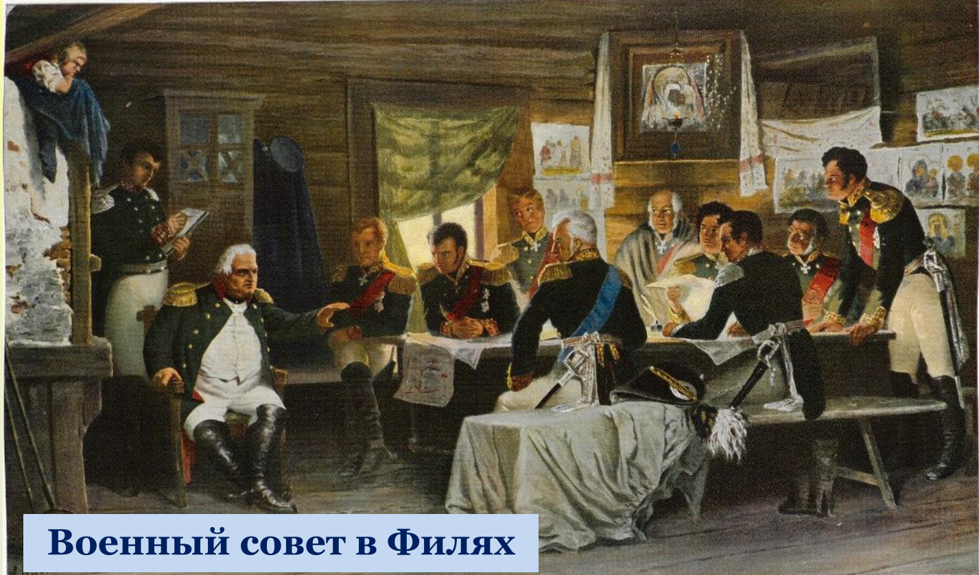
Военный совет в Филях

Кутузов собрал всех генералов в деревне Филя на военный совет. Нелёгкий выбор встал перед русским командованием: давать ли под Москвой ещё одно сражение или оставить Москву неприятелю, но сберечь войско? Решающими стали слова Кутузова «Пока цела армия, цела и Россия». Было решено оставить Москву.