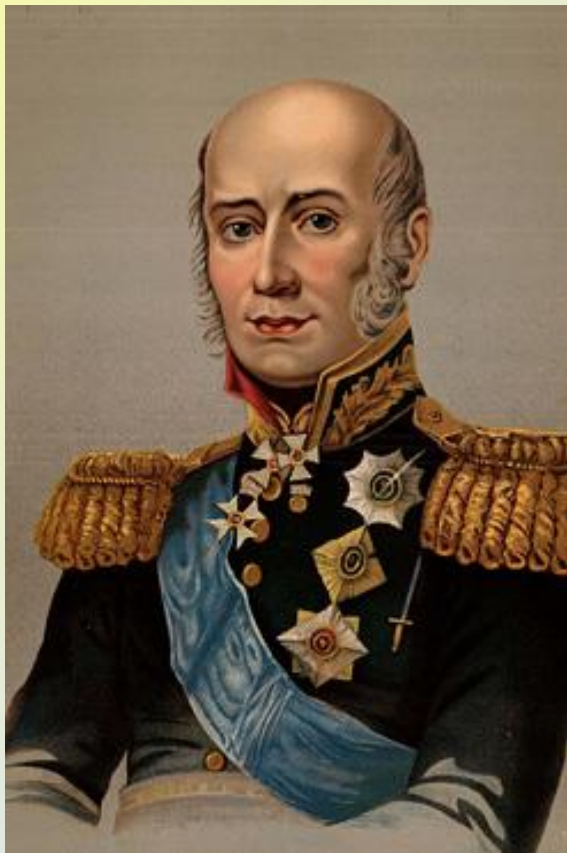
Барклай-де-Толли Михаил Богданович