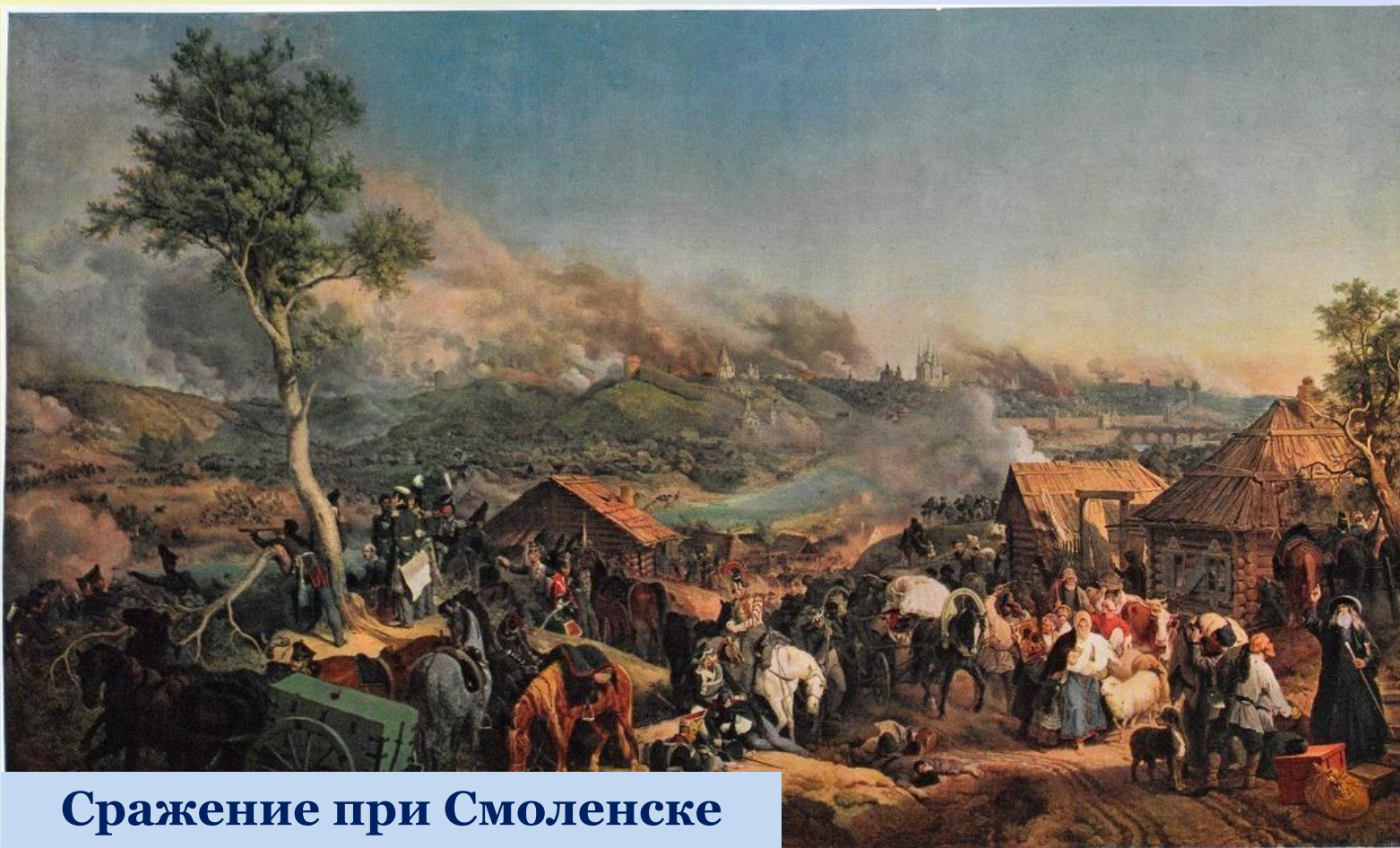
Сражение при Смоленске

22 июля у Смоленска произошло первое грандиозное сражение. Но русским войскам пришлось отступить и сдать город.