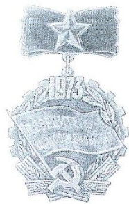
Этаж учрежден ЦЕ ВНОС, Советом Министров СССР, ВНОС и ЦЕ ВНОС