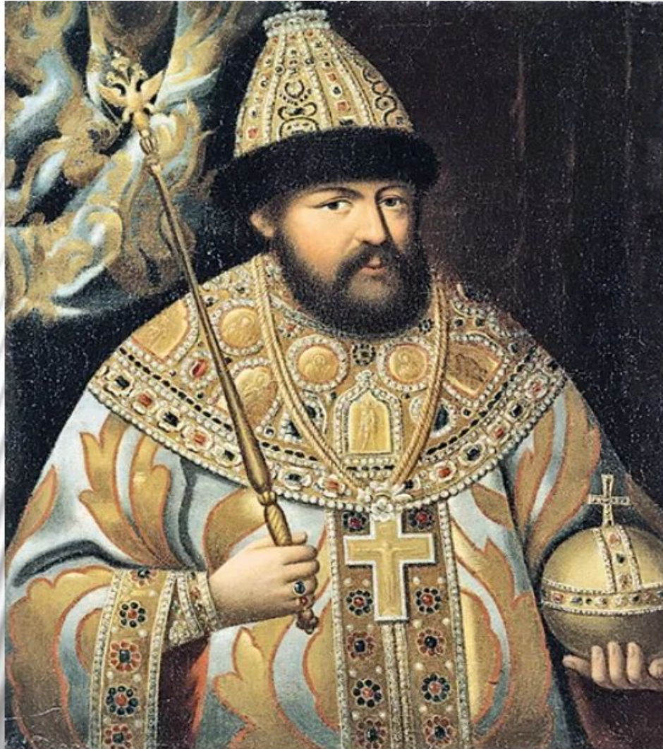
Алексей Михайлович Романов