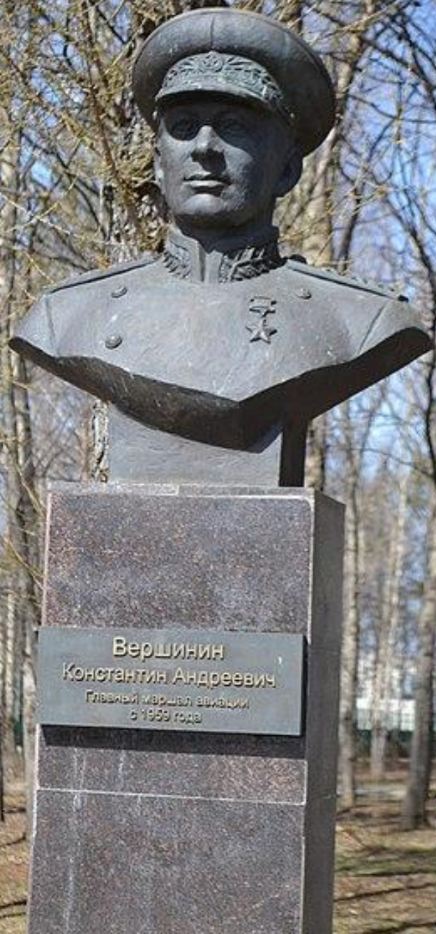
Вершинин Константин Андреевич Главный маршал авиации с 1959 года

Затем 4-я воздушная армия успешно действовала в Новороссийско-Таманской (сентябрь-октябрь 1943), Керченско-Эльтигенской десантной ноябрь—декабрь 1943), Крымской стратегической (апрель—май 1944) наступательных операциях. В мае-июне 1944 года армия была переброшена на центральный участок советско-германского фронта, где сражалась в Белорусской, Восточно-Прусской, Восточно-Померанской, Берлинской стратегических наступательных операциях. Генерал-лейтенант авиации (17.03.1943). Генерал-полковник авиации (23.10.1943), первый из числа командующих воздушными армиями в годы Великой Отечественной войны, которому было присвоено это воинское звание. Звание Героя Советского Союза присвоено за воинское мастерство и умелое командование войсками в Белорусской наступательной операции 1944 года.