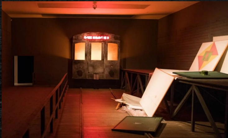
Илья и Эмилия Кабаковы. «В будущее возьмут не всех», 2001.