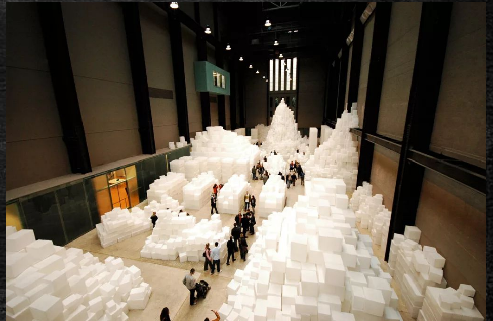
Рэйчел Уайтрид «Насыпь» (2005)