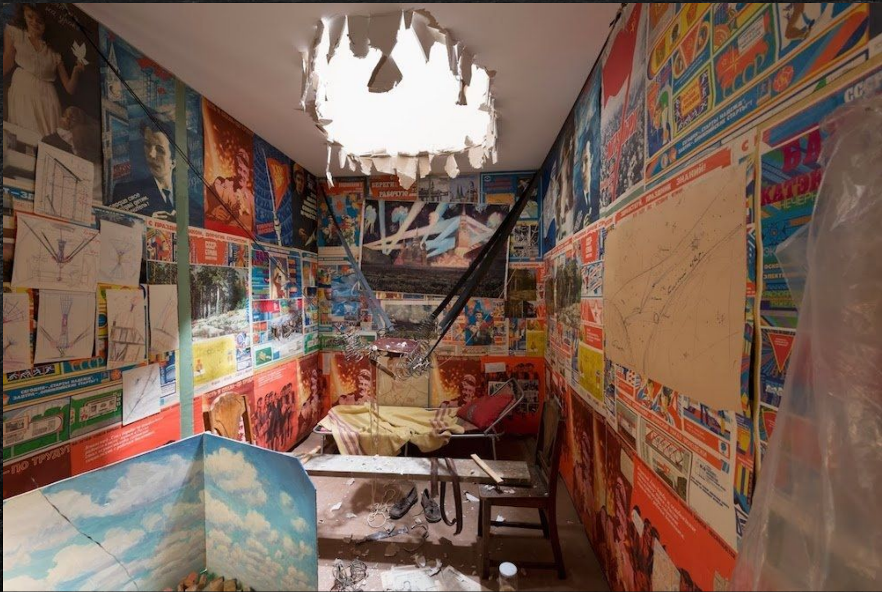
Илья Кабаков «Человек, который улетел в космос из своей комнаты», 1986