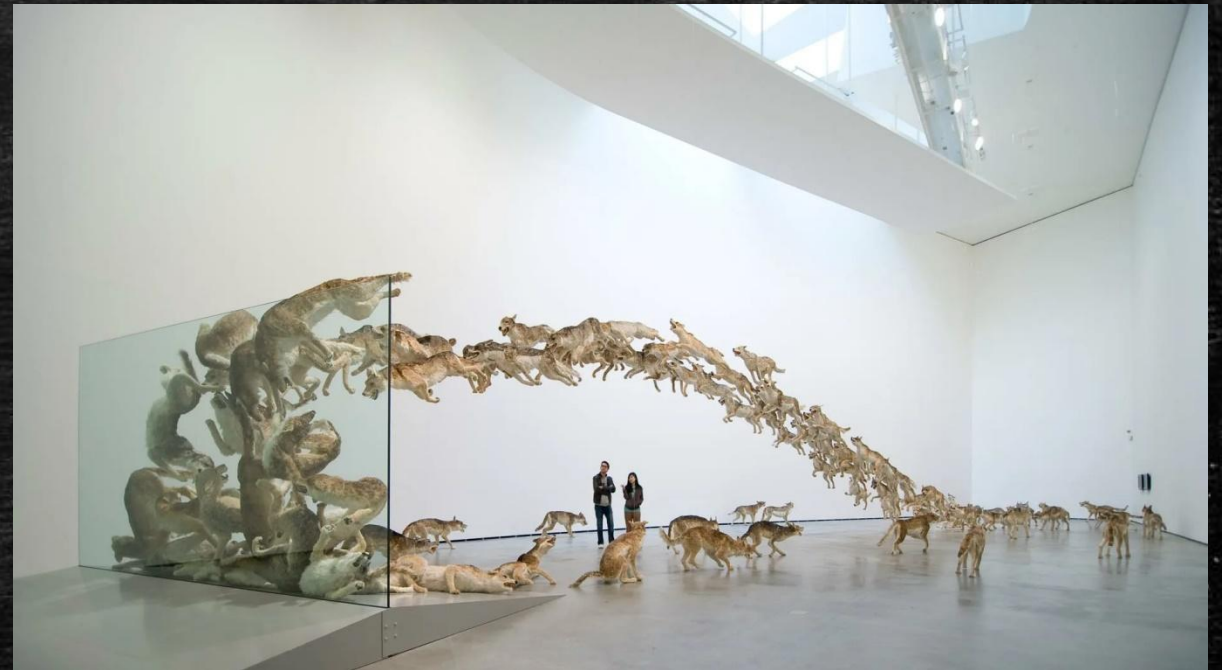
Инсталляция "Head On", состоящая из 99 волков и одной стеклянной стены, автор Цай Гуо-Квианг

Инсталляция (англ. installation – установка, размещение, монтаж) – форма современного искусства, представляющая собой пространственную композицию, созданную из различных элементов и являющую собой художественное целое.