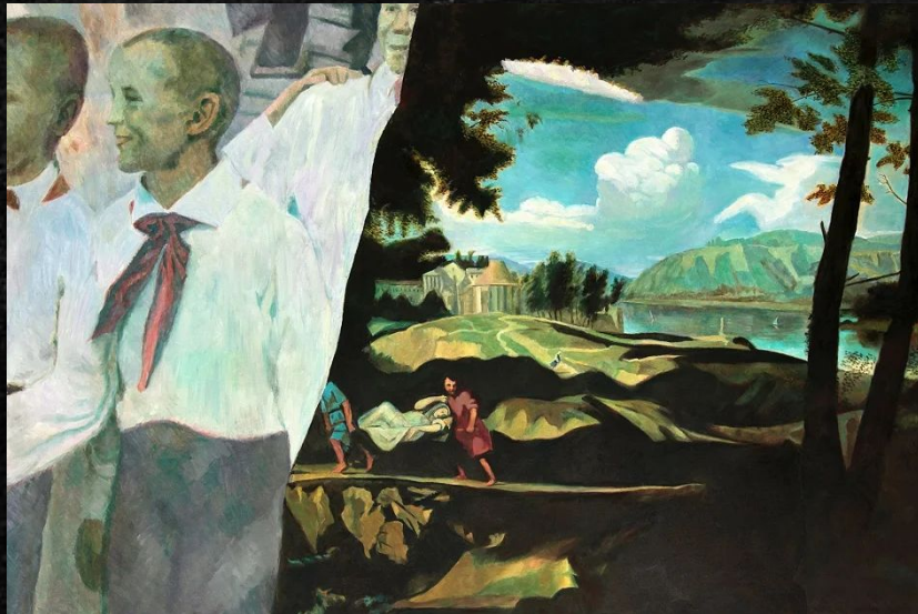
Илья Кабаков. Два