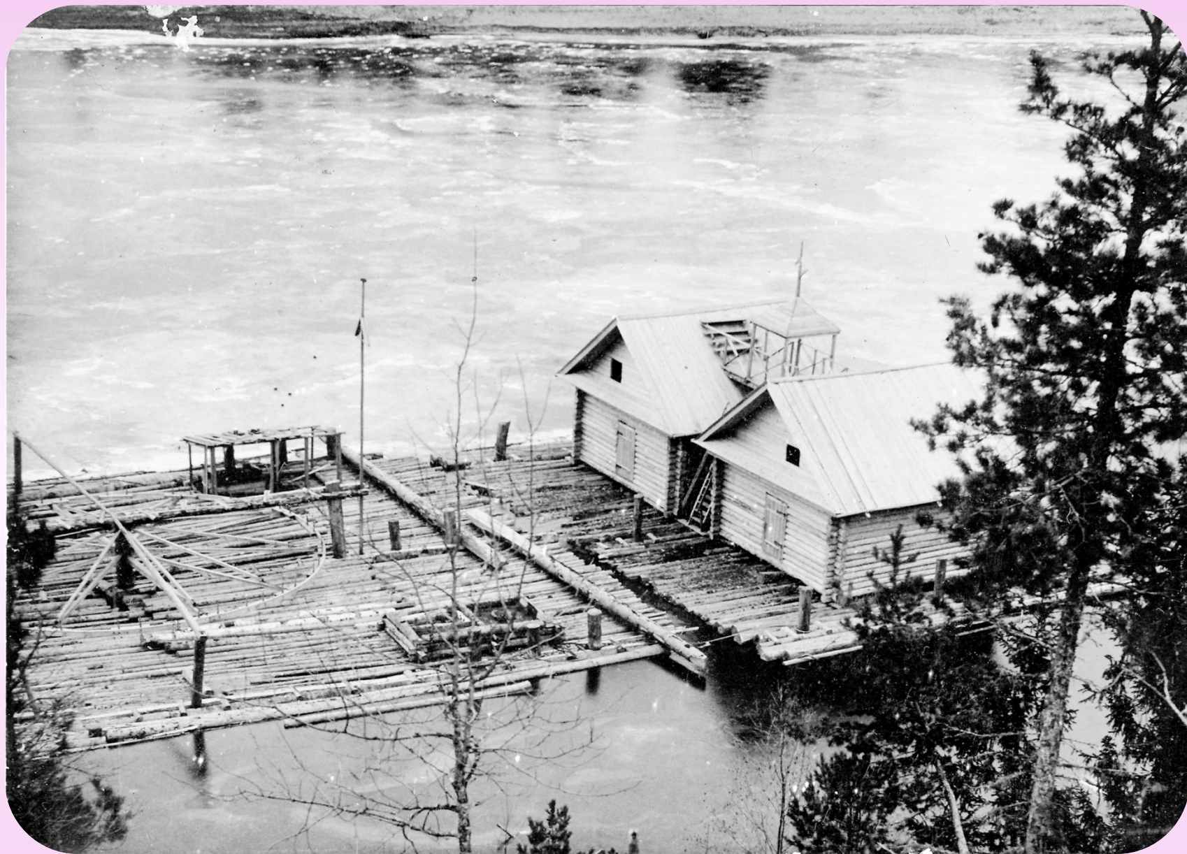
Сплав леса по реке Ветлуге