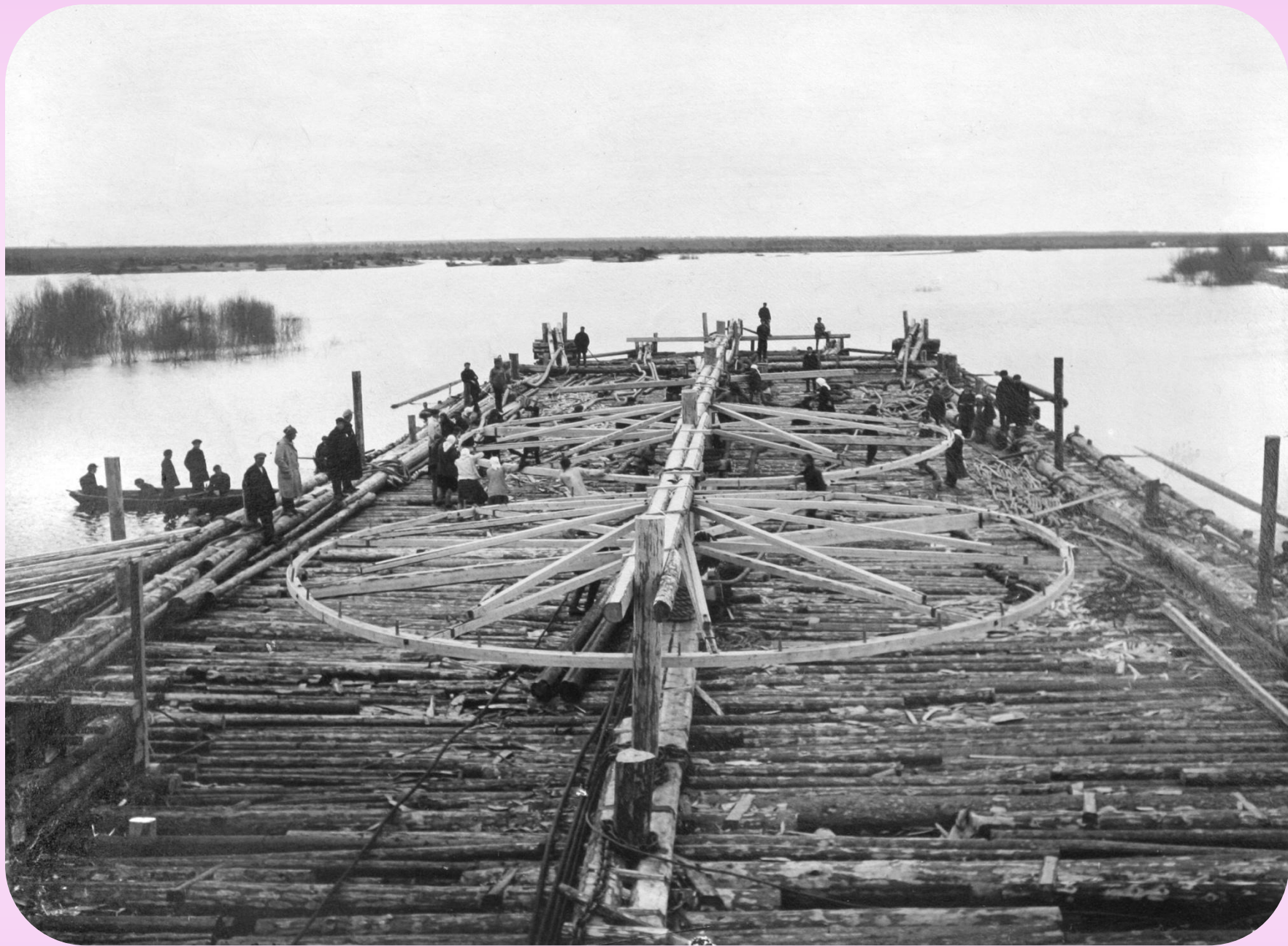
Сплав леса по реке Ветлуге