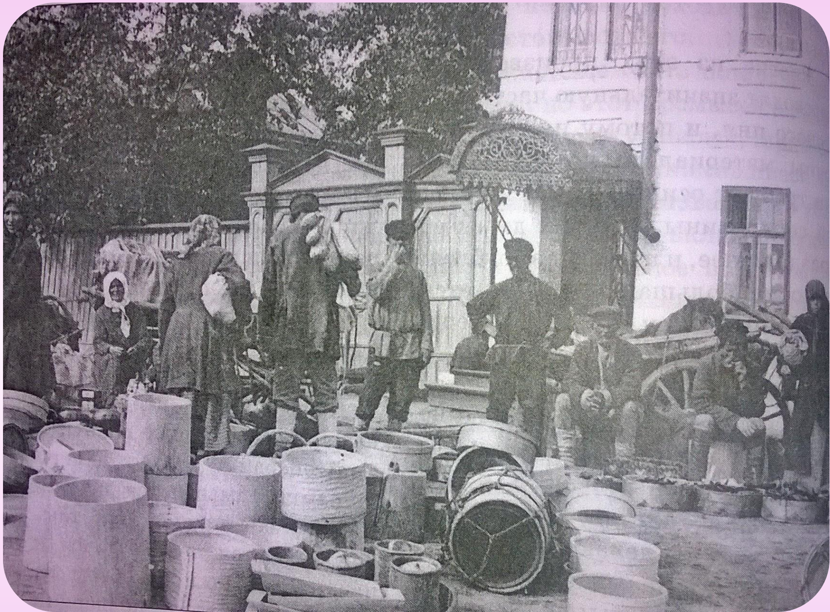
Продукция лесной промышленности на базаре в городе Ветлуге