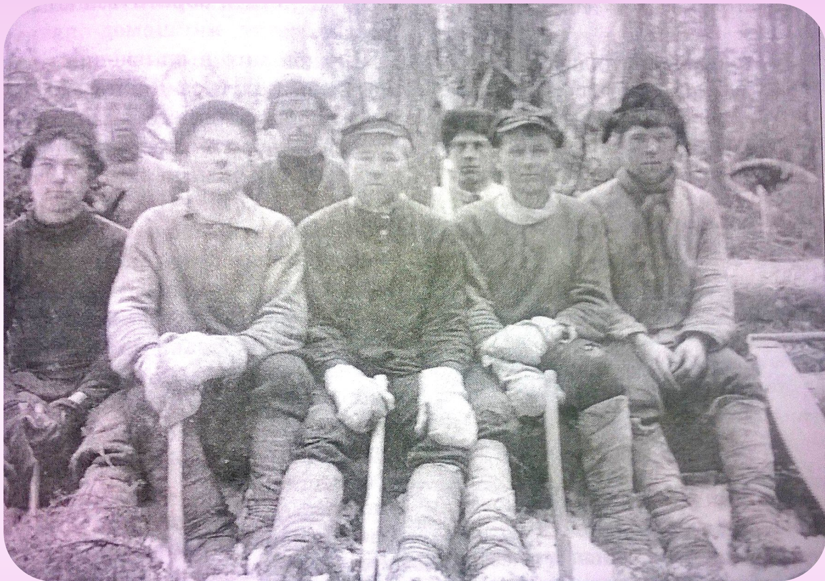
Ветлужские крестьяне на лесозаготовках