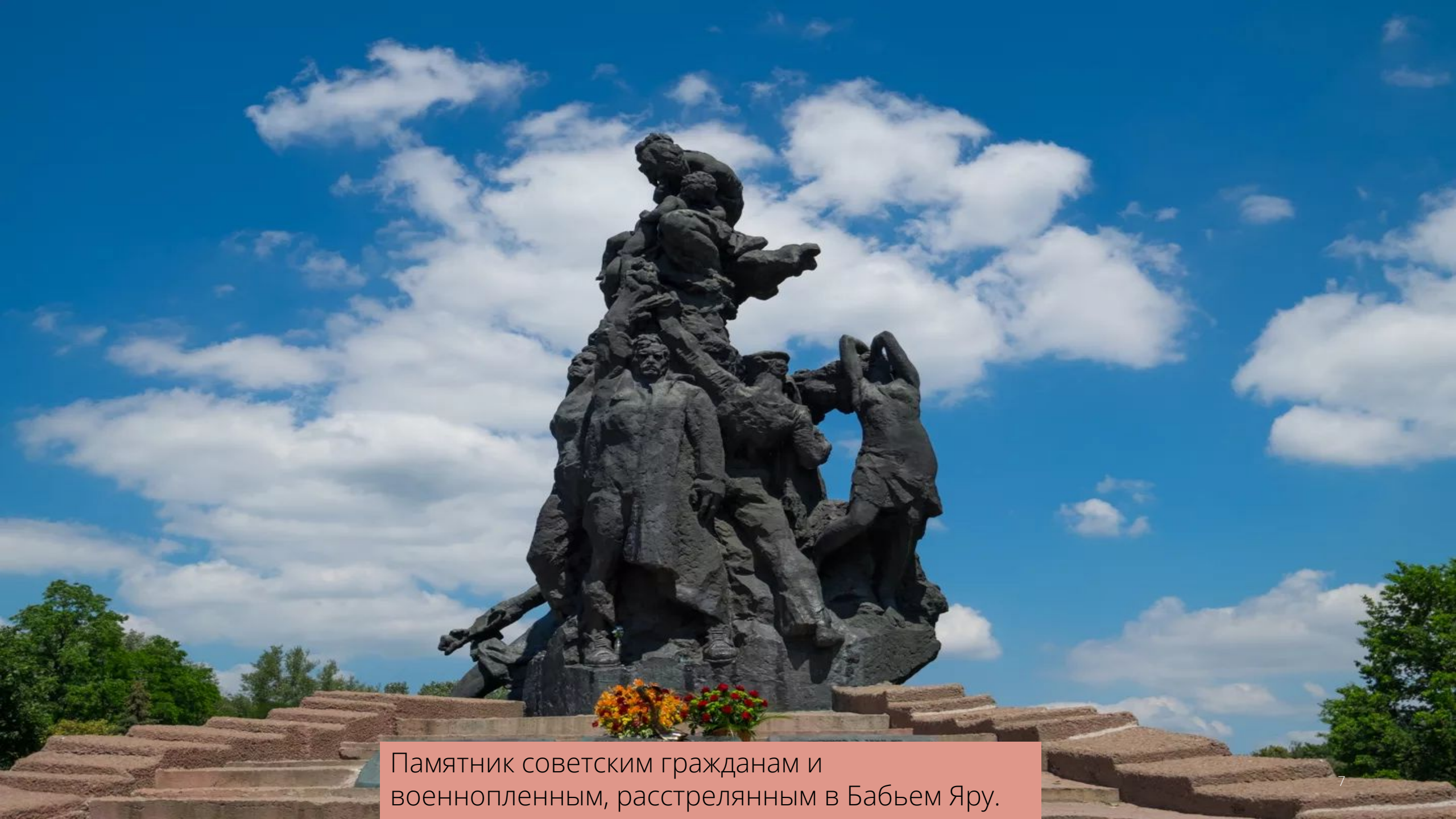
Памятник советским гражданам и военнопленным, расстрелянным в Бабьем Яру.