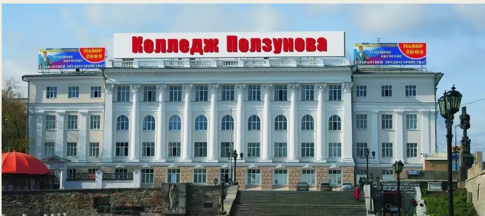
Уральский государственный колледж имени И. И. Ползунова