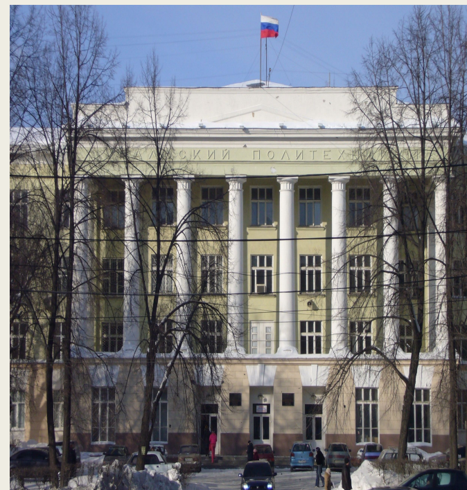
Межрегиональный центр компетенций Уральский политехнический колледж