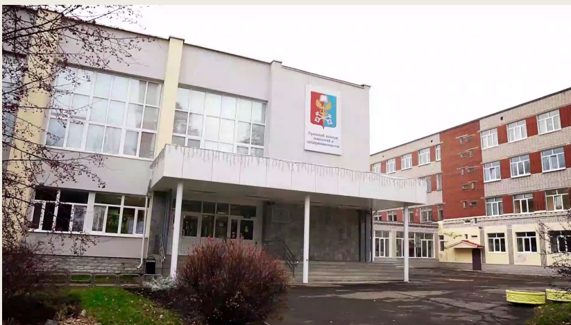
Уральский колледж технологий и предпринимательства