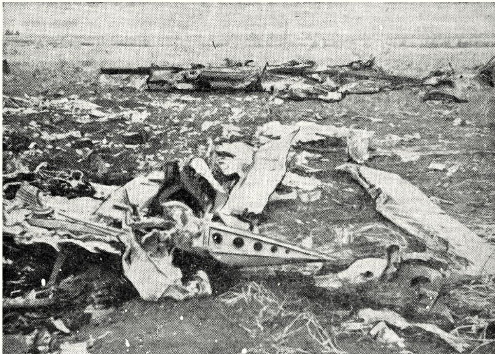
Все что осталось от фашистского бомбардировщика, обитого 21 августа Героем Советского Союза лейтенантом тов. Бринько над Таллином.