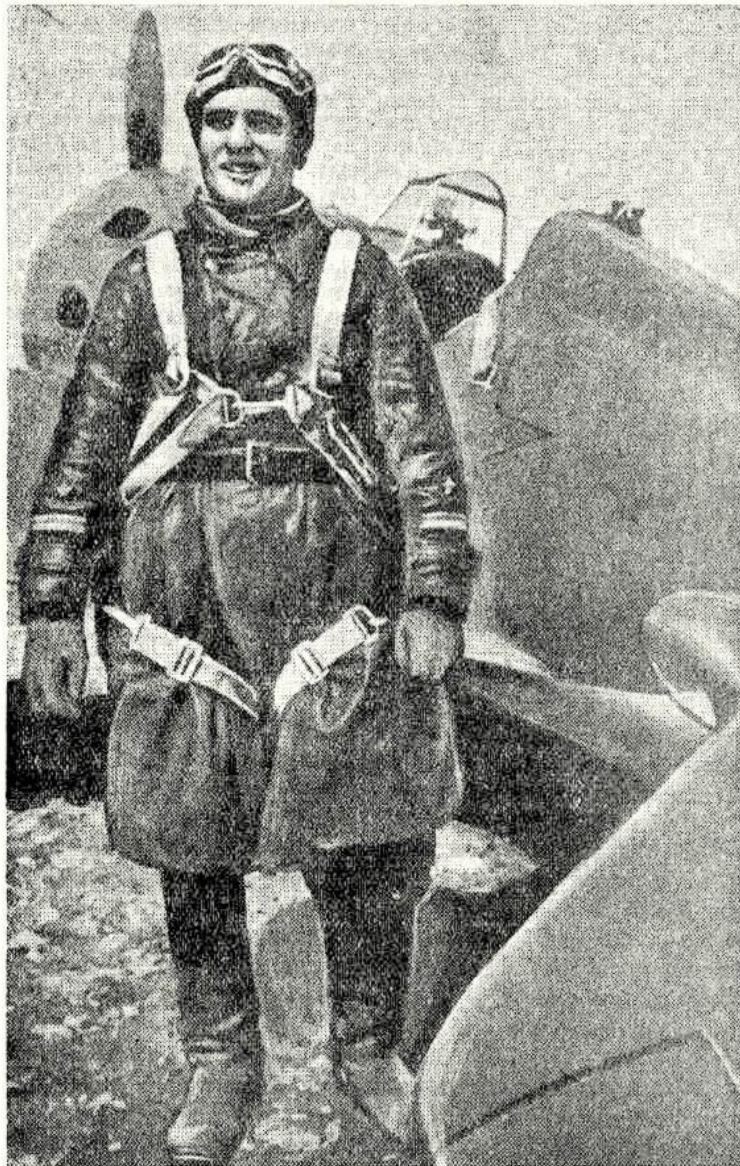
Лейтенант Бринько Петр Антонович (летчик морской авиации Краснознаменного Балтийского флота). Указом Президиума Верховного Совета СССР от 14 июля тов. Бринько присвоено звание Героя Советского Союза.