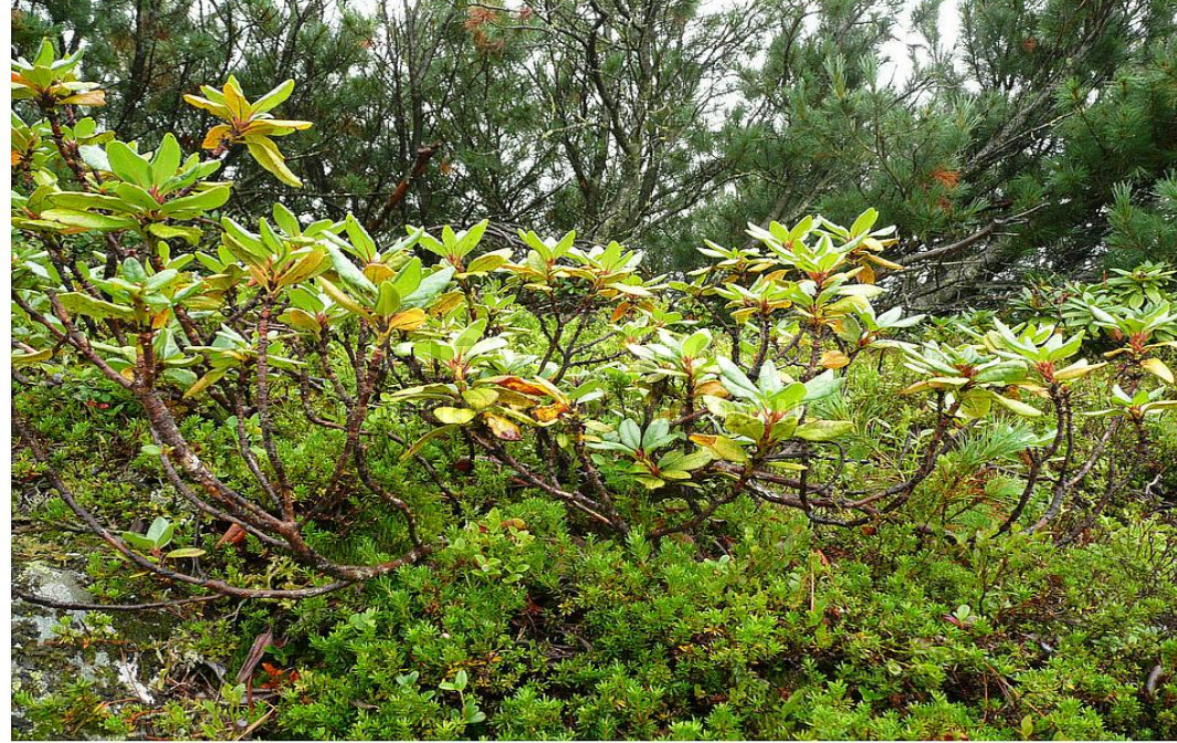
# labr011020907 Lake Baikal area, Russia