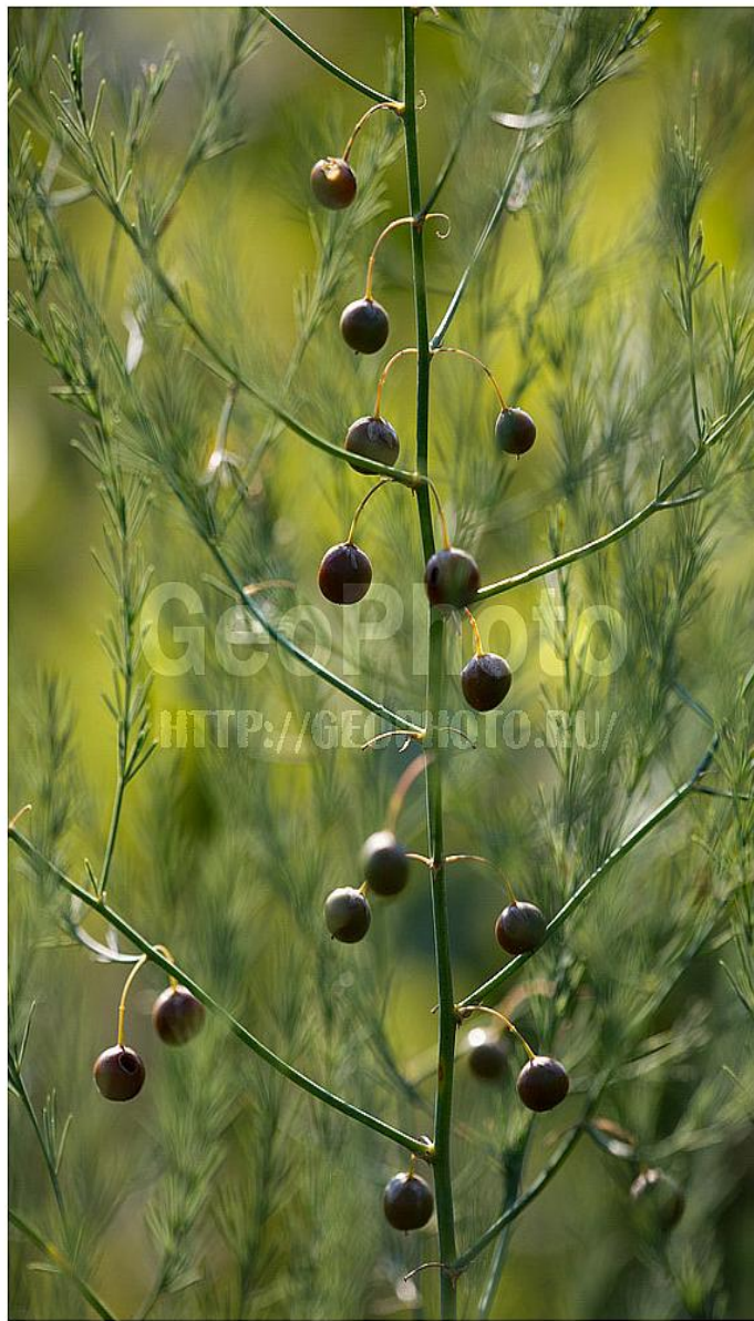
# adk1212070286 Reserve Galichya Mountain, Lipetsk region