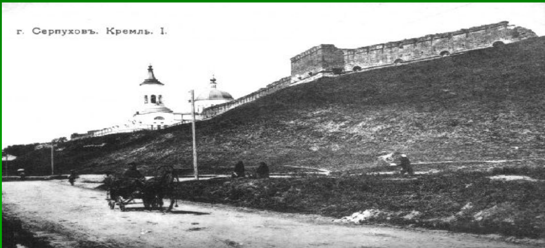
г. Серпуховъ. Кремль. I.