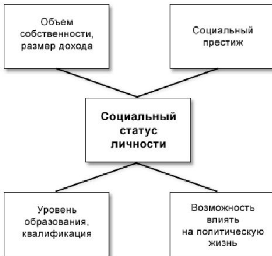
Схема: Из чего складывается социальный статус