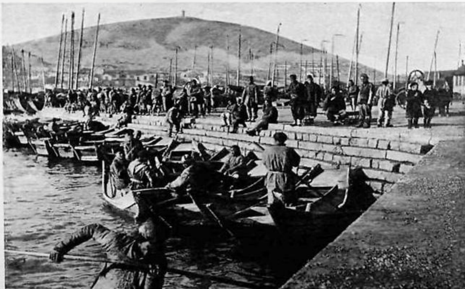
ПОРГЪ-АРТУРЪ. НАБЕРЕЖНАЯ ВНУТРЕННЯГО РЕЙДА.