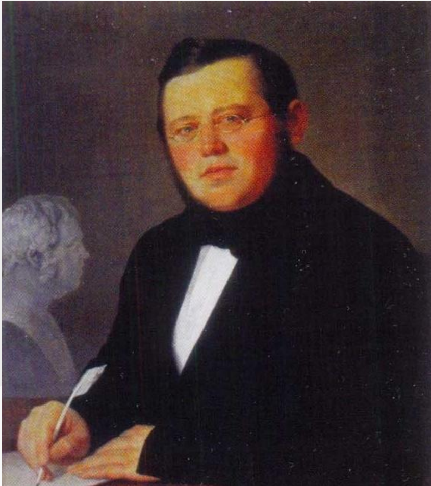
В.Тропинин. Портрет М.Н. Загоскина