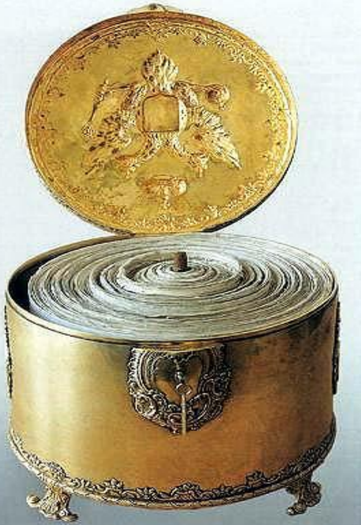
Соборное Уложение Центральный Гос. архив