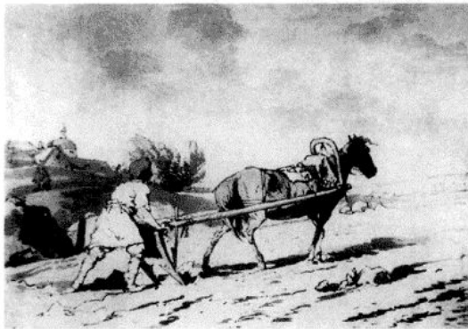
2. Д.А.Аткинсон. Пашущий крестьянин. Раскрашенная гравюра (Гос. Эрмитаж).

А отдавати беглых крестьян и бобылей из бегов по писцовым книгам всяких чинов людем без урочных лет.