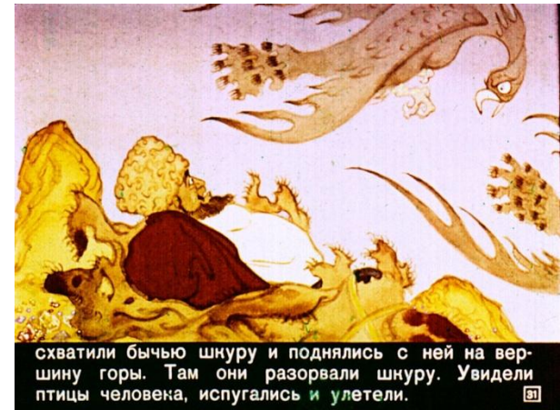
схватили бычью шкуру и поднялись с ней на вершину горы. Там они разорвали шкуру. Увидели птицы человека, испугались и улетели.

Только теперь бай узнал своего работника.