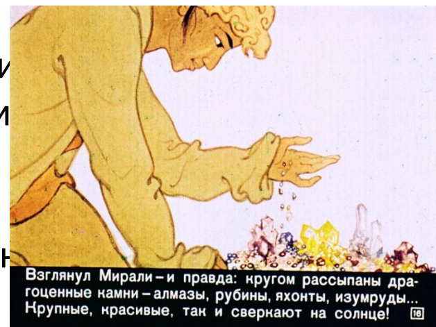
Взглянул Мирали - и правда: кругом рассыпаны драгоценные камни - алмазы, рубины, яхонты, изумруды... Крупные, красивые, так и сверкают на солнце!