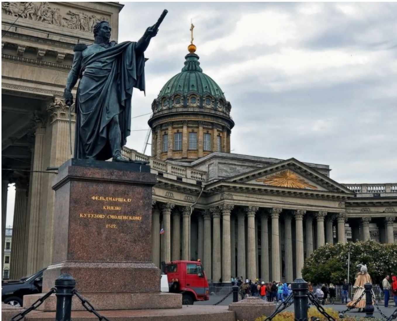
Памятник М.И.Кутузову- Смоленскому