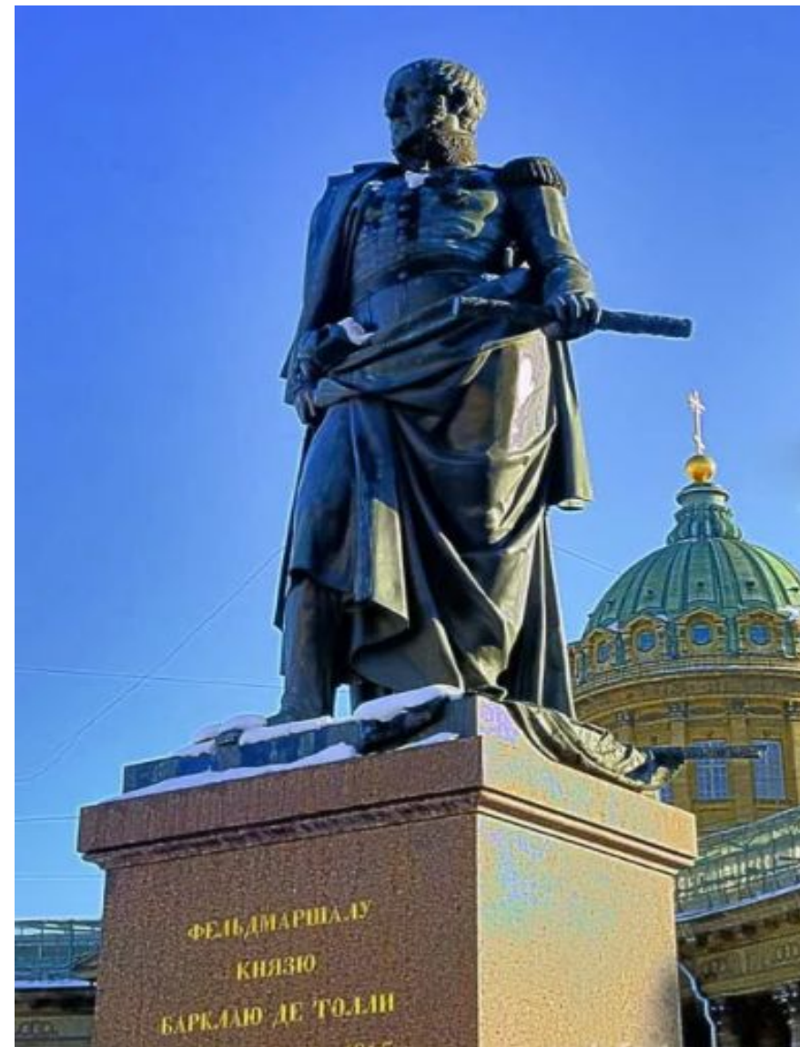
Памятник М.Б. Барклай де Толли