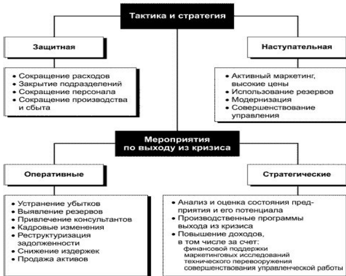
Рис. 7. Стратегия и тактика в управлении кризисным предприятием