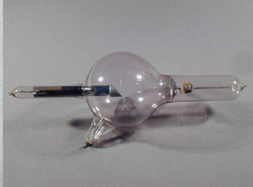
Одна из первых рентгеновских трубок