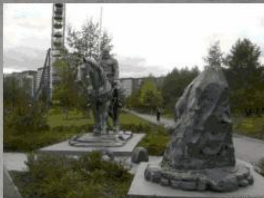
Памятник Ильѐ Муромцу в городе Екатеринбург.