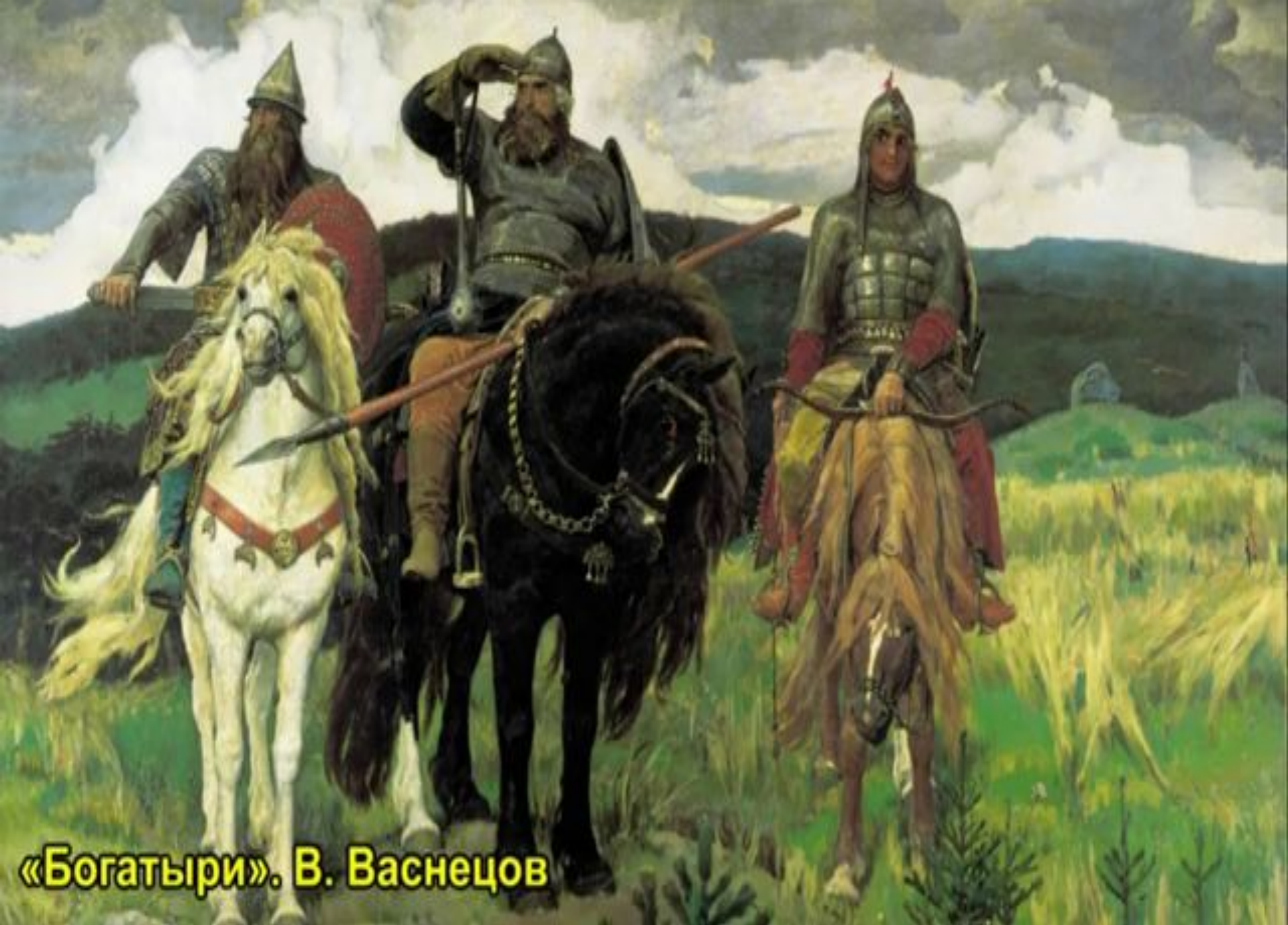
«Богатыри». В. Васнецов