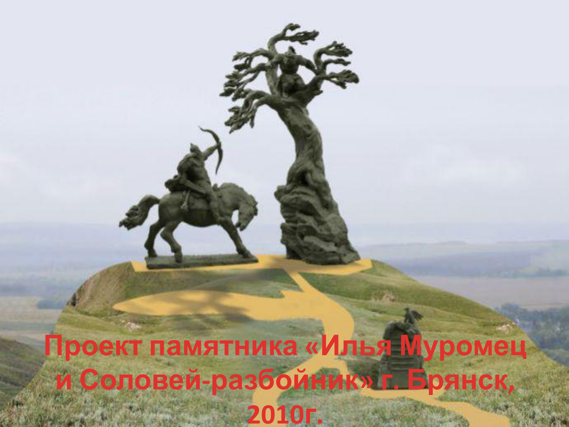
Проект памятника «Илья Муромец и Соловей-разбойник» г. Брянск, 2010г.