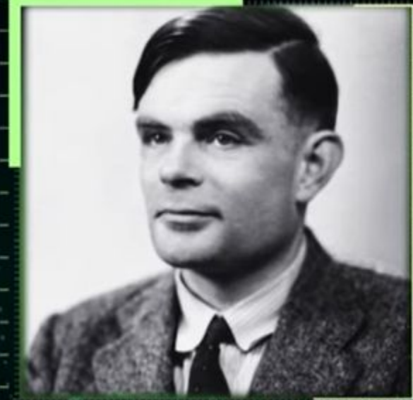
Алан Тьюринг, 1950