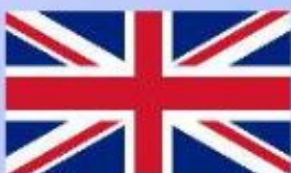
ВЕЛИКОБРИТАНИЯ Энтони Чарльз Линтон (Тони) Блэйр Премьер-министр Великобритании