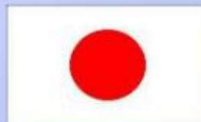
ЯПОНИЯ Йосиро Мори Премьер-министр Японии