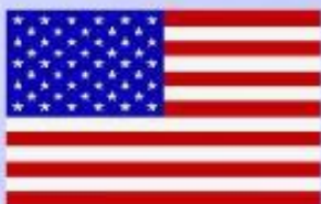
США Билл Клинтон Президент Соединенных Штатов Америки