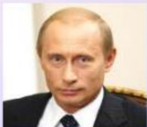
РОССИЯ Владимир Путин Президент Российской Федерации

Окинавская хартия глобального информационного общества принята 22 июля 2000 года лидерами стран «Большой восьмёрки»