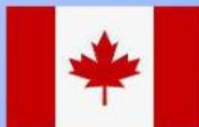
КАНАДА Жан Кретьен Премьер-министр Канады