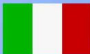
ИТАЛИЯ Джулиано Амато Председатель Совета министров Итальянской республики