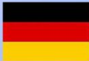
ГЕРМАНИЯ Герхард Шрёдер Федеральный канцлер ФРГ