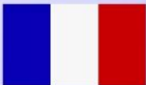
ФРАНЦИЯ Жак Ширак Президент Французской Республики