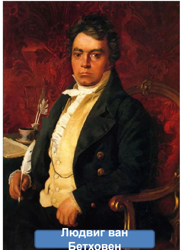
Людвиг ван Бетховен

Родина всемирно известных композиторов классической музыки – Бах, Гендель, Бетховен, Мендельсон, Штраус