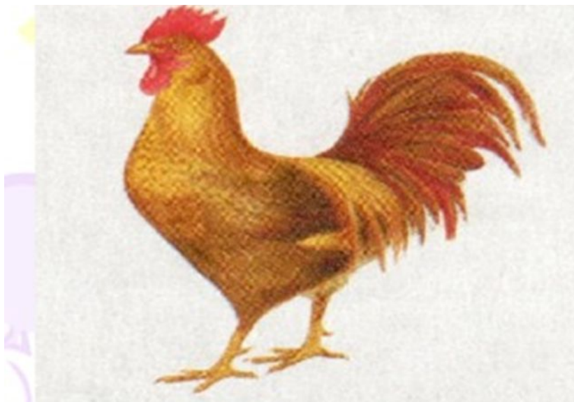
ПЕТУХ Домашняя птица