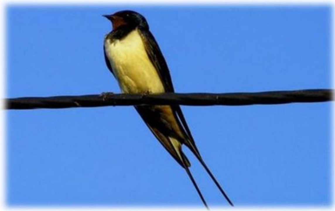
ЛАСТОЧКА Перелетная птица