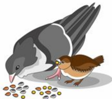
Голуби и воробьи