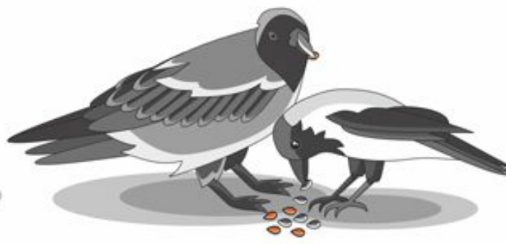
Вороны и сороки