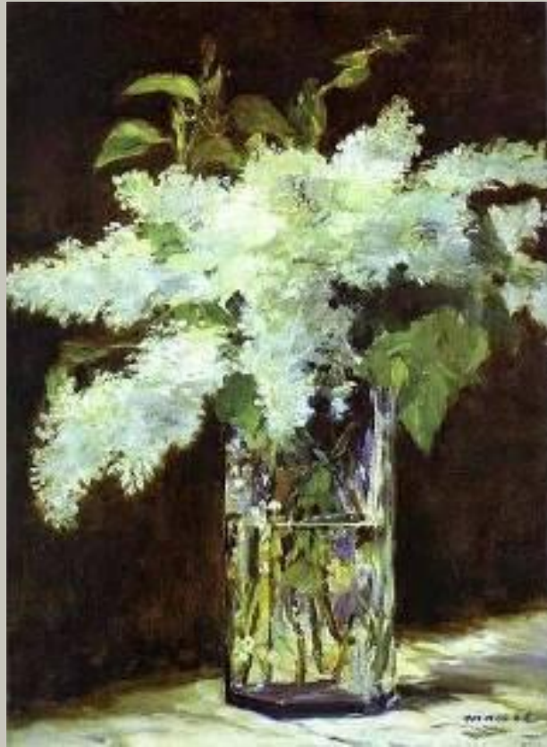
Э.Мане «Сирень в стекле»

Импрессионизм – направление в искусстве последней трети 19 – начала 20 века, представители которого стремились наиболее естественно и непредвзято запечатлеть мир в его подвижности и изменчивости, передавать свои мимолетные впечатления. Наиболее известные французские импрессионисты Эдуард Мане, Огюст Ренуар. Среди русских живописцев - К.А. Коровин, И.Э.Грабарь.