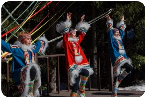
Танцевальный коллектив «Югра Хосыет»