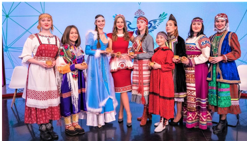
Международный конкурс «Мисс студенчества Финно-Угрии» 2013-2021гг.