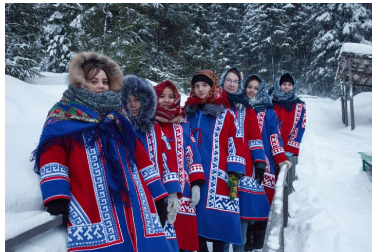
Праздник приношения луне «Тылац пори»