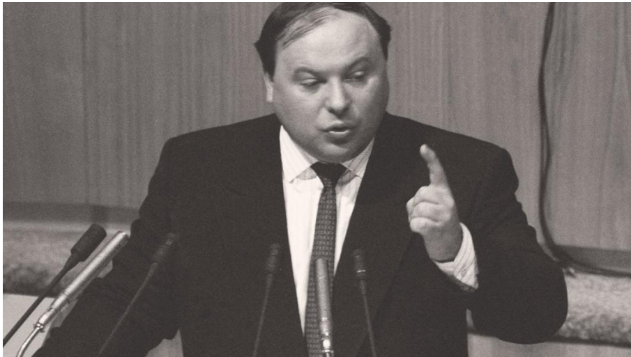
Егор Тимурович Гайдар