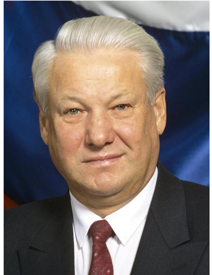
Борис Николаевич Ельцин