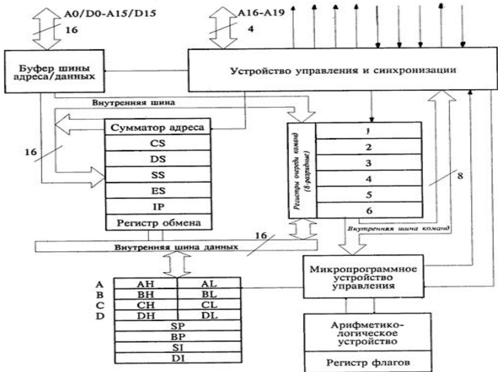
Рис.2. Внутренняя структура микропроцессора 8086.