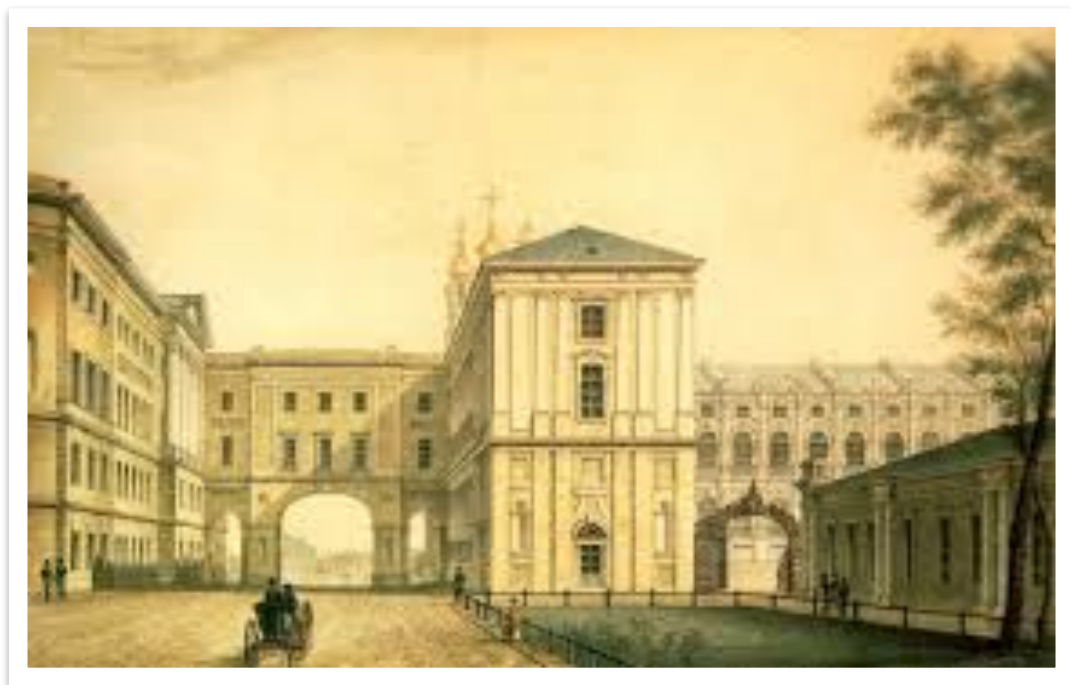
Демидовский в Ярославле 1805