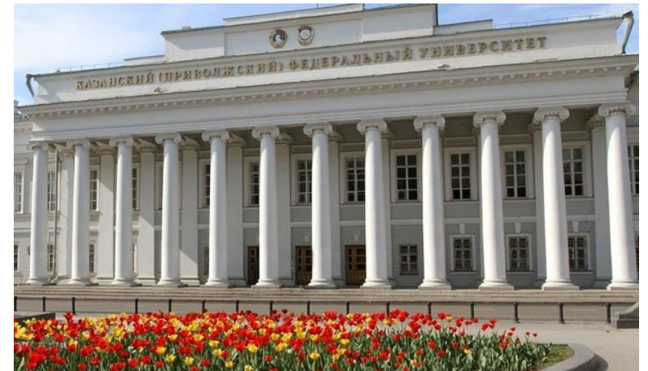
Казанский университет: история и современность