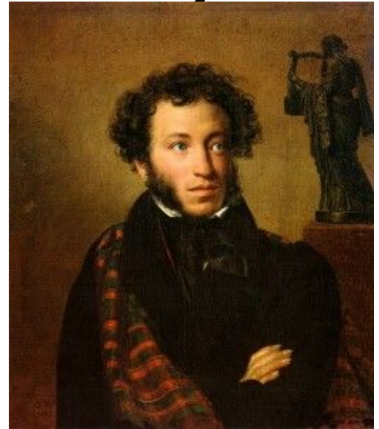
Портрет А.С. Пушкина О.Кипренской, 1828