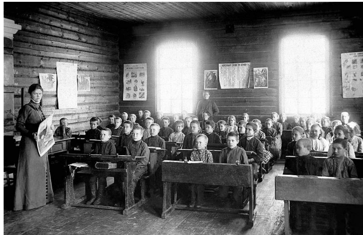
урок в земской школе