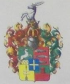
Герб династии Ланских