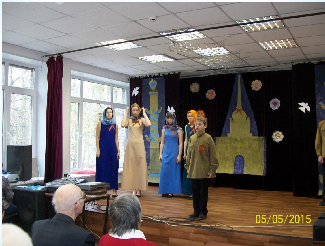
Концерт к 9 мая.