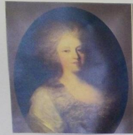
Ф.Рокотов – Портрет Прасковьи Николаевны Ланской