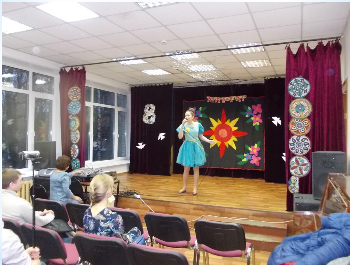
Концерт к 8 марта.