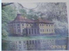
Дача Ланских в наше время.