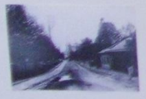
Богородицкая улица 1913 г.