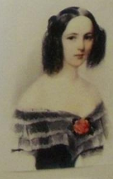
Наталья Николаевна Пушкина-Ланская