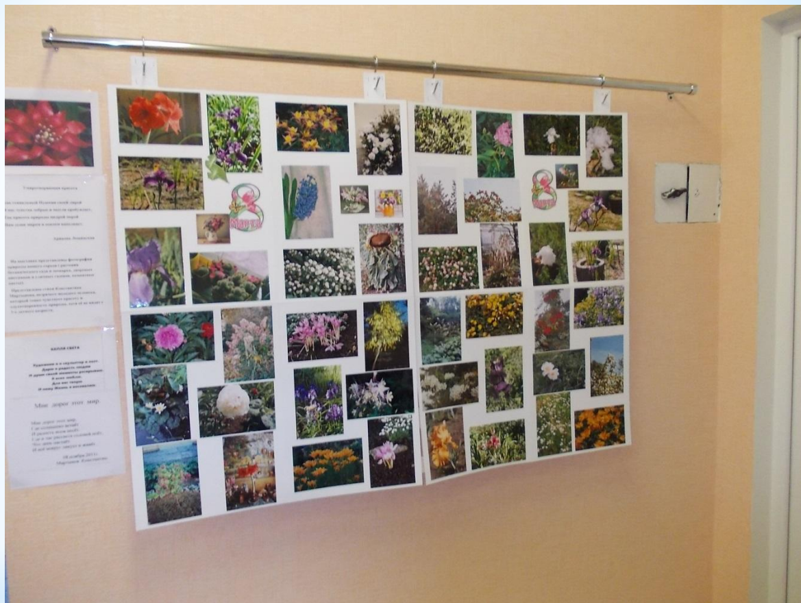
Фотовыставка Ариадны Лещинской «Цветы».