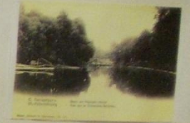
Старинные виды Новой Деревни и Черной реки