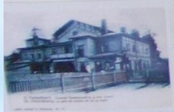
Железнодорожная станция Новая Деревня