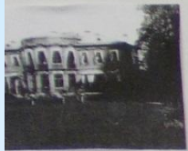
Дача Ланской Марии Васильевны