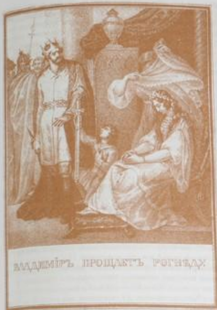
ВЛАДИМИРЪ ПРОЩАЕТЪ РОГНЕДУХЪ

Деталист нин удавался, каким образом проповедники Вир-долженствовали говорить с Владимиром; но ежели греческий