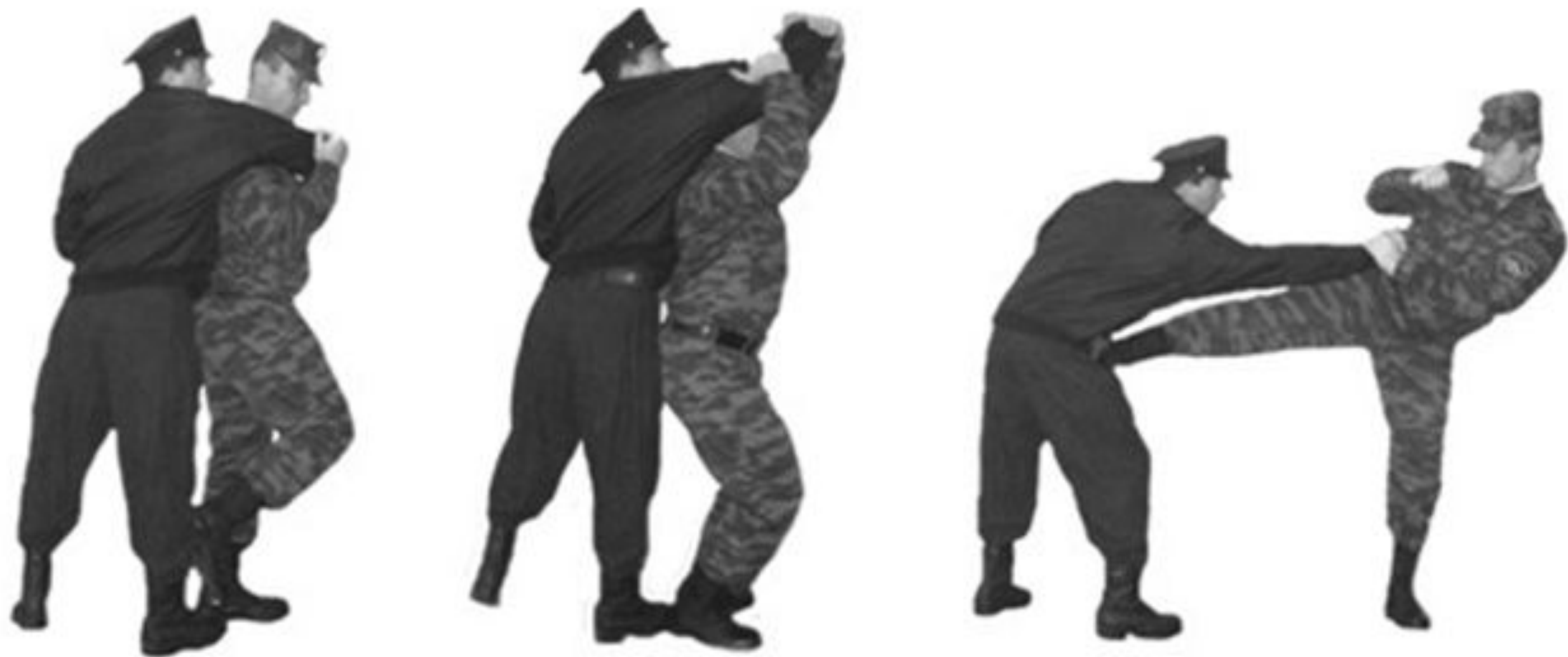
Рис. 47. Освобождение от захватов противником шеи сзади.