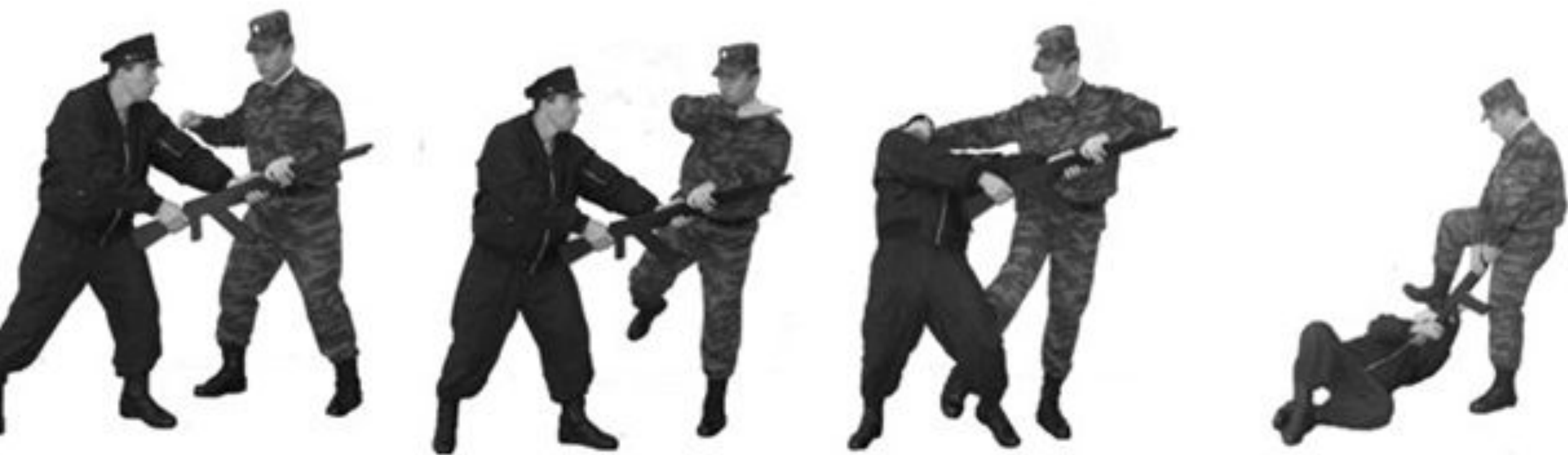
Рис. 56. Обезоруживание противника при уколе штыком с уходом вправо.