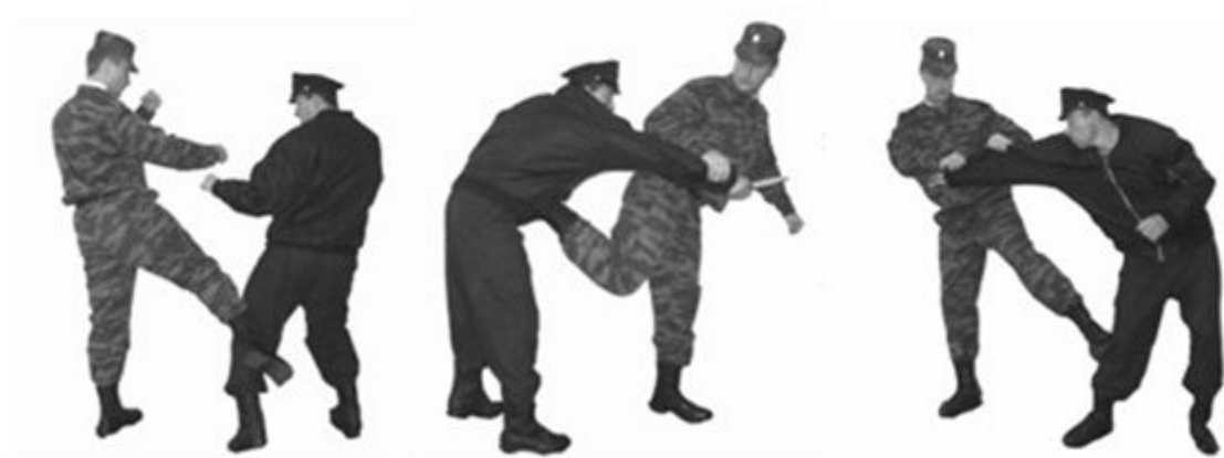
Рис. 35. Удары ногой.

УДАРЫ РУКАМИ УДАРЫ НОГАМИ ЗАЩИТА РУКАМИ ЗАЩИТА НОГАМИ УДАРЫ ПЕХОТНОЙ ЛОПАТКОЙ ЗАЩИТА ОТ УДАРОВ ПЕХОТНОЙ ЛОПАТКОЙ ОБЕЗОРУЖИВАНИЕ