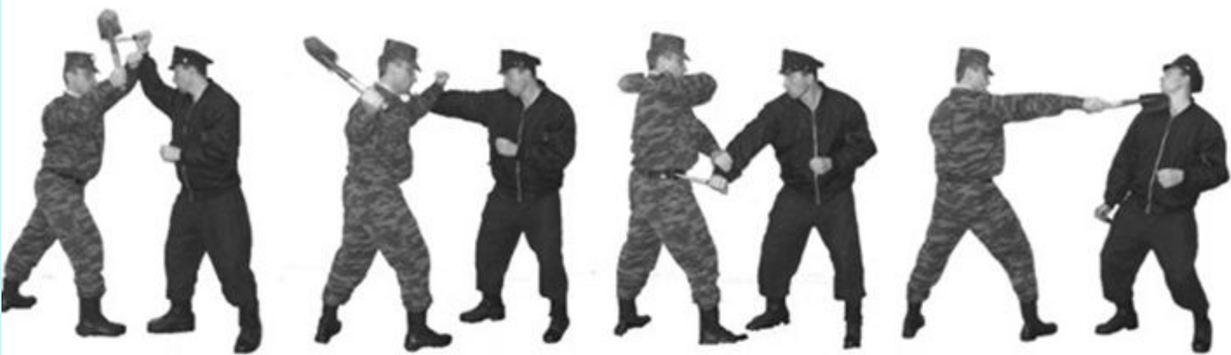
Рис. 37. Удары пехотной лопатой.