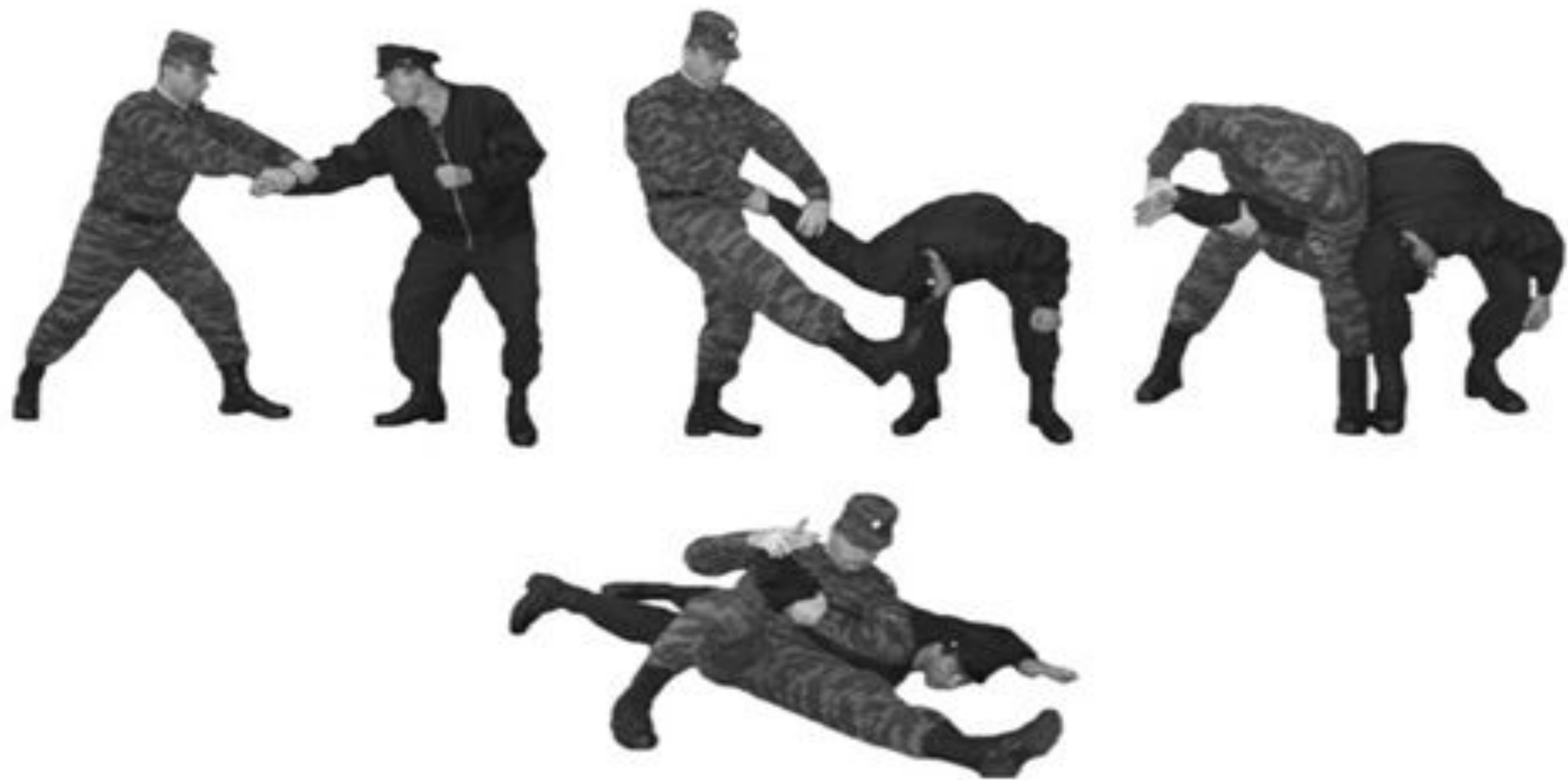
Рис. 51 Рычаг руки внутрь