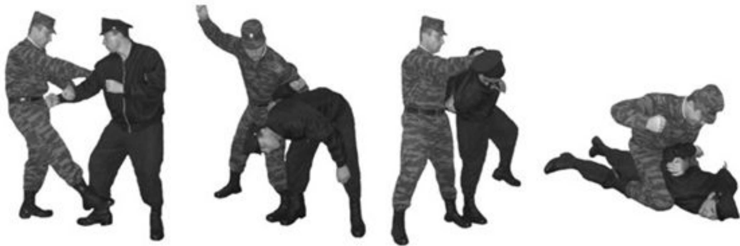
Рис. 49. Загиб руки за спину.