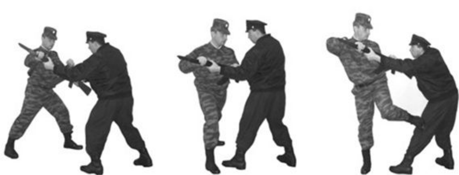
Рис. 39. Обезоруживание противника при уколе штыком с уходом влево.