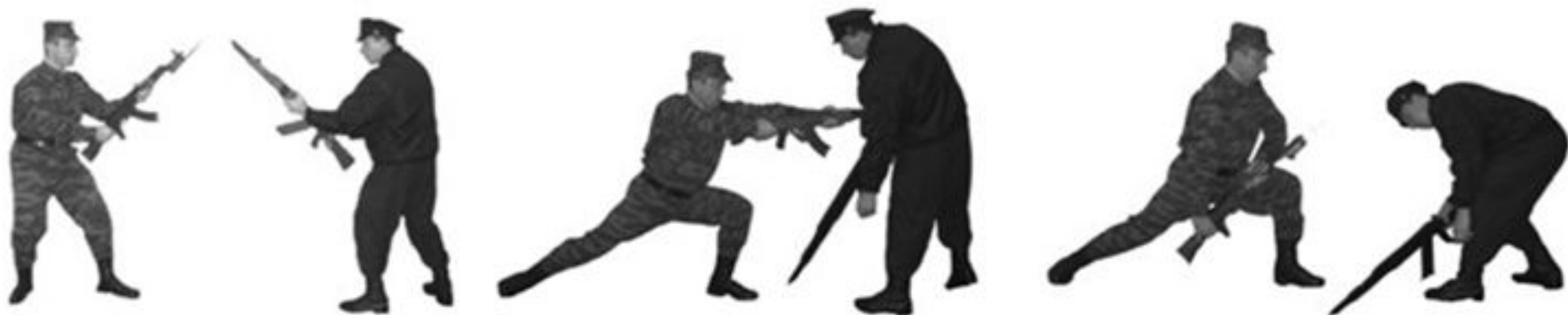
Рис. 25. Укол штыком с выпадом.