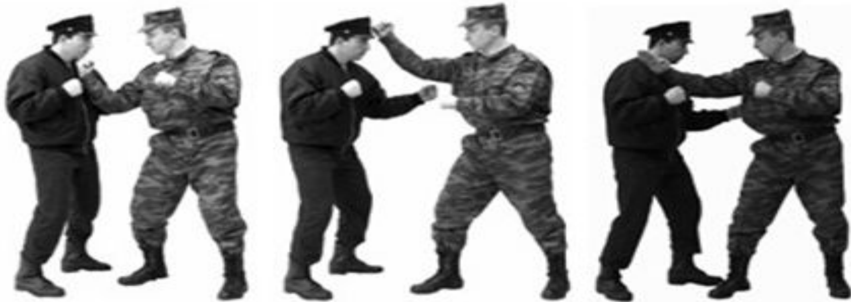
Рис. 33. Удары рукой