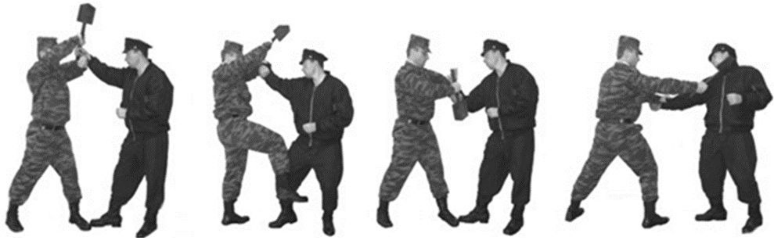
Рис. 41. Обезоруживание противника при ударе пехотной лопатой сверху или справа.