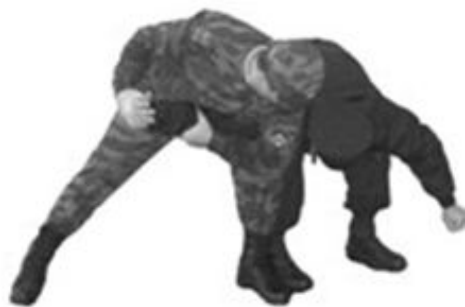
Рис. 65. Освобождение от захватов противником шеи спереди (одежды на груди)