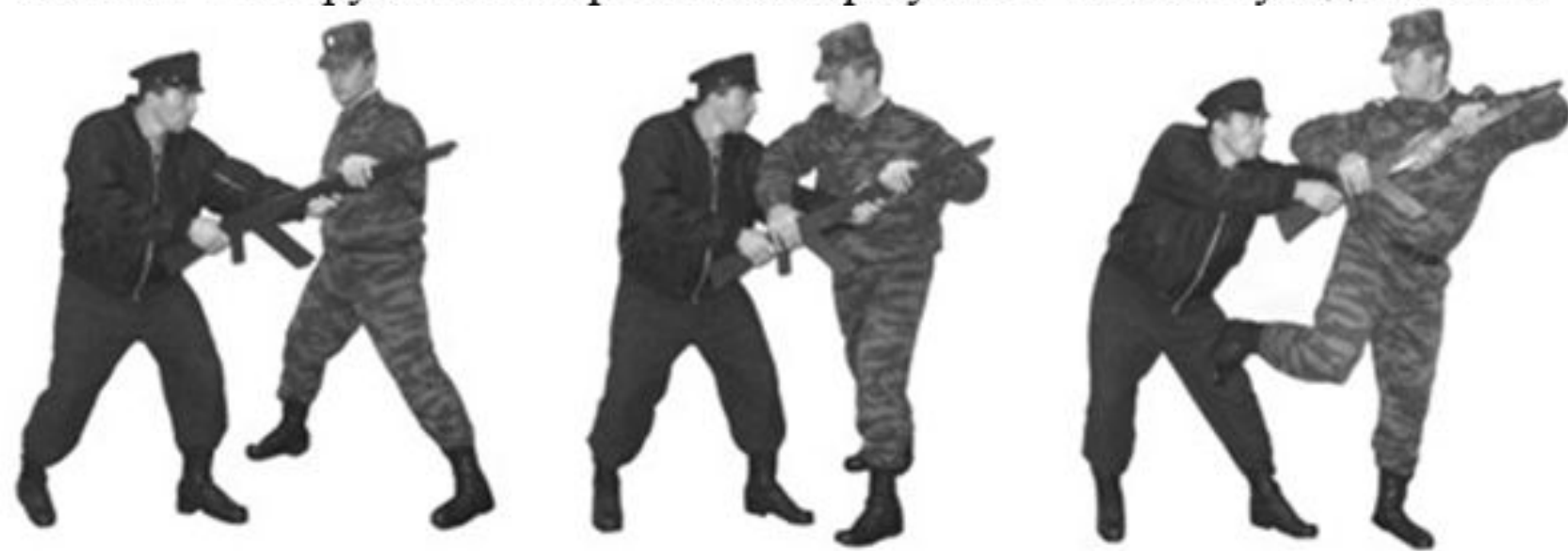
Рис. 40. Обезоруживание противника при уколе штыком с уходом вправо