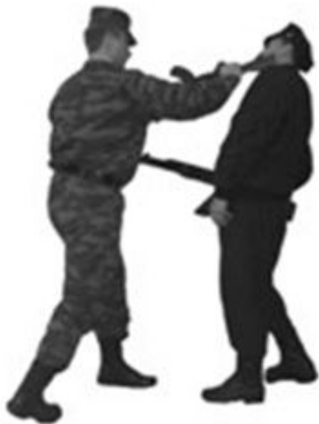
Рис. 26. Удар прикладом сбоку.