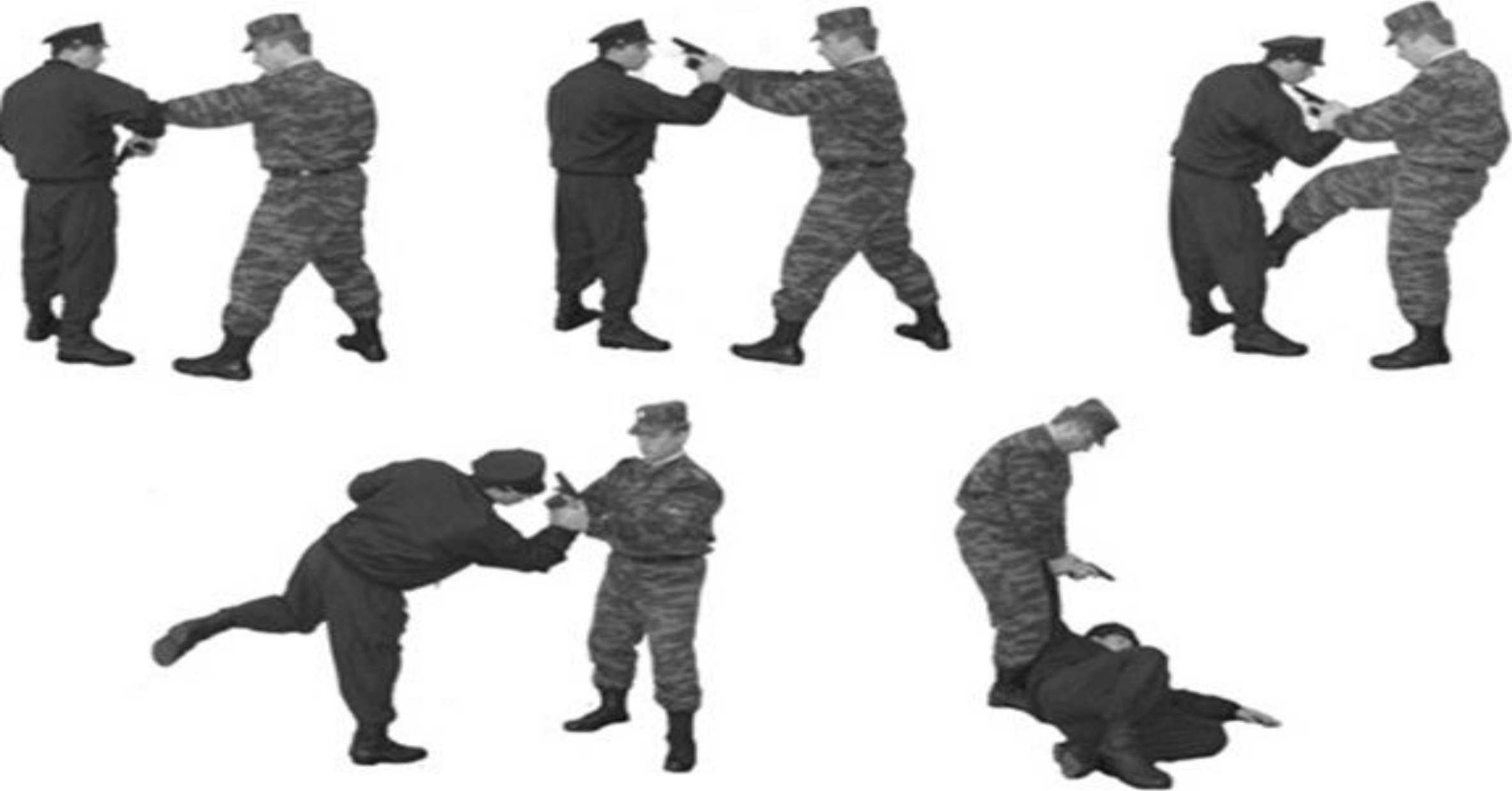
Рис. 62. Обезоруживание противника при угрозе пистолетом при попытке достать пистолет из-за пояса брюк (кобуры спереди)