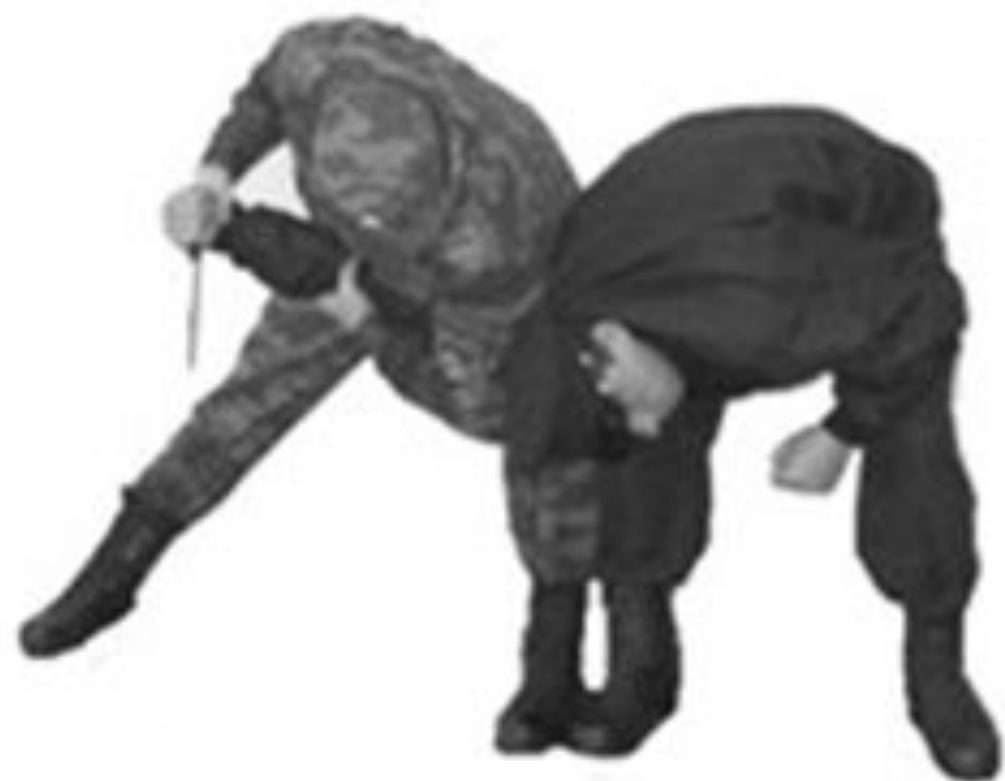
Рис. 60. Обезоруживание противника при ударе ножом наотмашь.