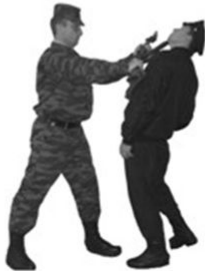
Рис. 29. Удар магазином.