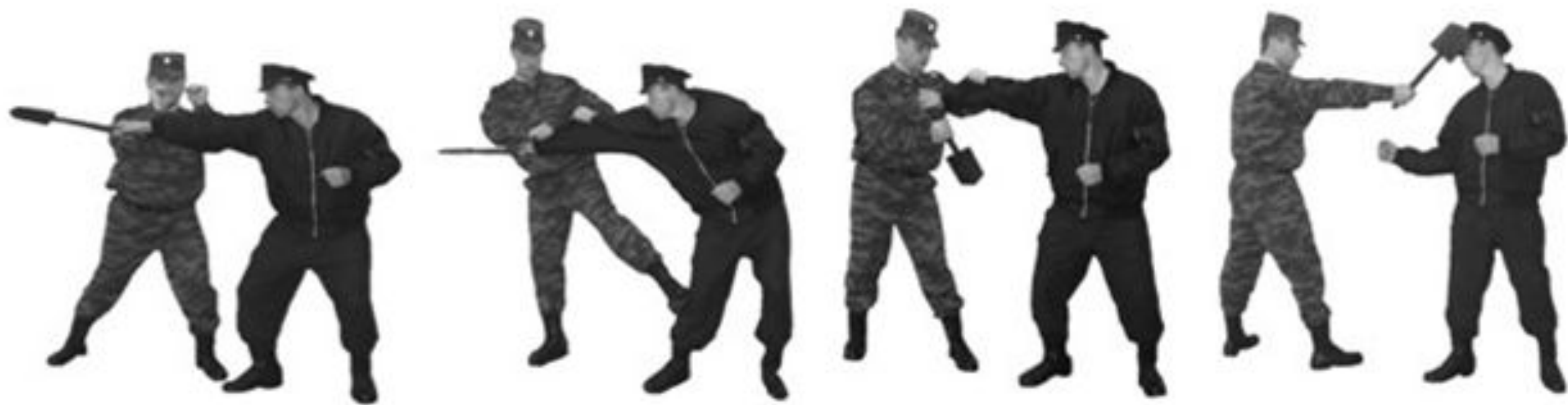
Рис. 42. Обезоруживание противника при ударе пехотной лопатой наотмашь ИЛИ ТЫЧКОМ.