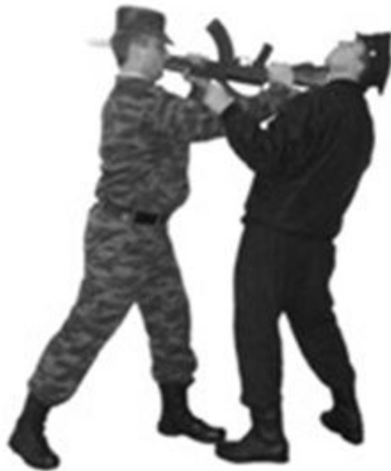
Рис. 27. Удар прикладом снизу.