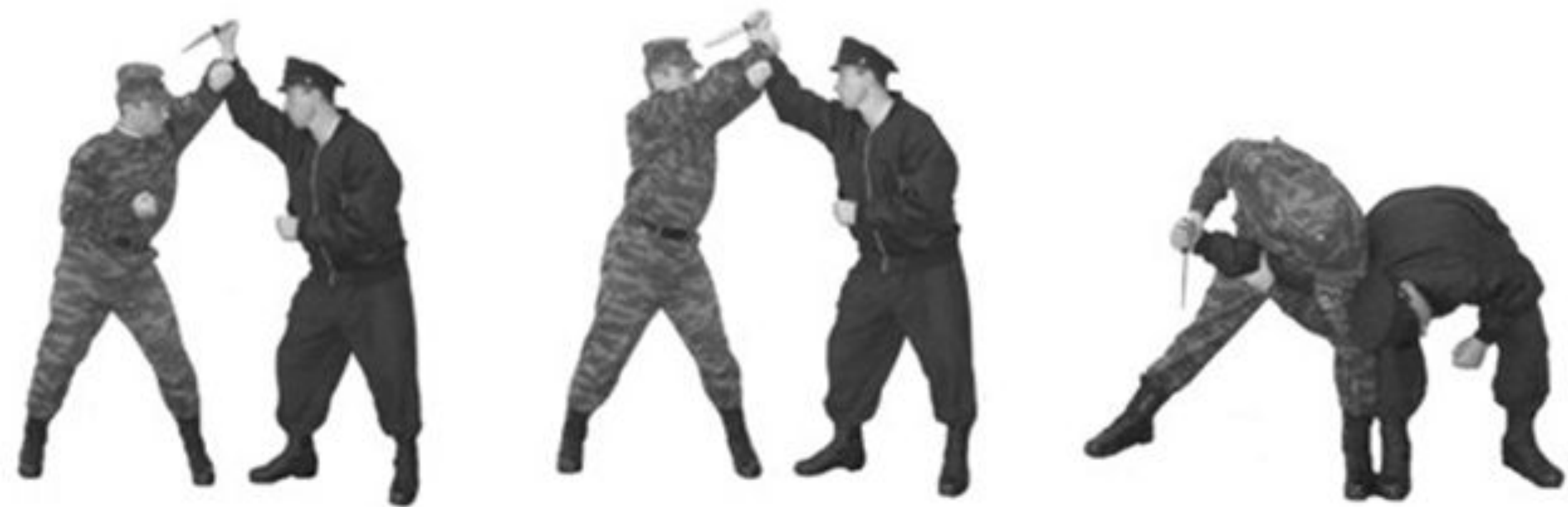
Рис. 58. Обезоруживание противника при ударе ножом сверху.