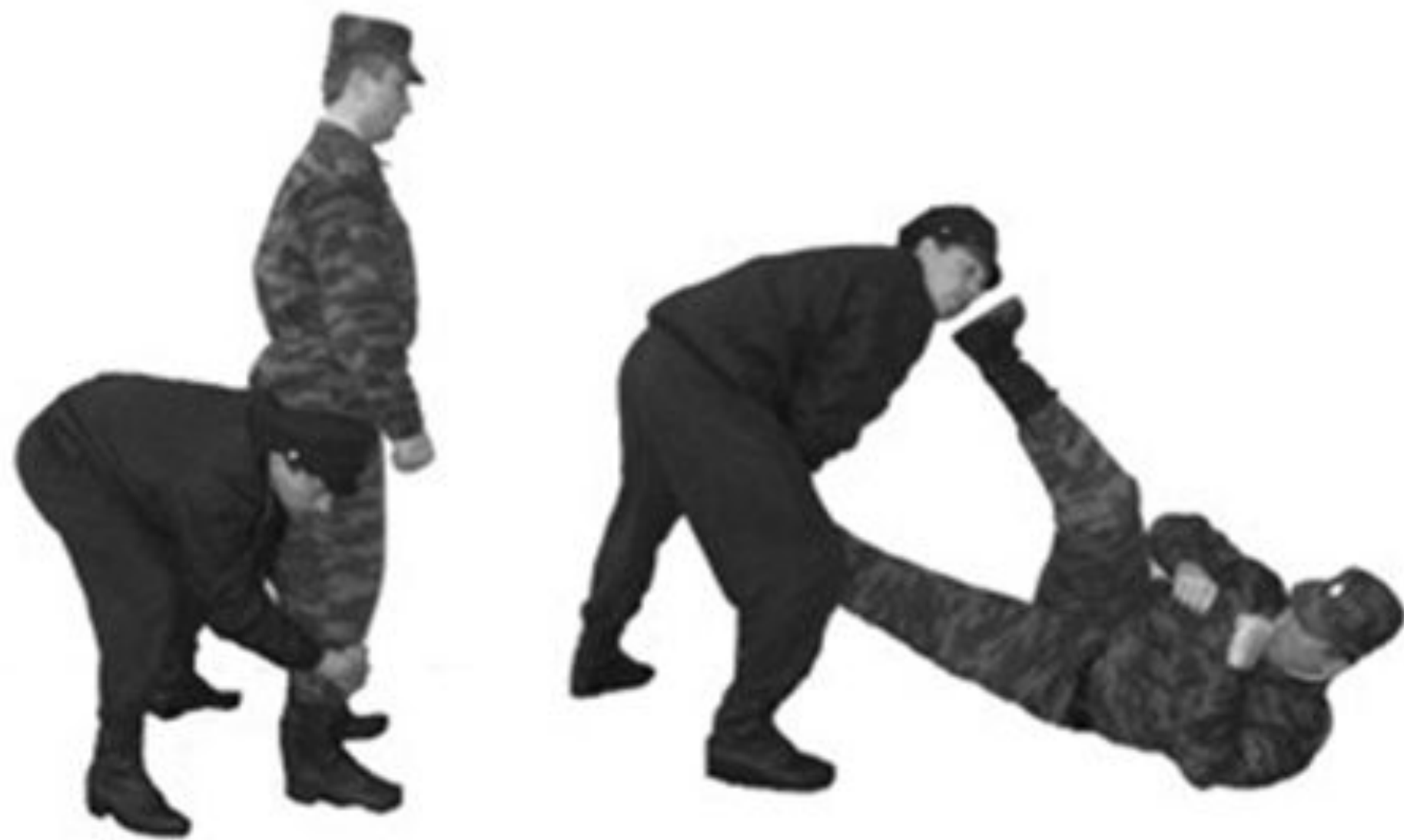
Рис. 72. Освобождение от захватов противником ног сзади.