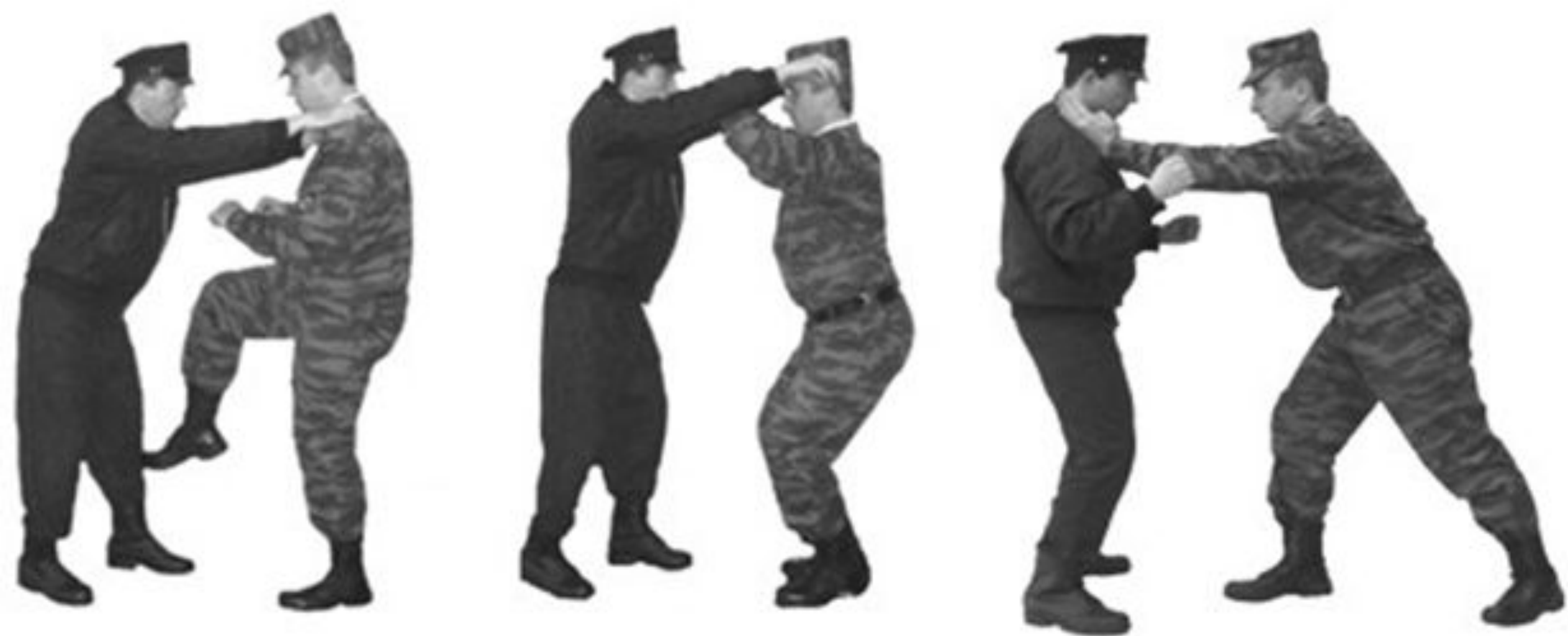
Рис. 48. Освобождение от захватов противником шеи (одежды) спереди.