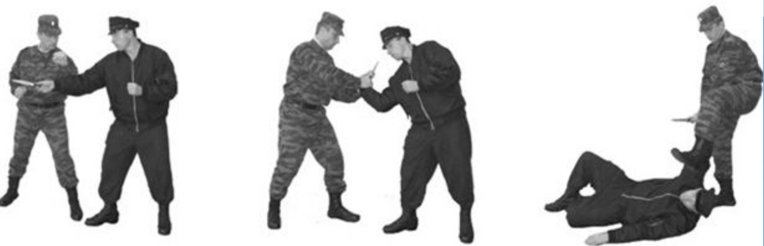
Рис. 57. Обезоруживание противника при ударе ножом прямо.