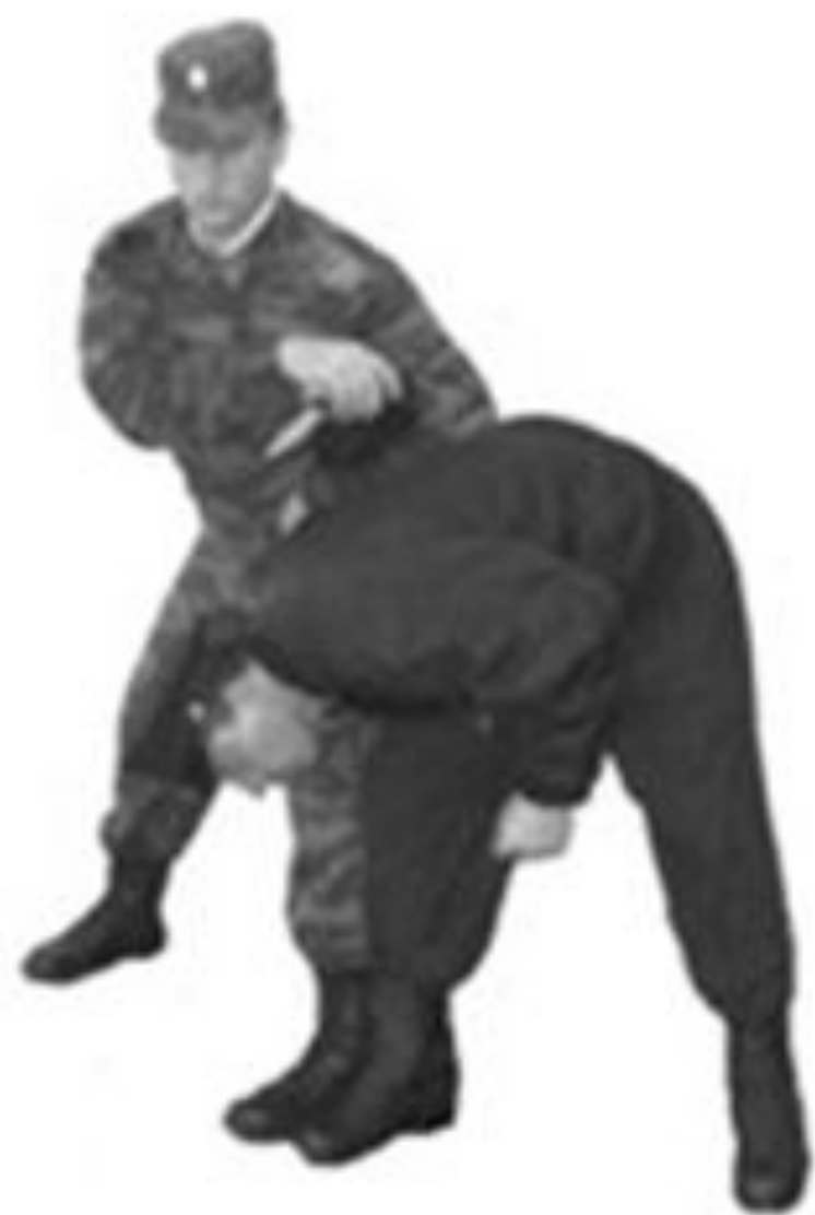
Рис. 59. Обезоруживание противника при ударе ножом снизу.