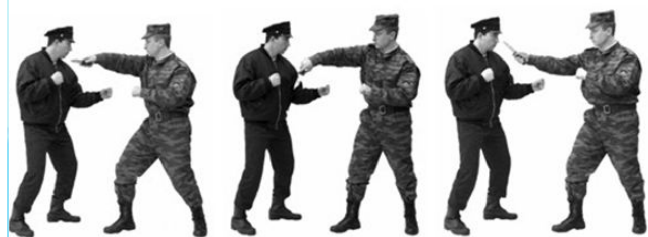
Рис. 44. Режущие удары ножом.