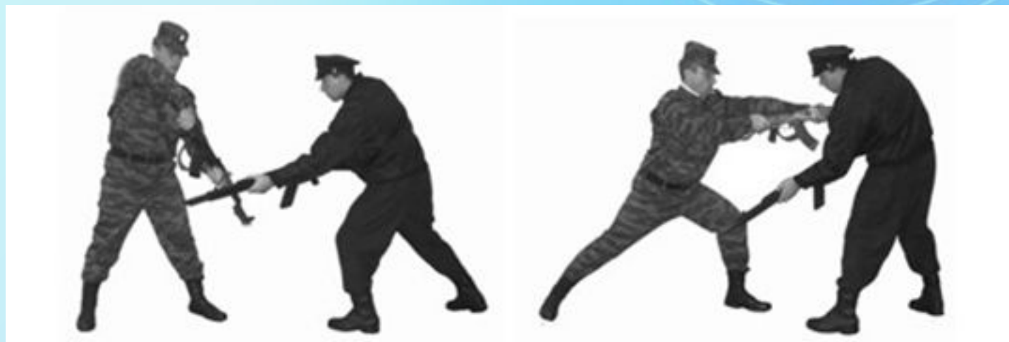
Рис. 31. Отбивы автоматом.