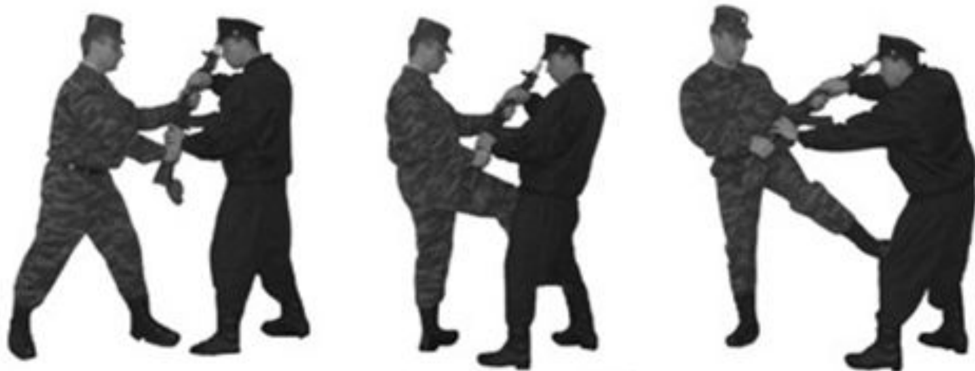
Рис. 32. Освобождение от захвата противником автомата.