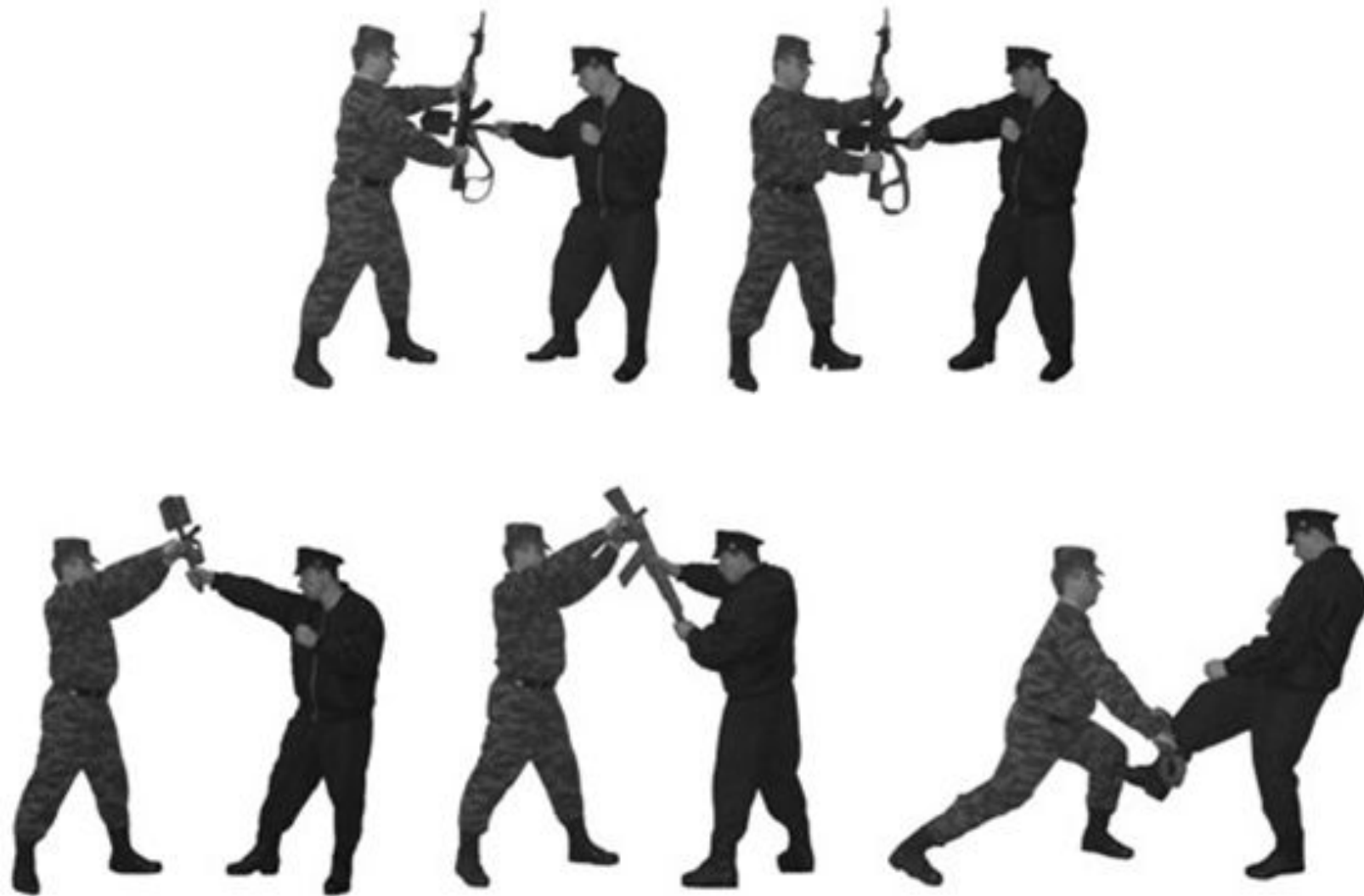
Рис. 30. Защита подставкой автомата.