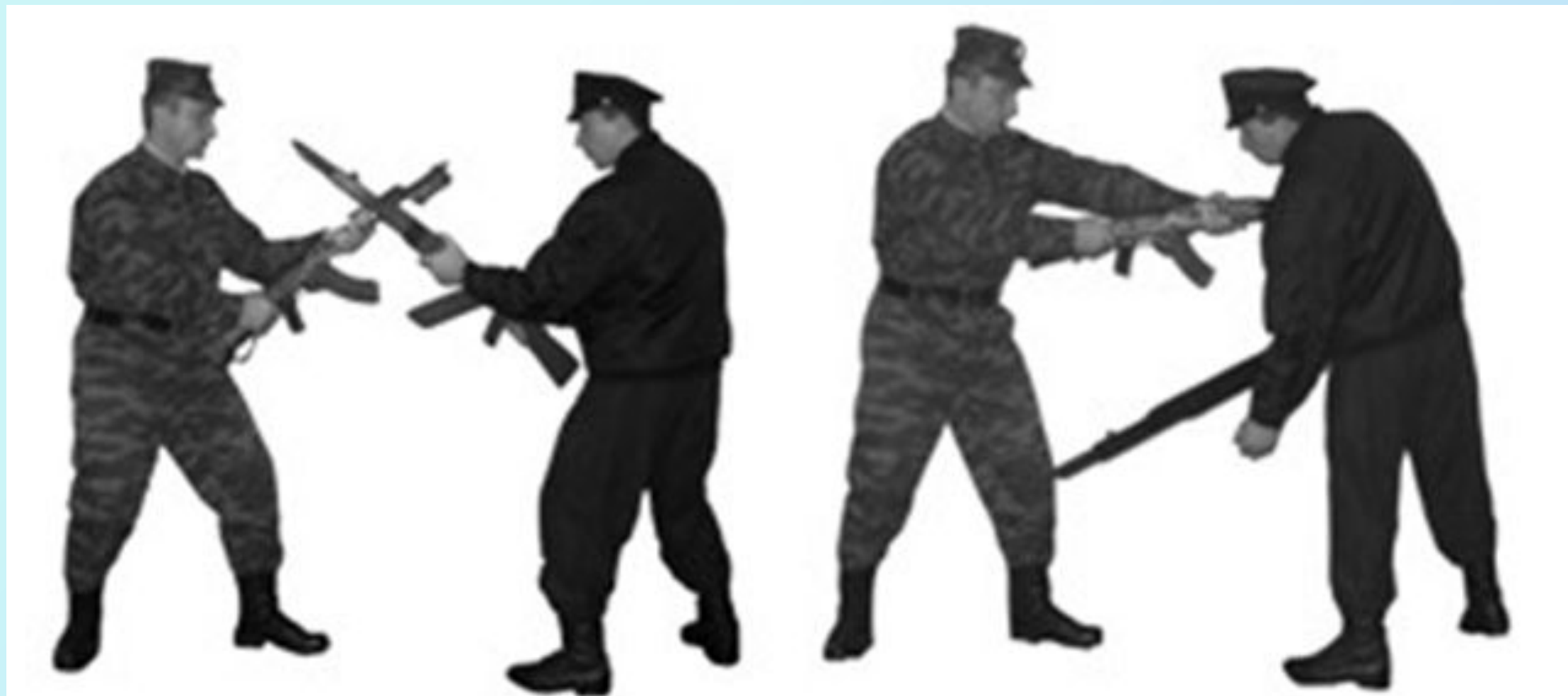
Рис. 24. Укол штыком (тычок стволом) без выпада.