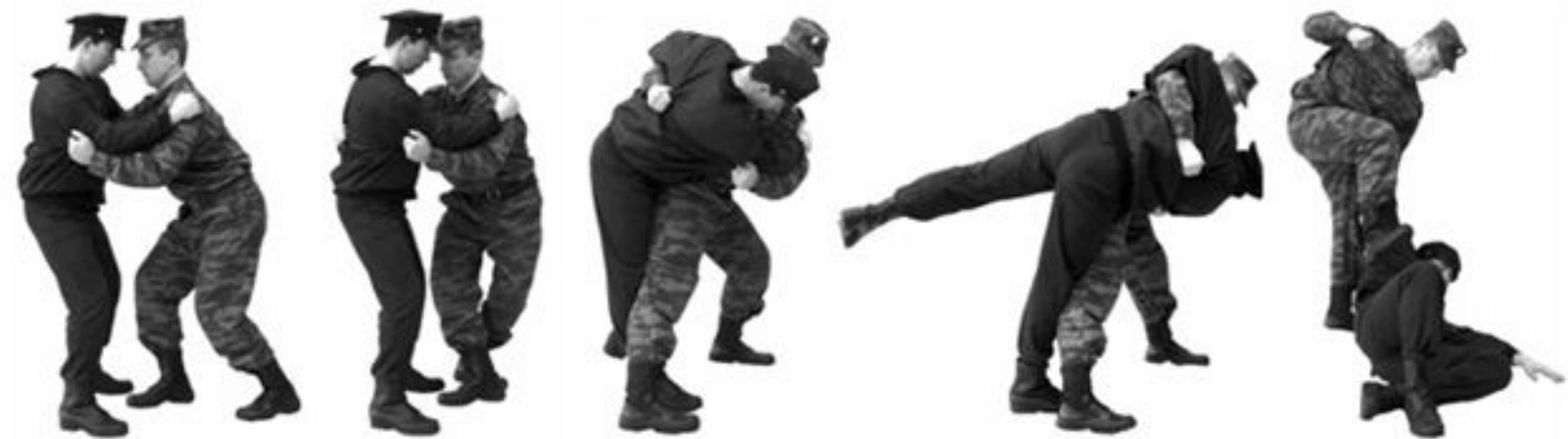
Рис. 53. Передняя подножка.