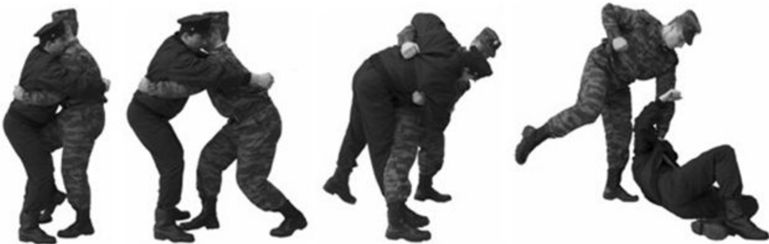
Рис. 70 Освобождение от захватов противником туловища с руками спереди.