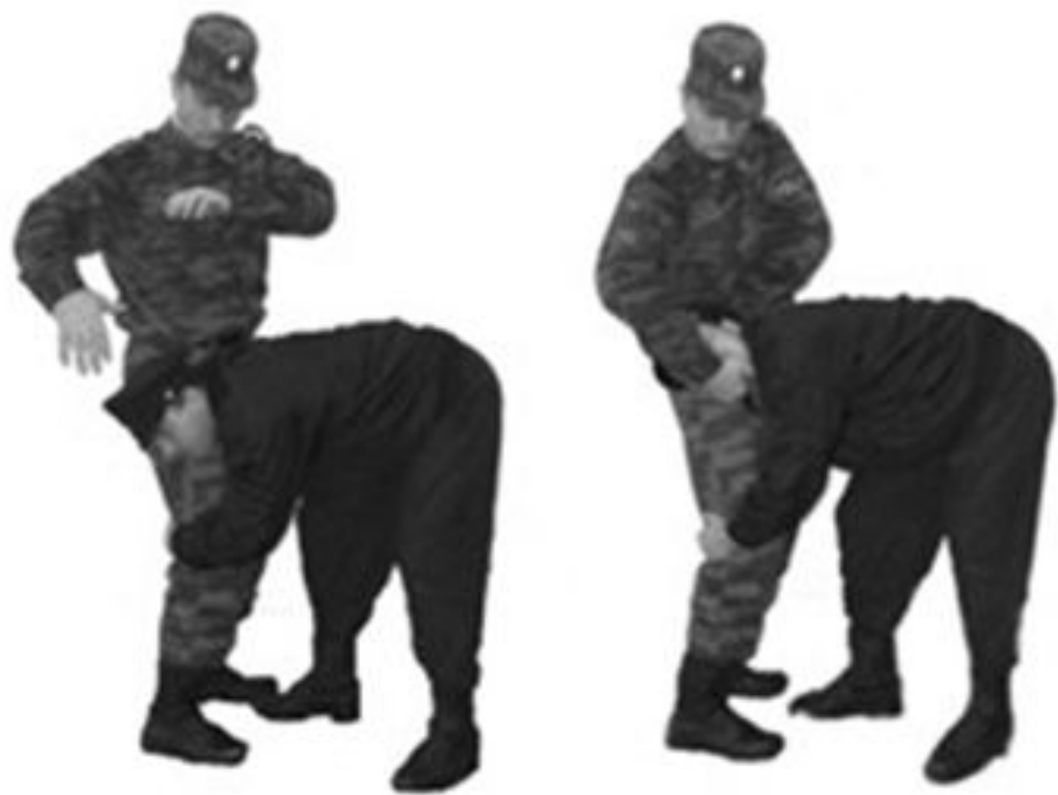
Рис. 71. Освобождение от захватов противником ног спереди.