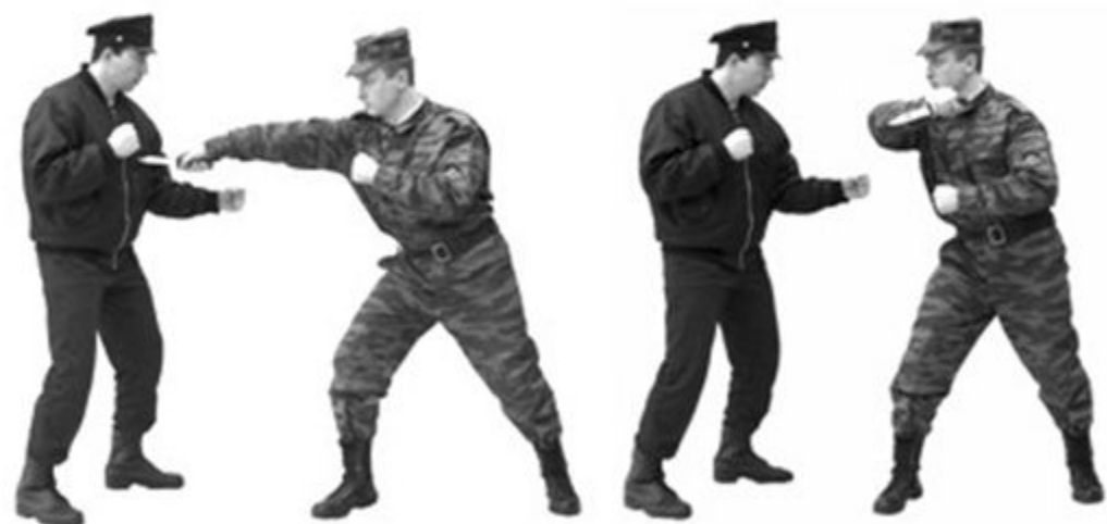
Рис. 43. Коллющие удары ножом.