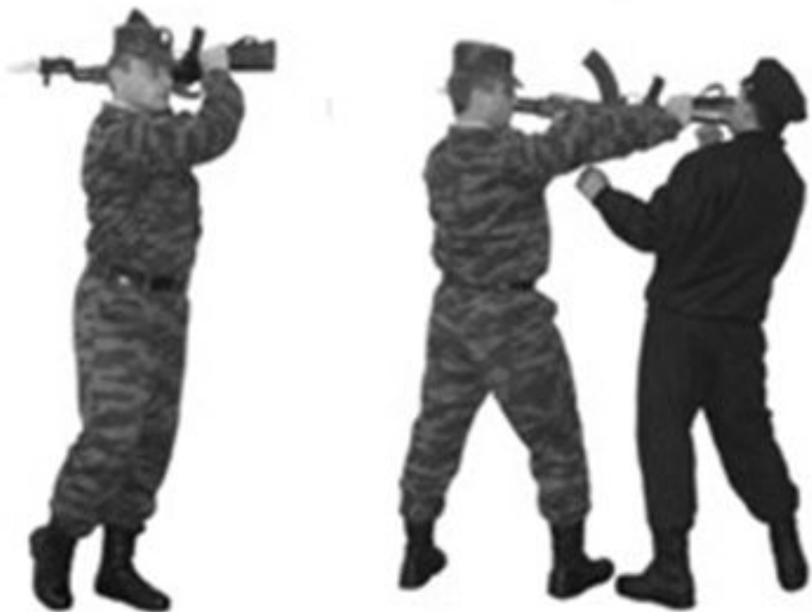
Рис. 28. Удар затыльником приклада.