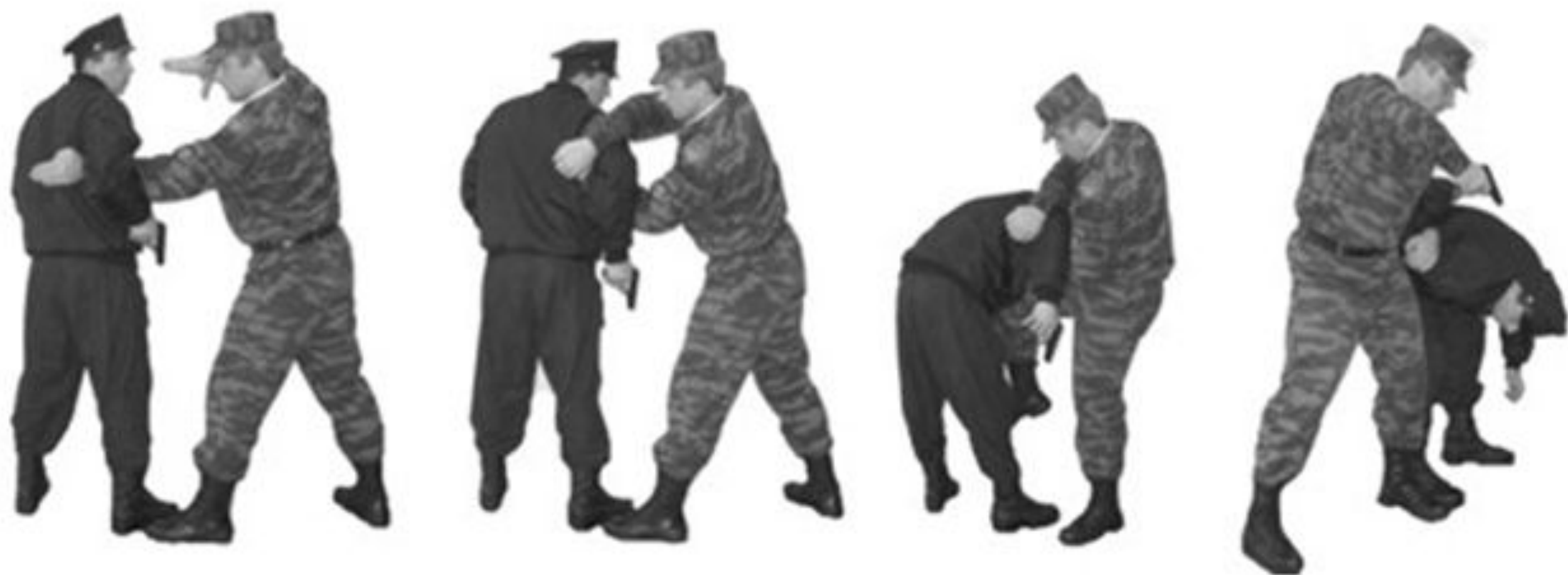
Рис. 61. Обезоруживание противника при угрозе пистолетом при попытке достать пистолет из кобуры (кармана).