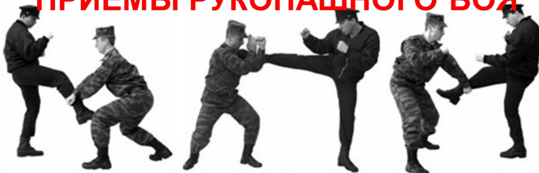
Рис. 36. Защита от удара ногой.