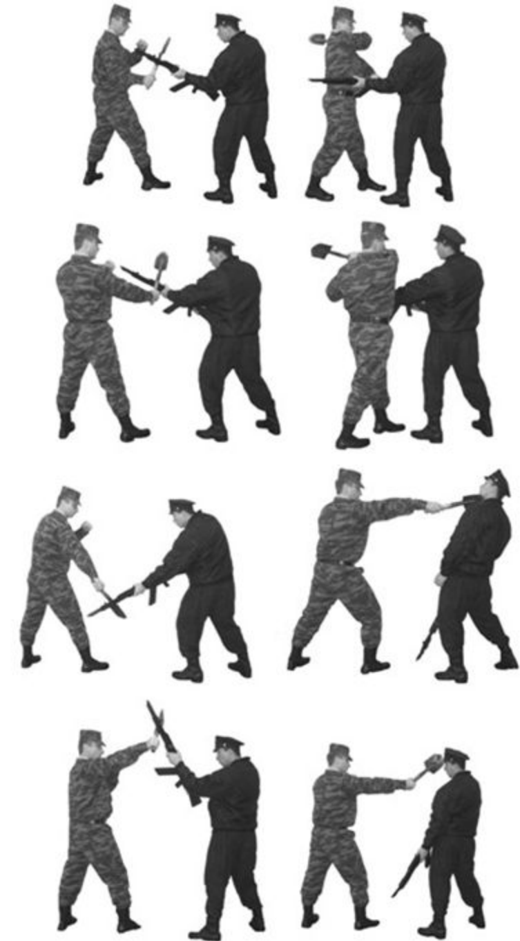
Рис. 38. Отбивы пехотной лопатой