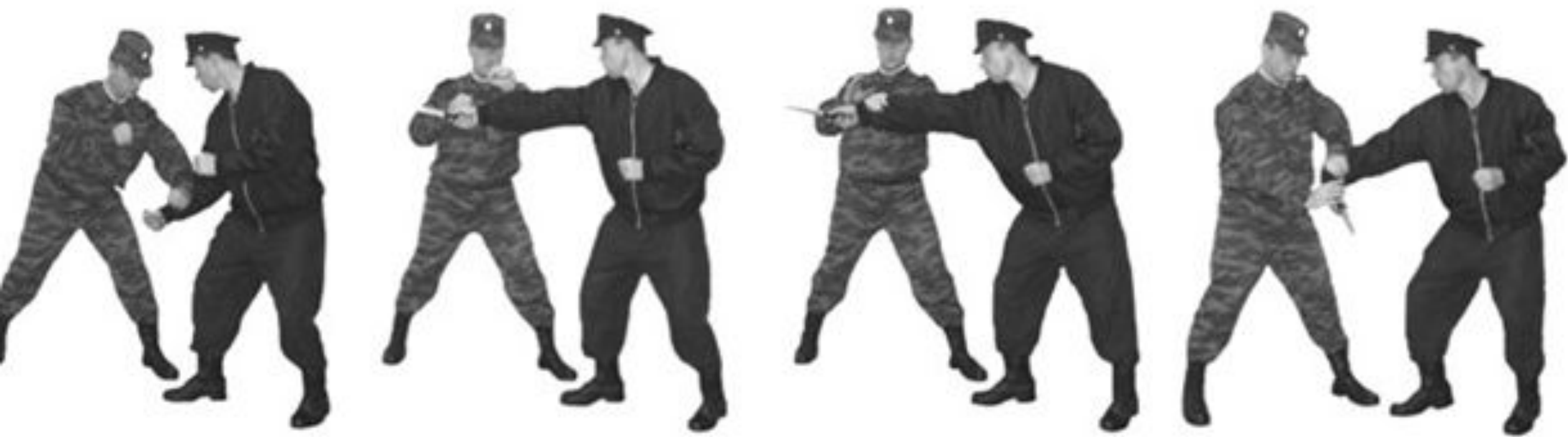
Рис. 46. Обезоруживание противника при ударе ножом снизу или прямо.