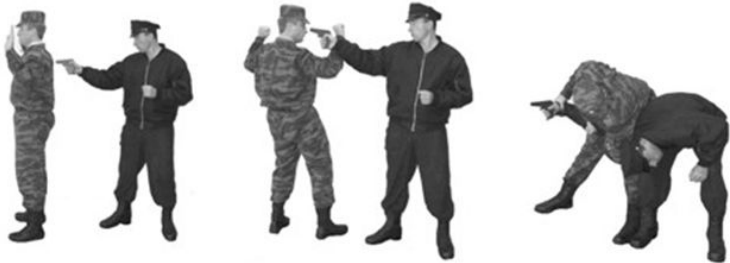
Рис. 64. Обезоруживание противника при угрозе пистолетом в упор сзади.