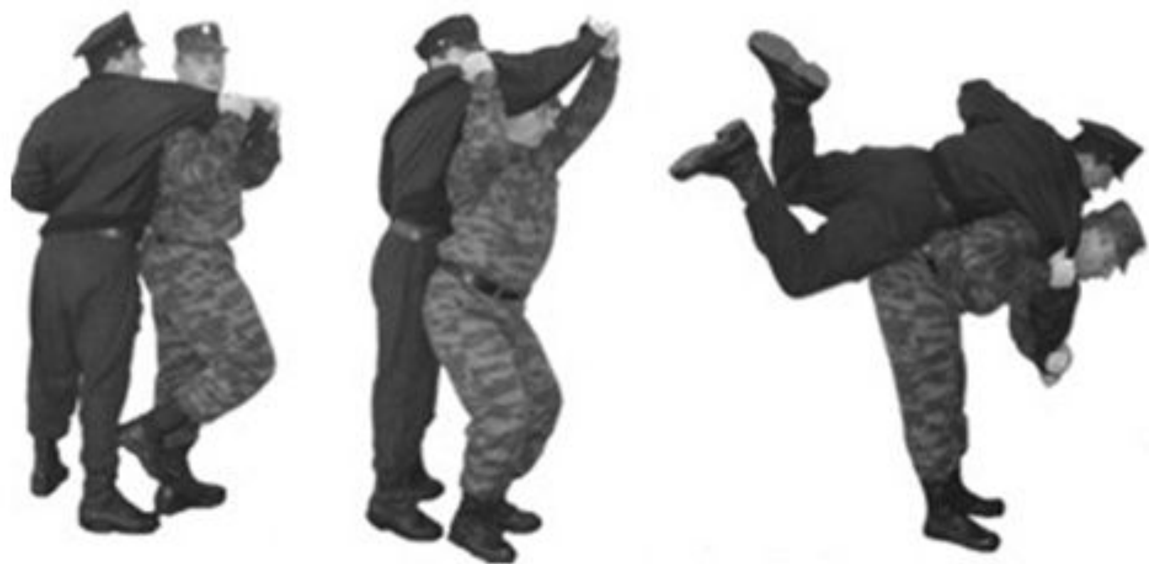
Рис. 66. Освобождение от захватов противником шеи сзади.