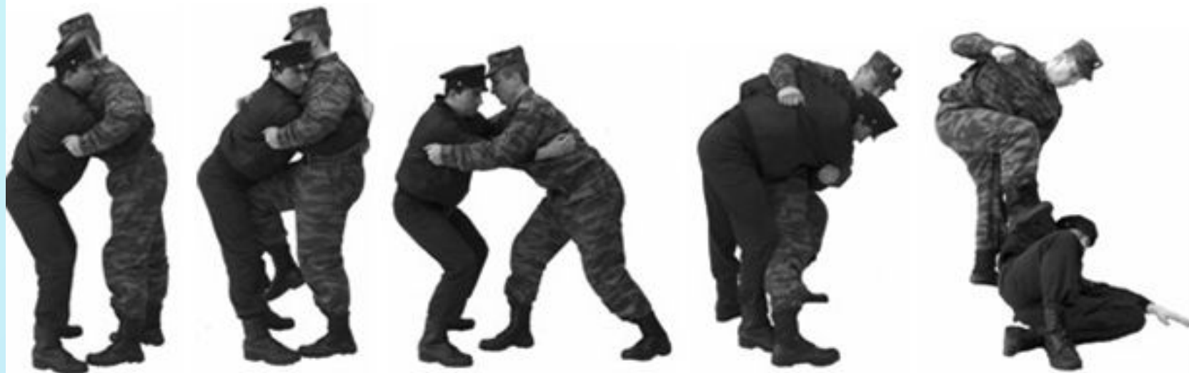
Рис. 69. Освобождение от захватов противником туловища спереди.