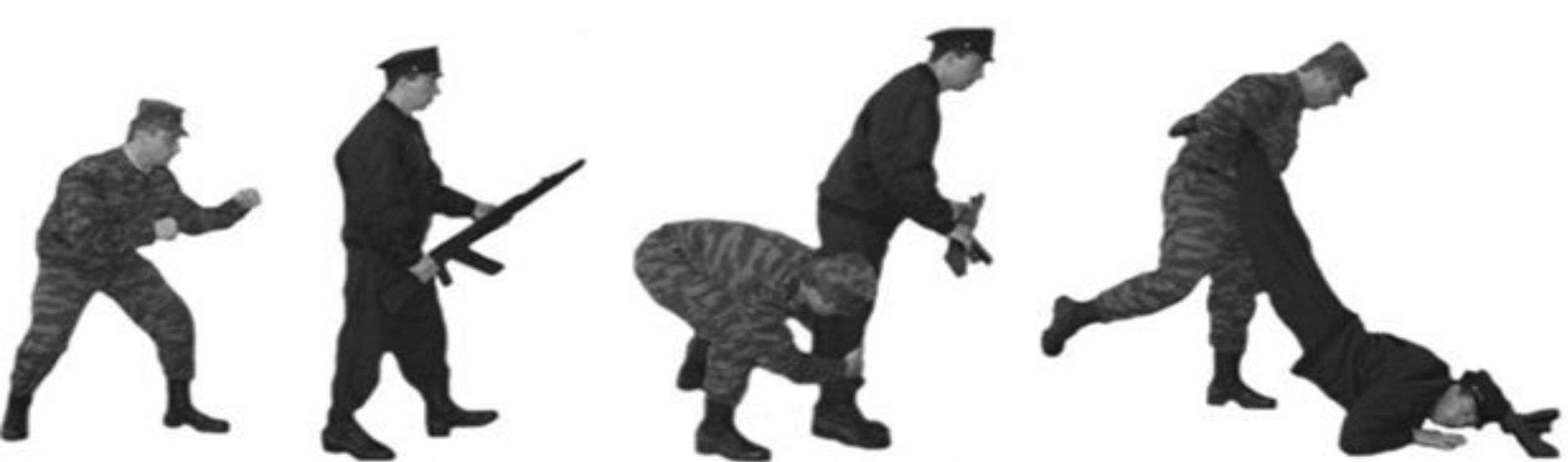
БРОСОК С ЗАХВАТОМ НОГ И УДУШЕНИЕ