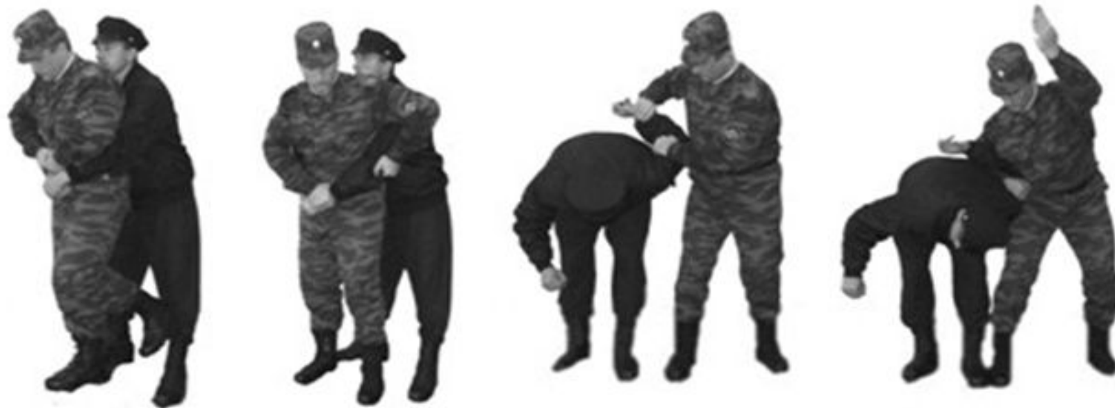
Рис. 68. Освобождение от захватов противником туловища сзади.