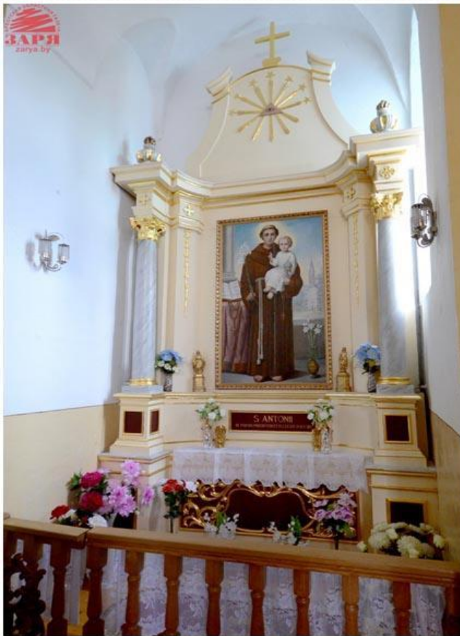
Икона святого Антония

На потолке - лепнина, которая в свое время была вызолочена, а сейчас просто покрашена. Здесь орлы из герба Радзивиллов и буквы: IHS - символ отцов-иезуитов.