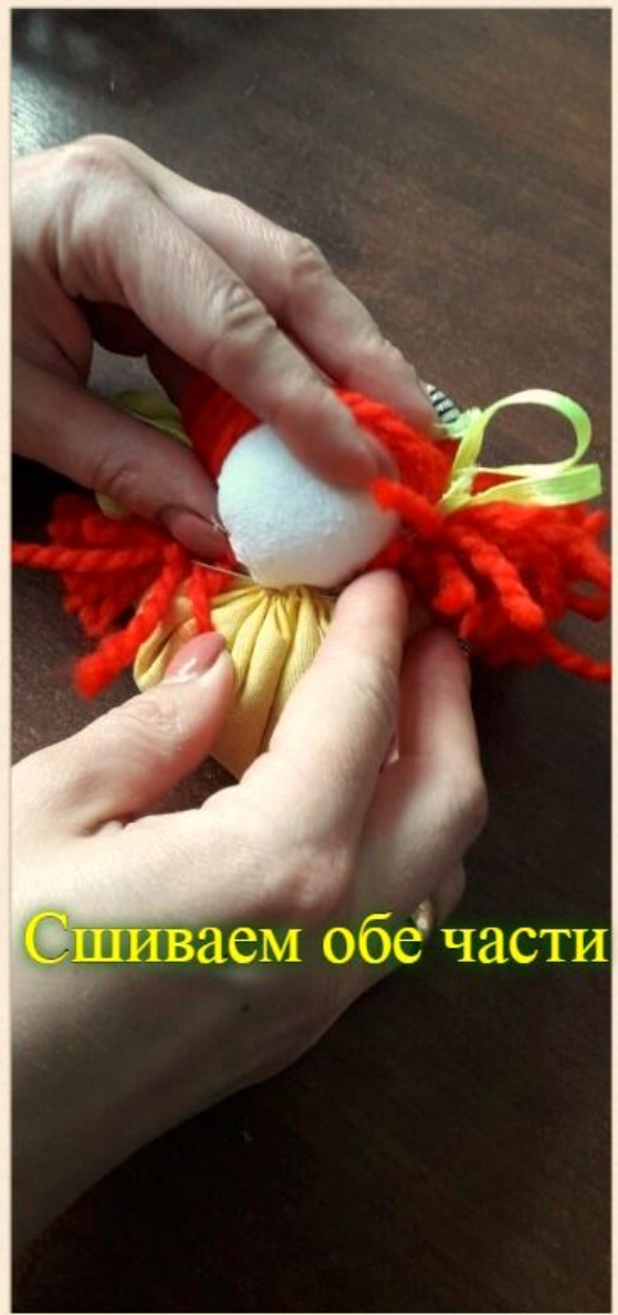
Сшиваем обе части