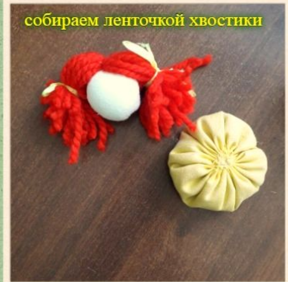
собираем ленточкой хвостики